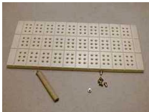
Obr. 2 Písanka kolíčková jednořádková, třířádková.