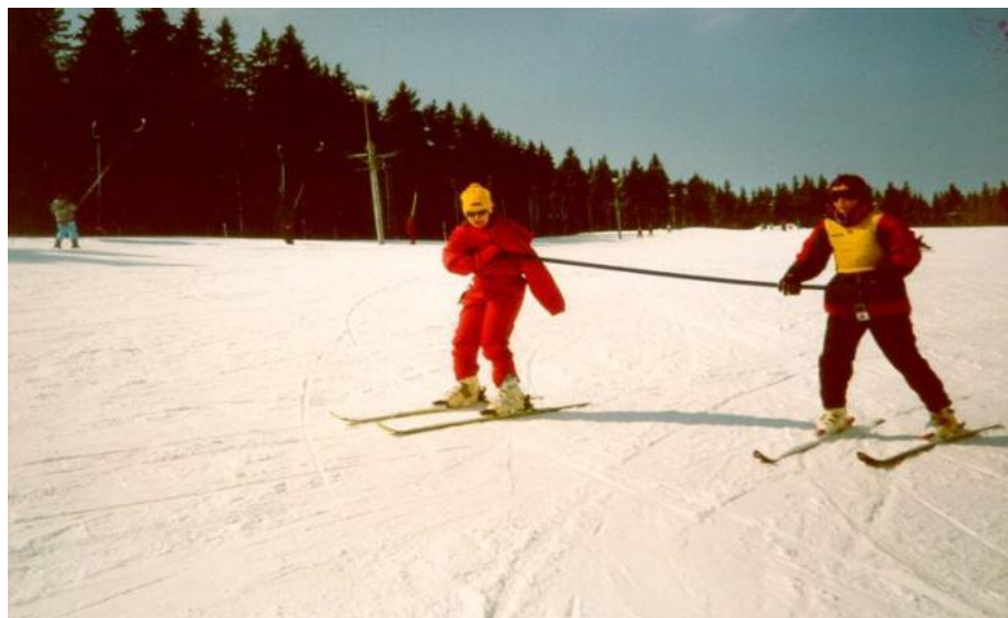
Výuka zrakově postižených začátečníků. 198