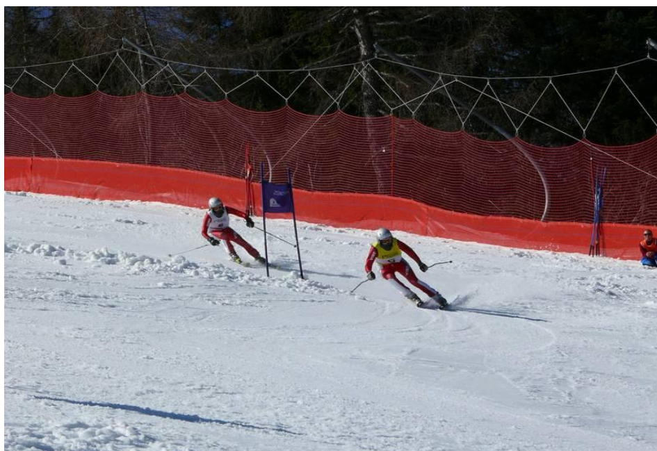
Sjezdové lyžování s trasérem. 199