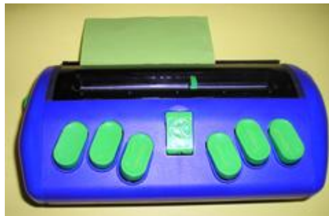
Obr. 1 Pichtův psací stroj pro nevidomé.