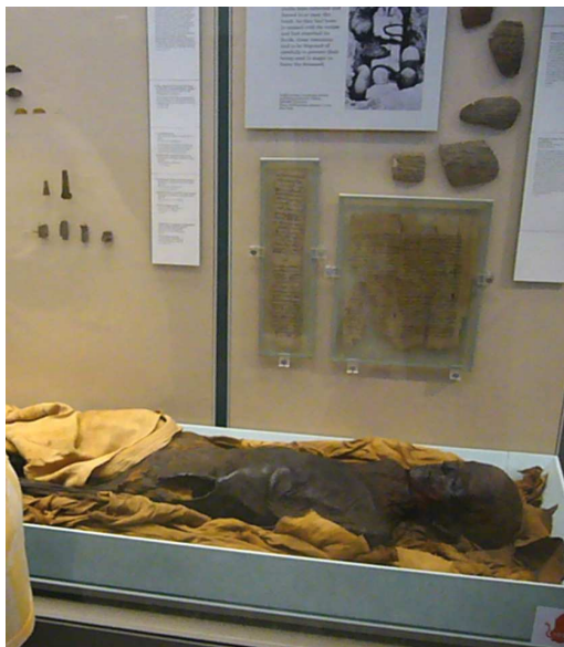
Egyptská mumie, Britské národní muzeum, květen 2007