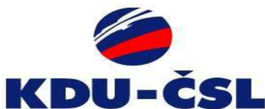
Obrázek č. 7: Logo KDU-ČSL 267

Počátky Československé strany lidové (ČSL) sahají až do 19. století, a tak je KDU-ČSL jednou z nejstarších českých politických stran. V období komunistického režimu byla ČSL součástí Národní fronty a plně se podrobila vedení KSČ. KDU-ČSL má nejvyšší koaliční potenciál z českých politických stran. Byla zastoupena ve všech českých vládách od roku 1990, kromě let 1998-2002. 268