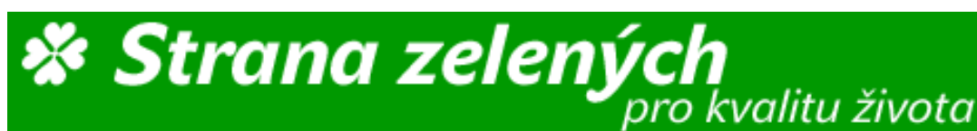
Obrázek č. 8: Logo SZ 284

Strana Zelených je nejmladší politickou stranou, která pronikla do Poslanecké sněmovny Parlamentu, a to prvně po parlamentních volbách v roce 2006. Přesto ekologicky formované politické subjekty mají v České republice i v bývalém Československu dlouholetou tradici. České ekologické formace nemohou být zařazeny na levou ani na pravou stranu ideologického spektra. Vedení Strany zelených se snaží stranu vést směrem nikoli napravo či nalevo, ale vpřed. Po volebním úspěchu v roce 1992 se zelení dostali do Poslanecké sněmovny, během dalších voleb v letech 1996, 1998 a 2002 již neuspěli. 285