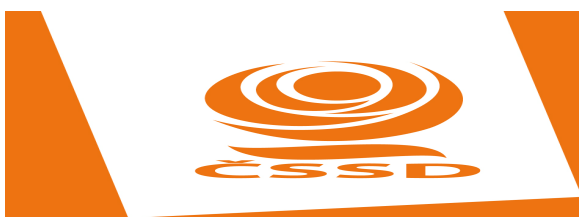
Obrázek č. 5: Logo ČSSD 226

Česká sociální demokracie vznikla již v 19. století a je stranou s historicky nejstarší tradicí. ČSSD patřila k nejvýznamnějším politickým stranám v období první republiky. „Sociální demokraté se rétoricky hlásí k sociálnědemokratickým stranám v západní Evropě a tzv. nové levici, jejich konkrétní politický program je ovšem spíše paternalistický.“ 227 V roce 1948 byla ČSSD násilně spojena s komunistickou stranou, avšak působila dále i v exilu. Po roce 1989 se začala ČSSD opět formovat do své předválečné podoby. ČSSD je považována za jednu z mála sociálnědemokratických stran v postkomunistických zemích středovýchodní Evropy, která nevznikla formováním z komunistických stran. Je na ní tak pohlíženo jako na nově vzniklou politickou stranu, která tvrdě prosazovala antikomunistickou politiku v čele s exilovým předsedou Jiřím Horákem. 228