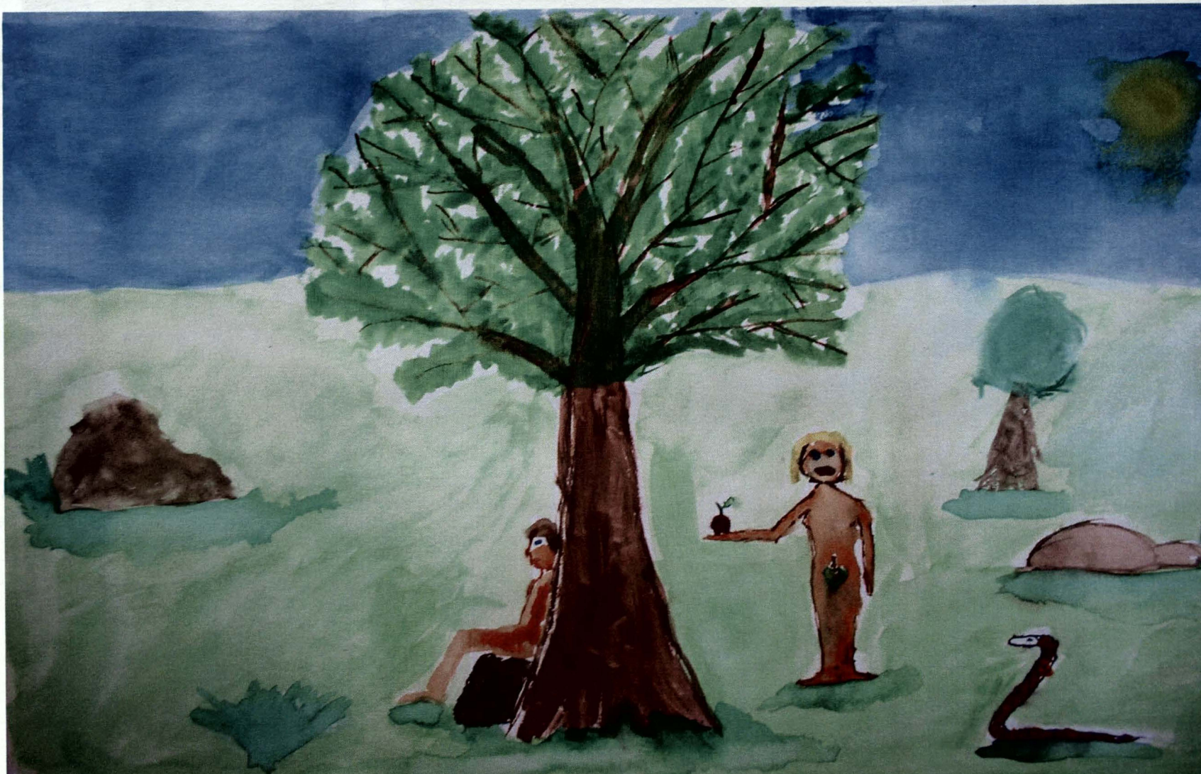
Obrázek 10) drogová závislost, muž