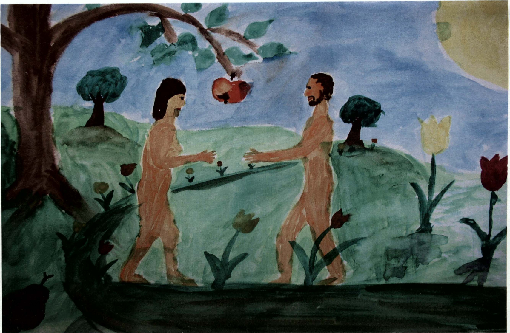
Obrázek 1) alkohol, muž