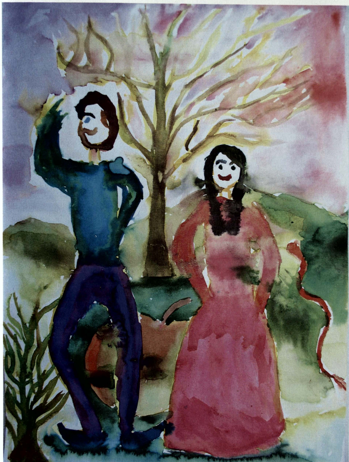
Obrázek 5) drogová závislost, žena