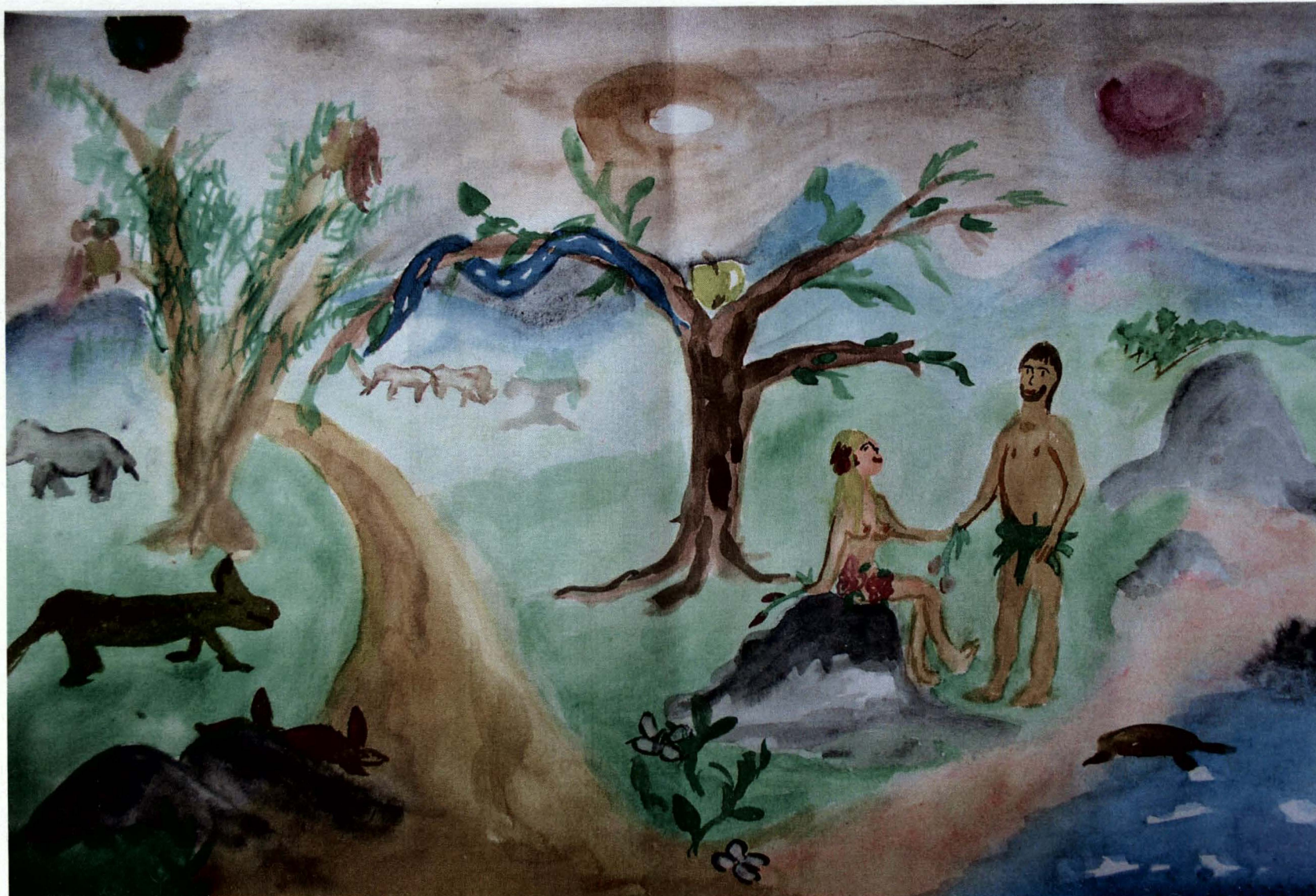
Obrázek 11) gamblerství, žena