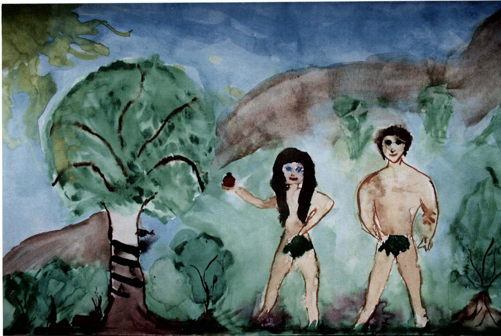
Obrázek 3) alkohol, žena