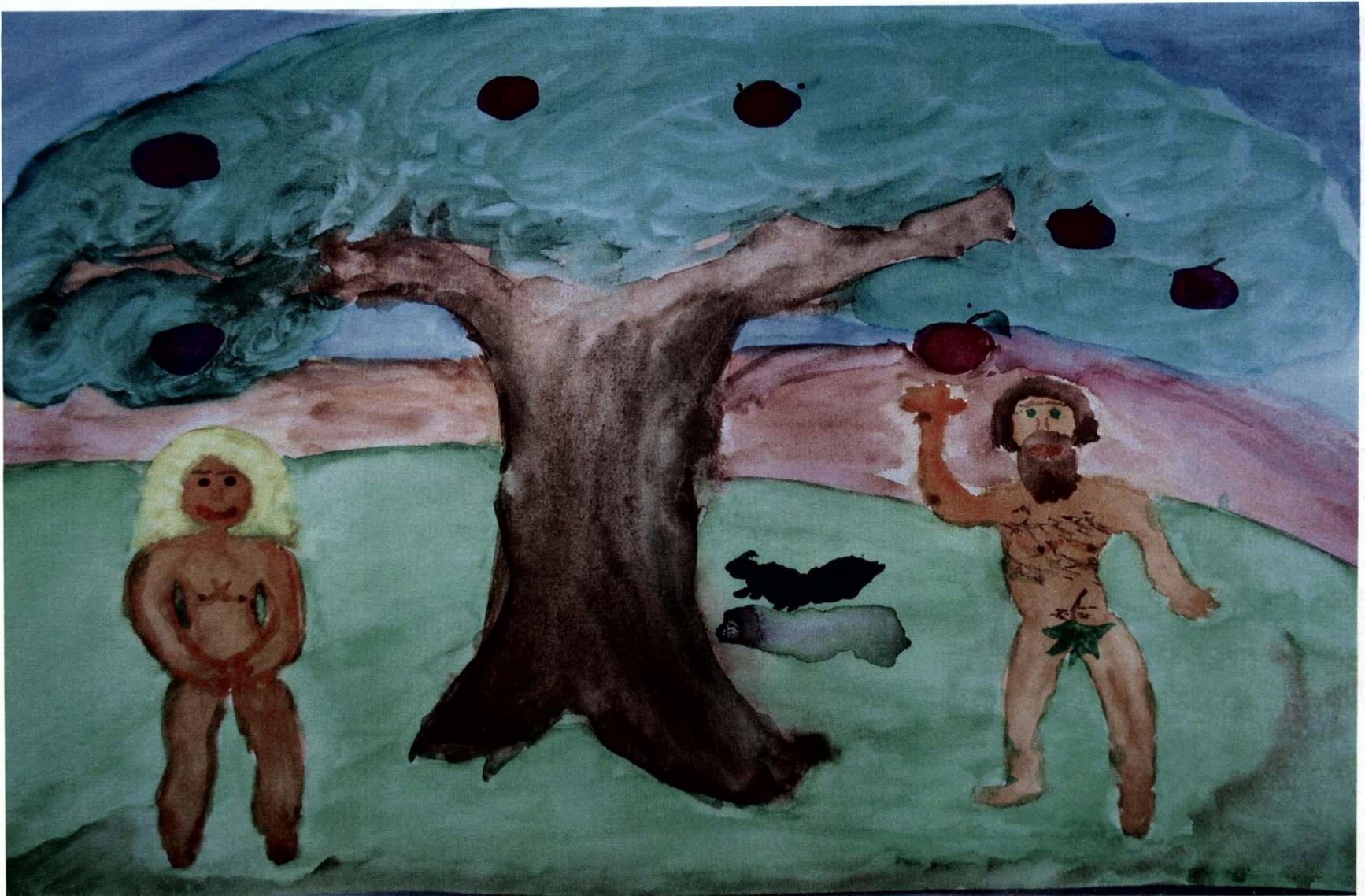
Obrázek 7) drogová závislost, žena