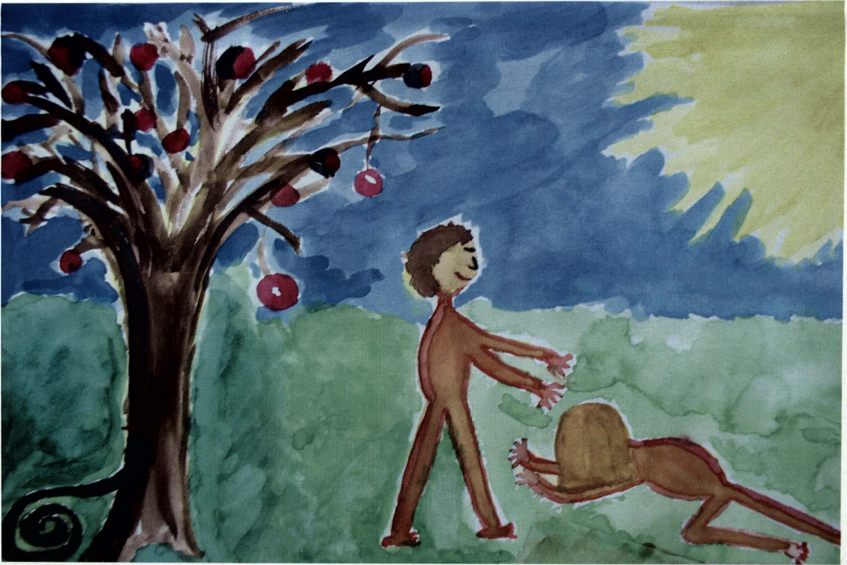
Obrázek 9) drogová závislost, žena