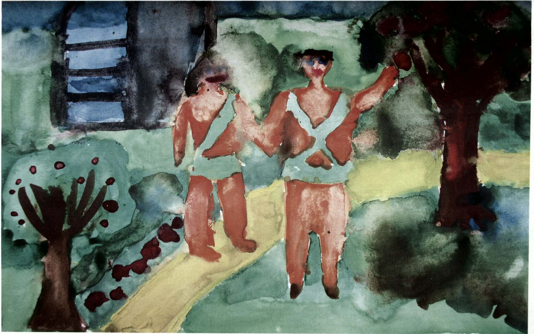
Obrázek 8) drogová závislost, žena