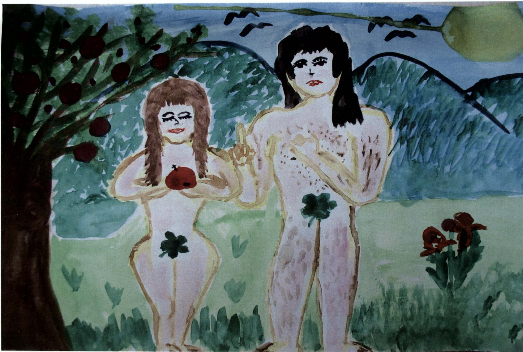
Obrázek 4) alkohol, žena