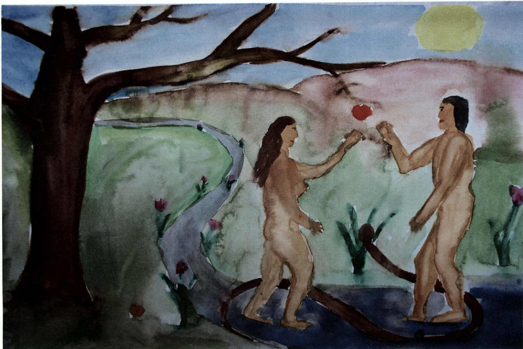
Obrázek 2) alkohol, muž (stejný autor jako u obr.1)