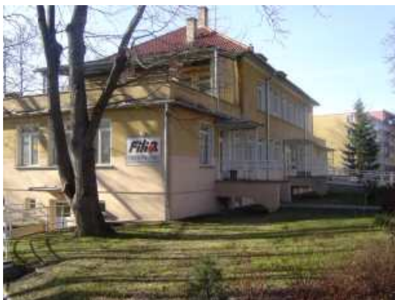
Azylový dům Filia