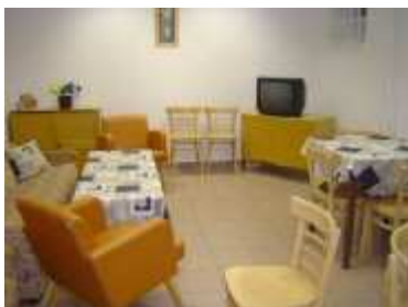
Obrázek č. 2 - 3 Společenská místnost v azylovém domě Filia

Azylový dům má celkovou kapacitu 45 míst. K ubytování uživatelů služeb je k dispozici 15 pokojů. Pokoje mají různou velikost, počet lůžek na pokoji je variabilní a je přizpůsobován individuálním potřebám ubytovaných. Pokoje sloužící k ubytování uživatelů služby „dům na půl cesty“ jsou vybaveny nábytkem a spotřebiči běžnými v domácnosti. Ostatní pokoje jsou vybaveny základním nábytkem a lůžkovinami, jeden pokoj slouží k ubytování uživatelů v akutní krizi. Kuchyňky, koupelny a WC jsou pro několik pokojů společné. Uživatelé služby mohou využívat nově vybavenou společenskou místnost s hracím koutkem pro děti a učebnu vybavenou počítačem, prádelnu, sušárny a kočárkárnu. Jednání s klienty probíhá v kanceláři sociálních pracovníků, která byla zřízena místo kanceláře vedoucí AD.