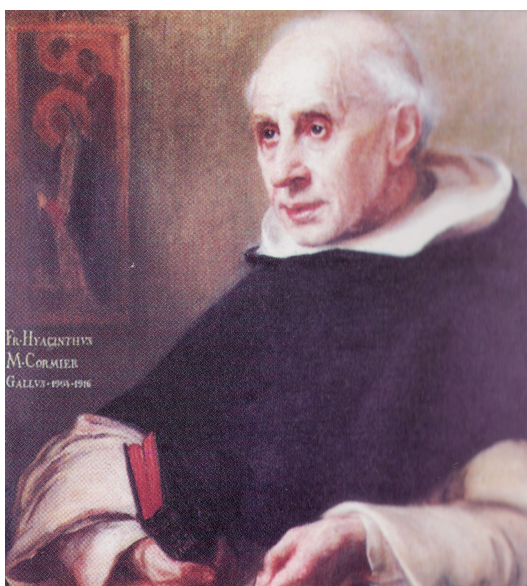
Obr.2: Otec Hyacint Maria Cormier OP (1832-1916)