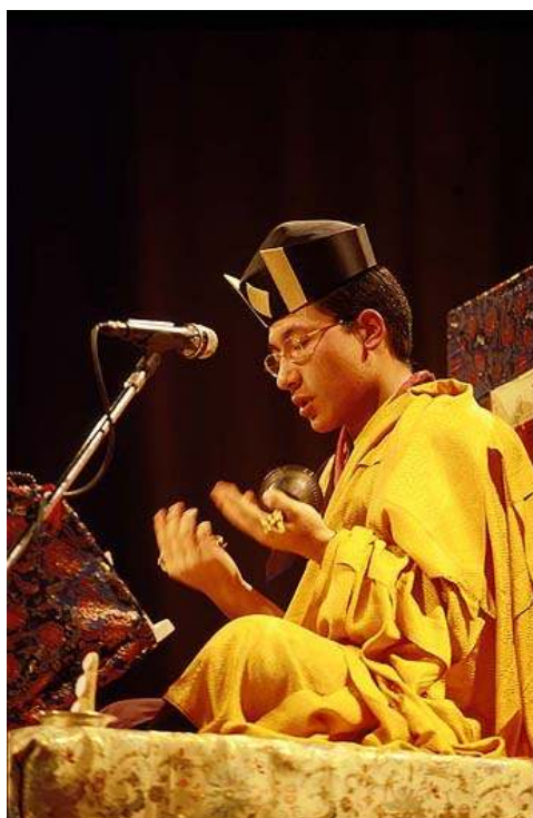
17. Karmapa Thajé Dordže