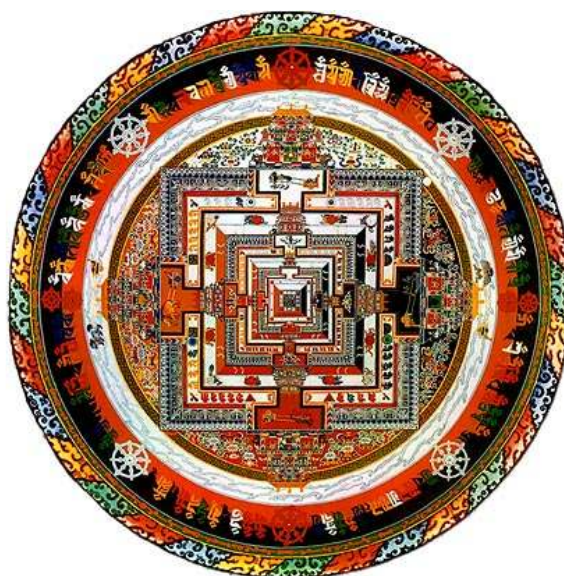
Kālačakra mandala – posvátný model vesmíru z barevného písku, který představuje palác obývaný 722 bohy a bohyněmi