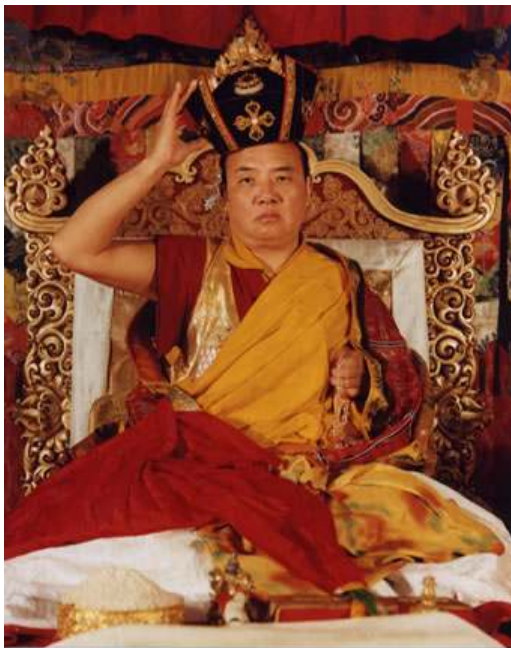
16. Karmapa Rangdzung Rigpā Dordže během ceremonii Černé koruny