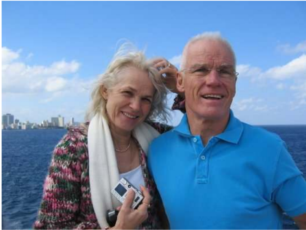
Ole a Hannah Nydahlovi