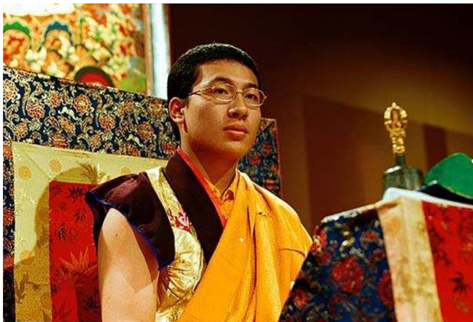
17. Karmapa Thajé Dordže v Praze