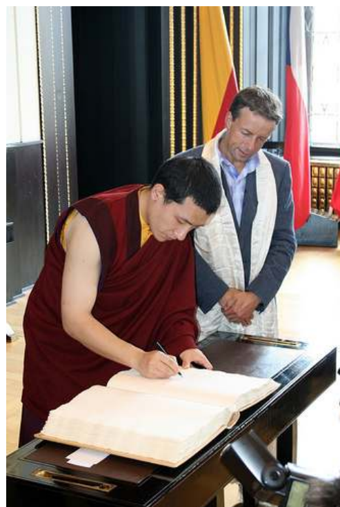
17. Karmapa Thajé Dordže na Staroměstské radnici