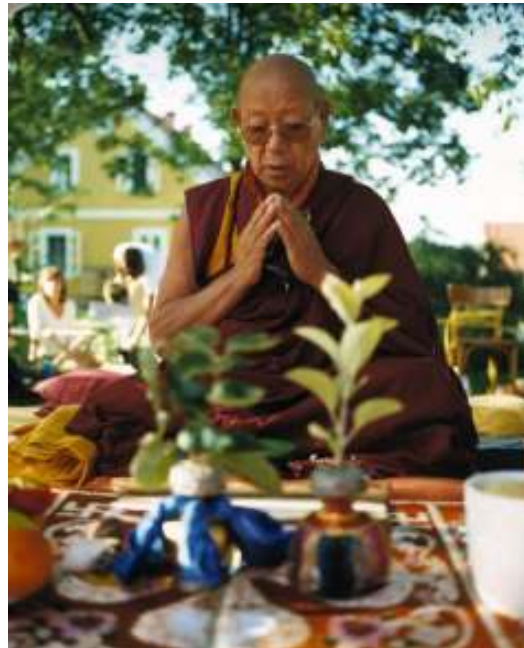
Lobpön Cechu rinpoče