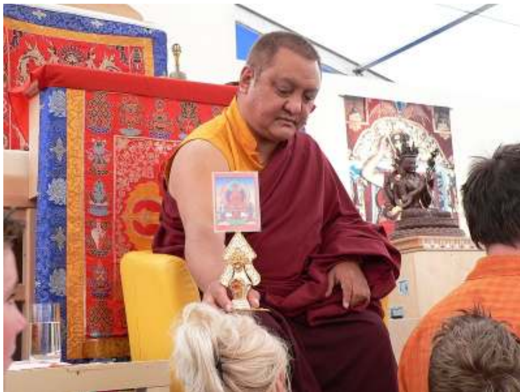
14. Šamar rinpoče Mipham Čökji Lodö