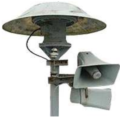
obr. 1 Rotační siréna