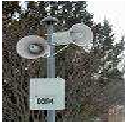
obr. 2 Elektronická siréna