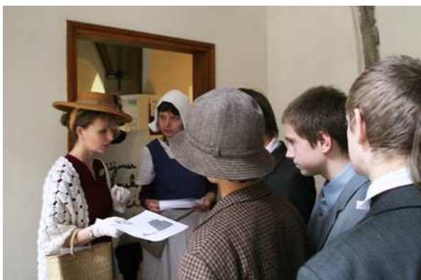
Obr. 1 Co znamenal Černý pátek na Newyorské burze?

Začínat hned na úvod hospodářskou krizí není zrovna veselé. Za počátek krize je považován 25. říjen 1929, zvaný jako „Černý pátek“. Rozplétat důvody, proč se pád akcií tak dramaticky projevil v evropských zemích, je příliš složité – tím nejdůležitějším bylo, že americké banky, které pomáhaly svými penězi válkou zničené Evropě na nohy, potřebovaly najednou většinu financí na krytí ztrát v Americe. Mnohé podniky v Evropě musely propouštět, nezaměstnanost zasáhla také Československo. Nejhorší situace byla v Německu, které muselo navíc platit tzv. reparace za to, že rozpoutalo ničivou 1. světovou válku. A zde vidíme paradoxy dějin – důsledky hospodářské krize, mimo jiné, dostaly k moci Hitlera, který pak o několik let později uvrhl Evropu do války ještě ničivější.