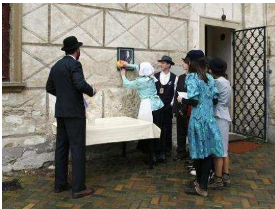
Obr.3 Nad džbánem třebíčské ZONky jsme rozprávěli o Masarykovi

Když se stal prezidentem , bylo mu 68 let a byl milován celým národem jako tvůrce republiky. Nebylo tomu tak ale vždy. Před první světovou válkou působil ve Vídni, nejprve jako vysokoškolský profesor, později jako politik. Často byl kritizován, zejména v době, kdy napadl pravost rukopisů Zelenohorského a Kutnohorského. Na svých četných cestách do zahraničí se seznámil s Charlottou Garrigue, se kterou se r. 1878 oženil. Tehdy si přidal do jména i ono zvláštní slovo Garrigue. Po vypuknutí 1. světové války musel pro své protiválečné postoje utéct do zahraničí. Od té chvíle neúnavně usiloval o osamostatnění Československa. Zasloužil se o vznik českých vojenských legií, které se v bojích velmi vyznamenaly. Úřad prezidenta zastával až do roku 1935.