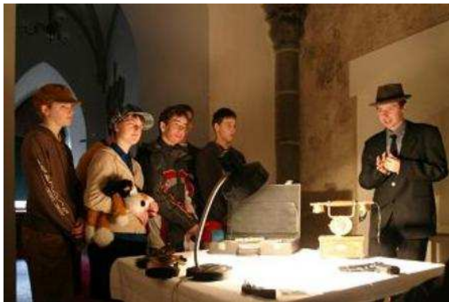
Obr. 4 Návštěva mafiánského doupěte