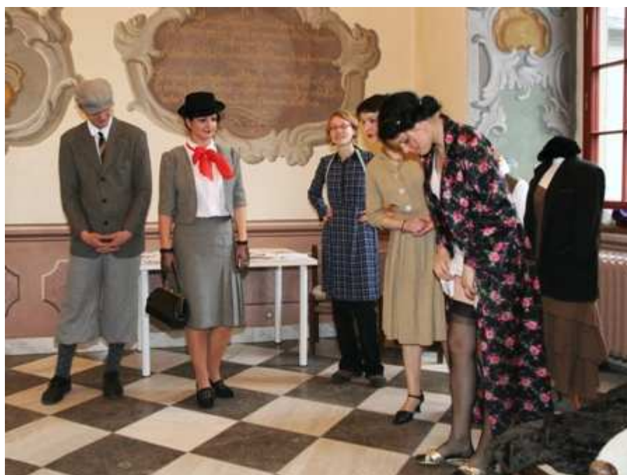
Obr.2 Návštěvu módního salónu si nemohl dovolit každý

Návštěvu módního salónu si nemohl dovolit každý. Přesto přineslo meziválečné období mnoho módních vln a stylů. Ženské šaty se staly odvážnějšími, sukně se zkracovaly. Eleganci bylo nutné podpořit těsnými moderními punčochami, které se připínaly k pasu pomocí podvazků. V té době dokonce začaly ženy nosit kalhoty, což byla věc u žen dosud nevídaná. Oproti tomu se na venkově oblékali lidé stále postaru. Boty nosili jen v zimě, nebo v neděli do kostela. Ve většině případů si jen nazuli dřeváky, jak na svých obrázcích maloval pan Lada. Tajemná spínadla, která jste měli poznat byly manžetové knoflíčky, kterými se spínaly manžety na rukávech svátečních košilí.