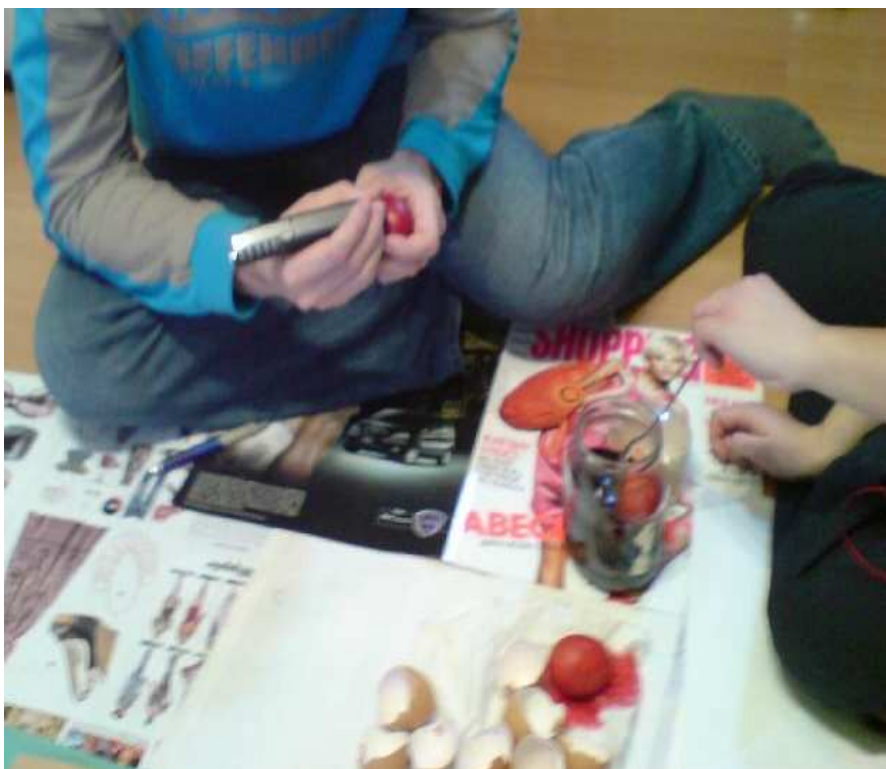
Obr. 1. Červené vajíčko vyškrované nožem