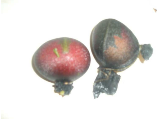
Obr. 4. Vajíčka vyndaná z fáče