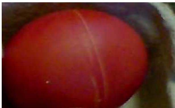
Obr. 1. Vajíčko s gumičky ponořené do barviva