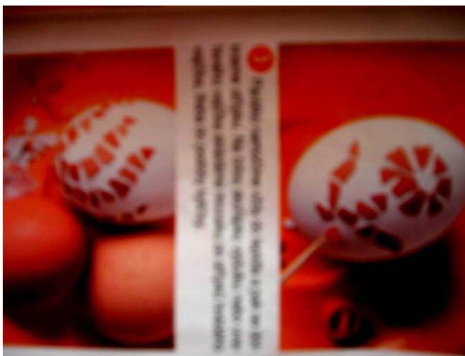
Obr. 2. Technika barvení vajíček