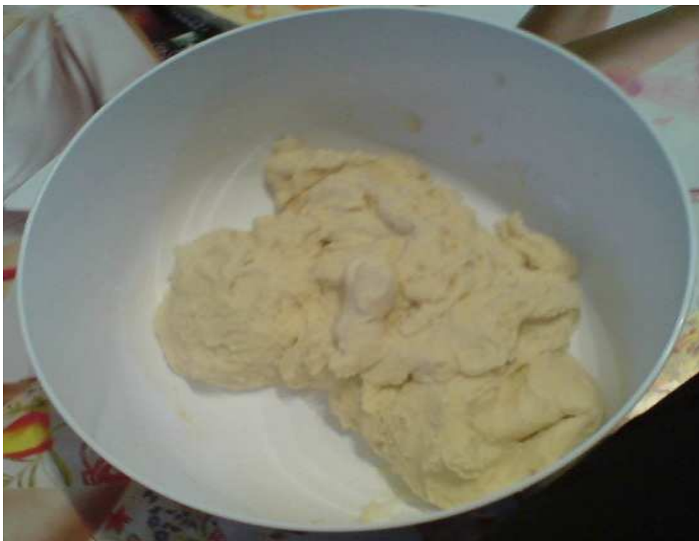
Obr. 1. Těsto na Velikonoční symboly