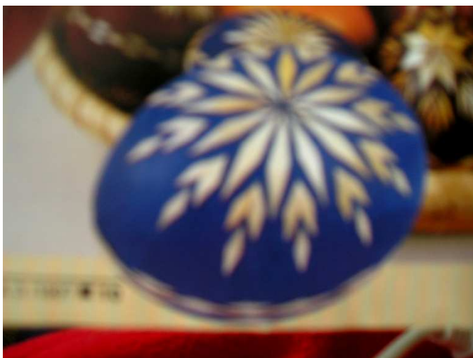
Obr. 8. Vajíčka barvená a lepená slámou