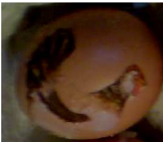
Obr. 1. Vajíčko polepené slepičkou z ubrousku