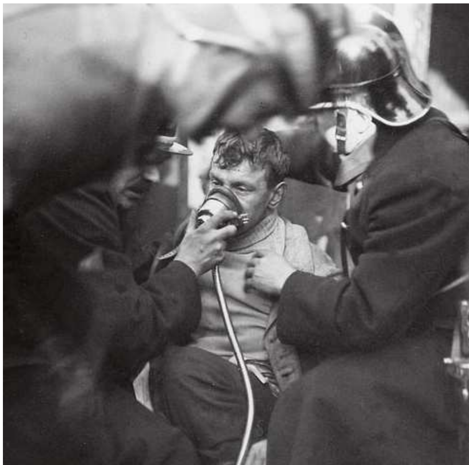
Oživování křísicím přístrojem, negativ 9x9 cm, 9. 2. 1934 Záchrana osoby při čištění vlakové cisterny na nákladovém nádraží Strašnice. (22)