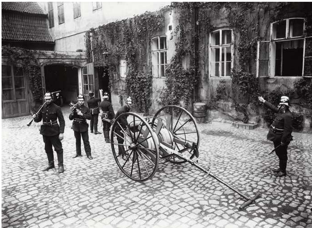
Příprava k požárnímu útoku , negativ 13x18 cm, blíže nedatováno a neurčeno Aranžovaná fotografie pro propagační účely, reminiscence na začátky hasičů. (22)