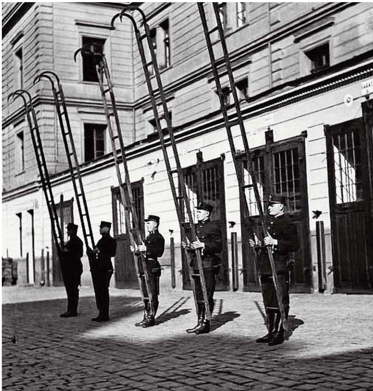
Cvičení s hákovými žebříky, rok 1928, blíže neurčeno Fotografie z negativů v dřevěné krabici označené popiskem „Velké negativy“. (22)