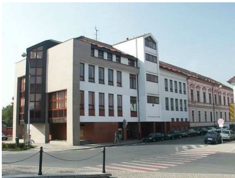
Fotografie č. 2: Střední zdravotnická škola Písek (23)