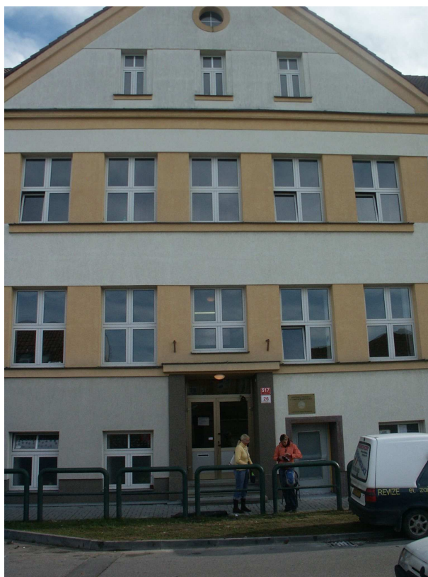
Fotografie č. 11: Archiv autorky