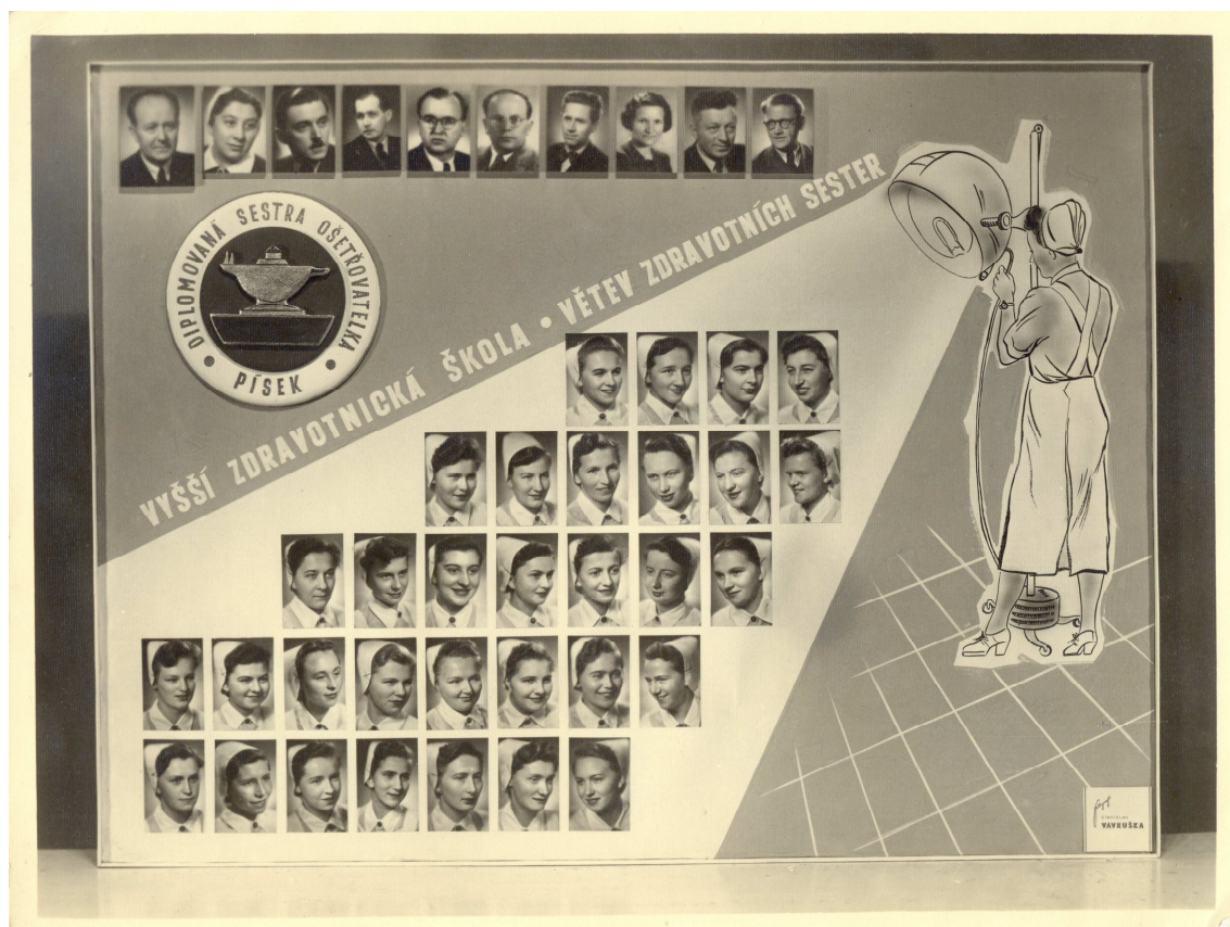
Fotografie č. 8: Zapůjčeno z archivu respondentky Evy Václavíkové

Kdybych byla mladá a měla si volit povolání, stala bych se zdravotnicí, ale nevím, zda by se mi líbilo v dnešním zdravotnictví. Domnívám se, že dobrá sestra se dá vyškolit za čtyři roky a těch někdy požadovaných devět a někdy se specializací více, vede k tomu, že nikdo nechce pracovat rukama.