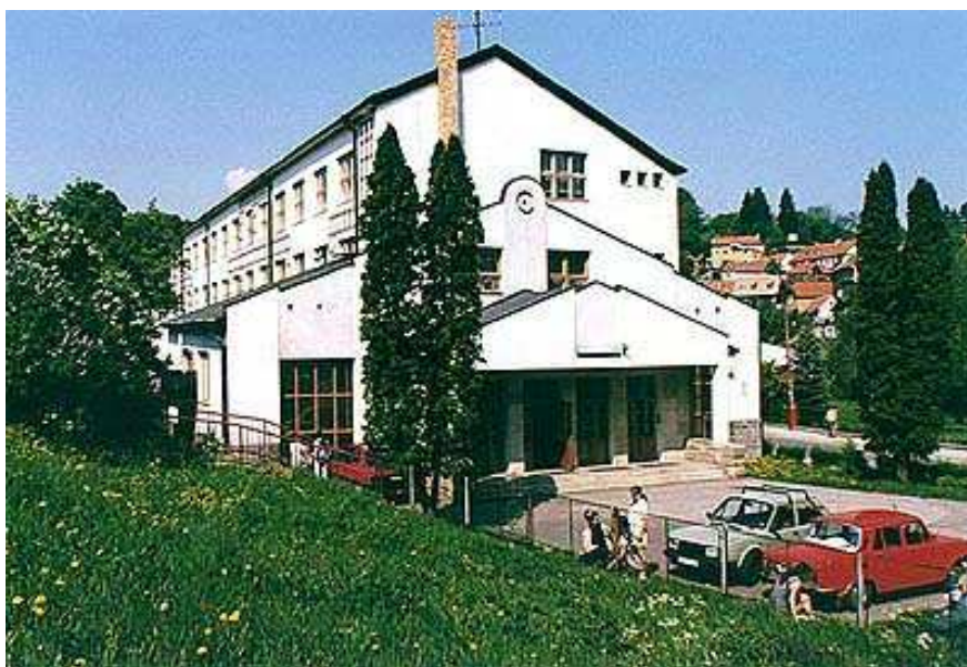
Fotografie č. 5: Střední zdravotnická škola Český Krumlov (21)

V současné době se na škole vyučuje obor zdravotnický asistent. Absolventi mají uplatnění v ošetrovatelské péči v oblasti prevence a léčby dětí, dorostu a dospělých. Obor sociální péče - sociální činnost pro etnické skupiny je denní čtyřleté studium s maturitou. V tomto oboru je kromě základních předmětů vyučován romský jazyk, základy pedagogiky a rodinná výchova (21).