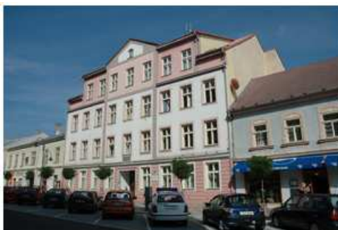
Fotografie č. 4: Střední zdravotnická škola Jindřichův Hradec (22)

Ve spolupráci s ministerstvem školství provádějí osvětovou práci s dětmi na různá témata, například informace o lidském těle, zdravá výživa, péče o chrup, prevence úrazů a poskytování první pomoci (22).