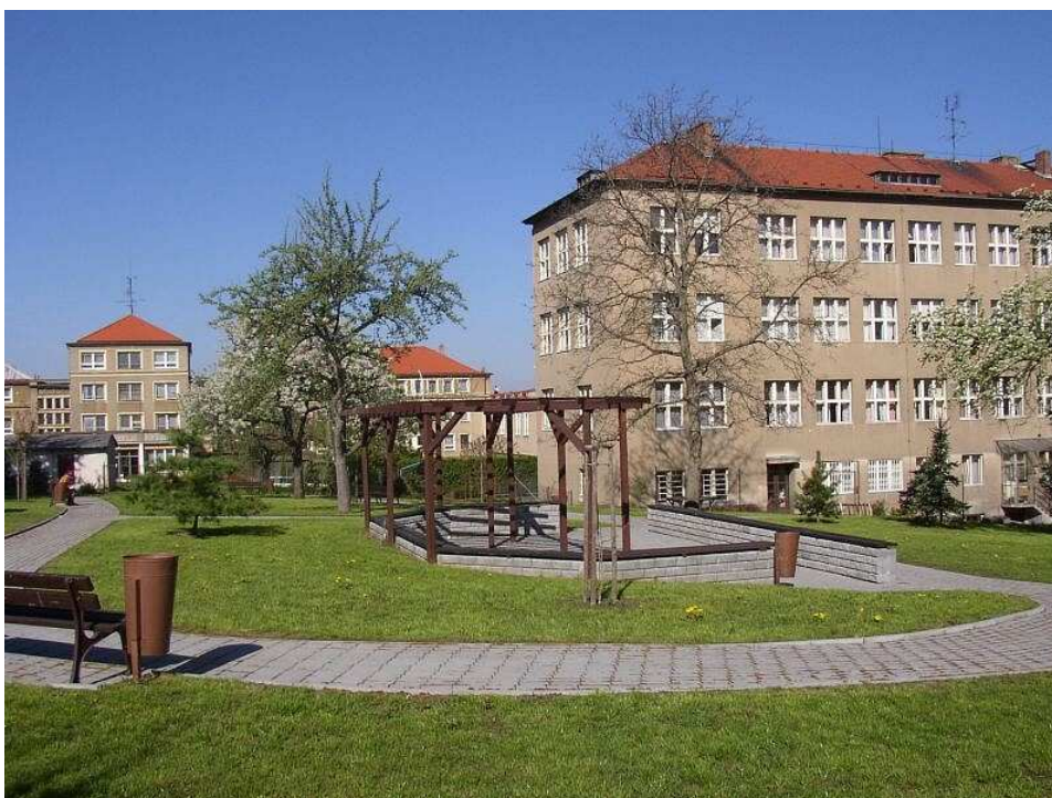
Fotografie č. 3: Střední zdravotnická škola Tábor (15)

z dětského oddělení nemocnice. Škola spolupracuje s Farní charitou Tábor, která dobrovolníky eviduje a pomáhá vybírat vhodné klienty. Informace o aktivitách a dobrovolnictví se prezentuje formou nástěnky s fotografiemi a besedami se zájemci z řad 1. ročníku. Tato dobrovolná činnost přináší studentům pocit uspokojení a seberealizace, navázání nových přátelských vztahů, nové zážitky, posun v životních hodnotách a získání nových dovedností a zručností. Dobrovolnictví v komunitní péči škola provádí od roku 1982 a od září každého školního roku zapojuje nové zájemce o tuto prospěšnou činnost (18).