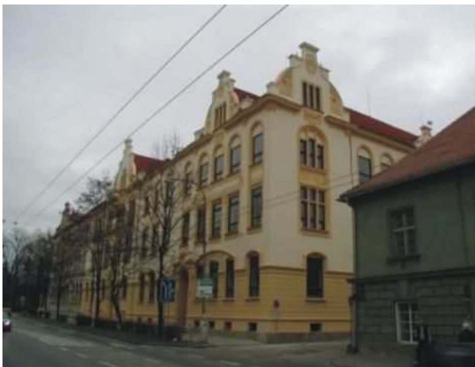
Fotografie č. 1: Střední zdravotnická škola a Vyšší odborná škola zdravotnická České Budějovice (7)