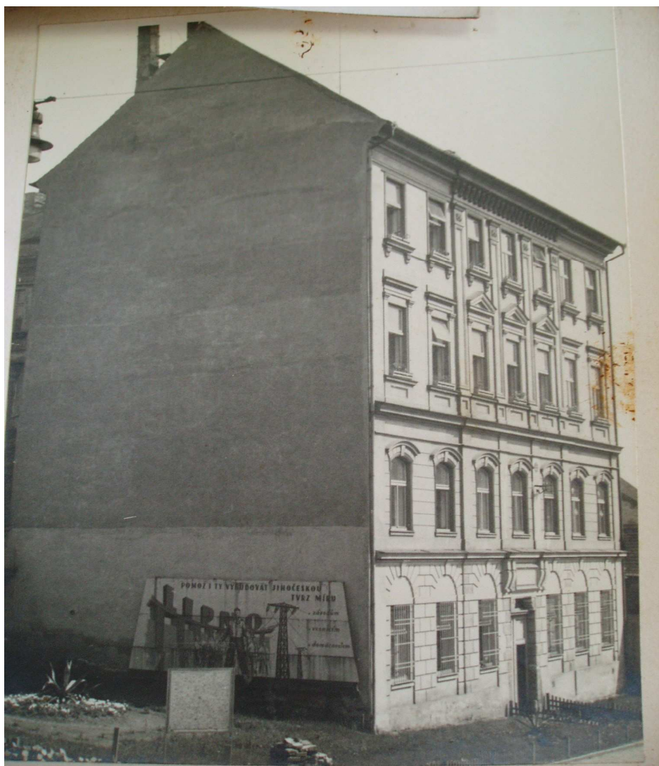
Fotografie č. 6: Zdravotně sociální škola Strakonice (11)