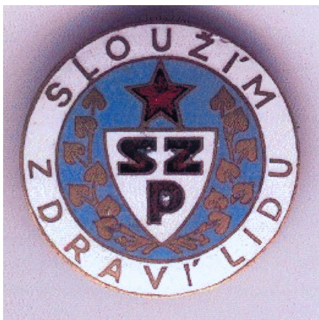
Fotografie č. 9.

V době, kdy jsem nastoupila na oddělení mi dosavadní střední odborné vzdělání zdravotní sestry stačilo, ale postupem času se stále zvyšovaly a zvyšují požadavky na sestry a tomu by mělo odpovídat i vzdělávání sester.