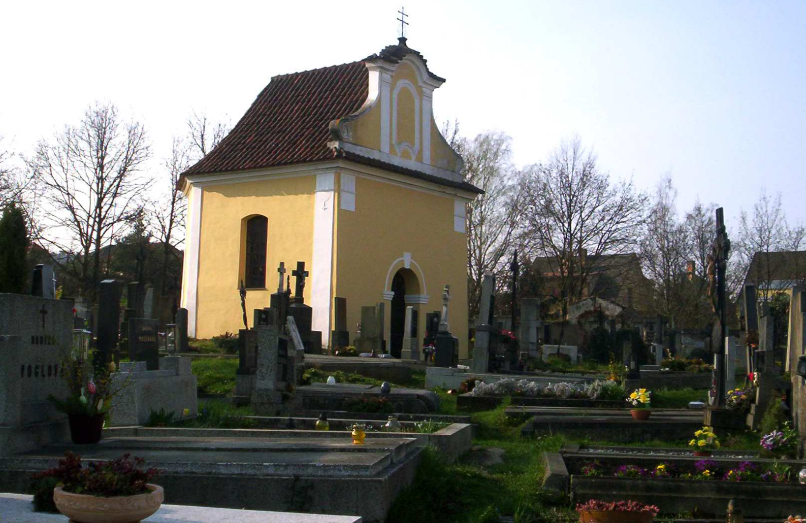
Příloha č. X