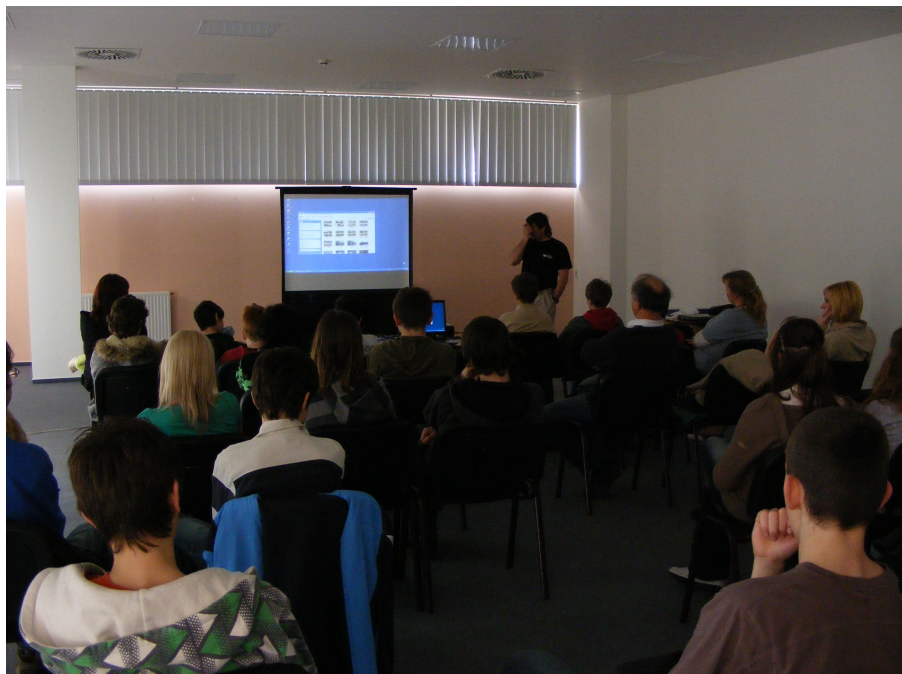
Policisté na dětském táboře společně s BESIPEM