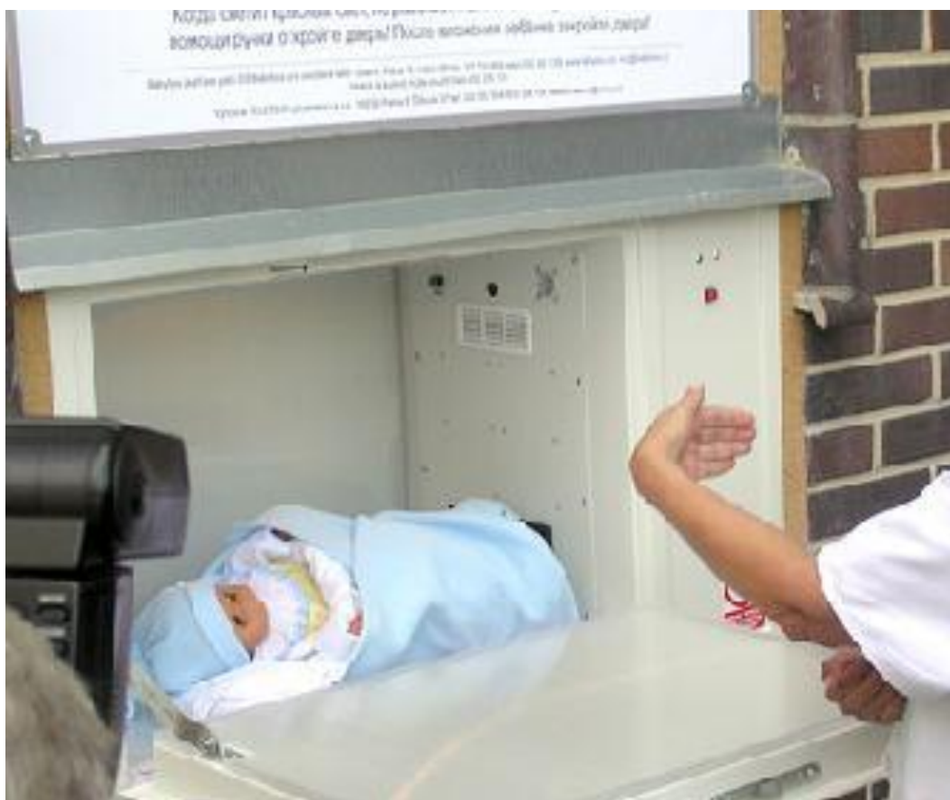
Obrázek č. 2: Prostor uvnitř babyboxu