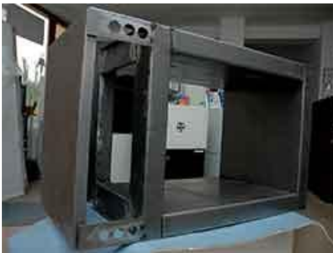
Obrázek č. 1: Ocelová konstrukce babyboxu