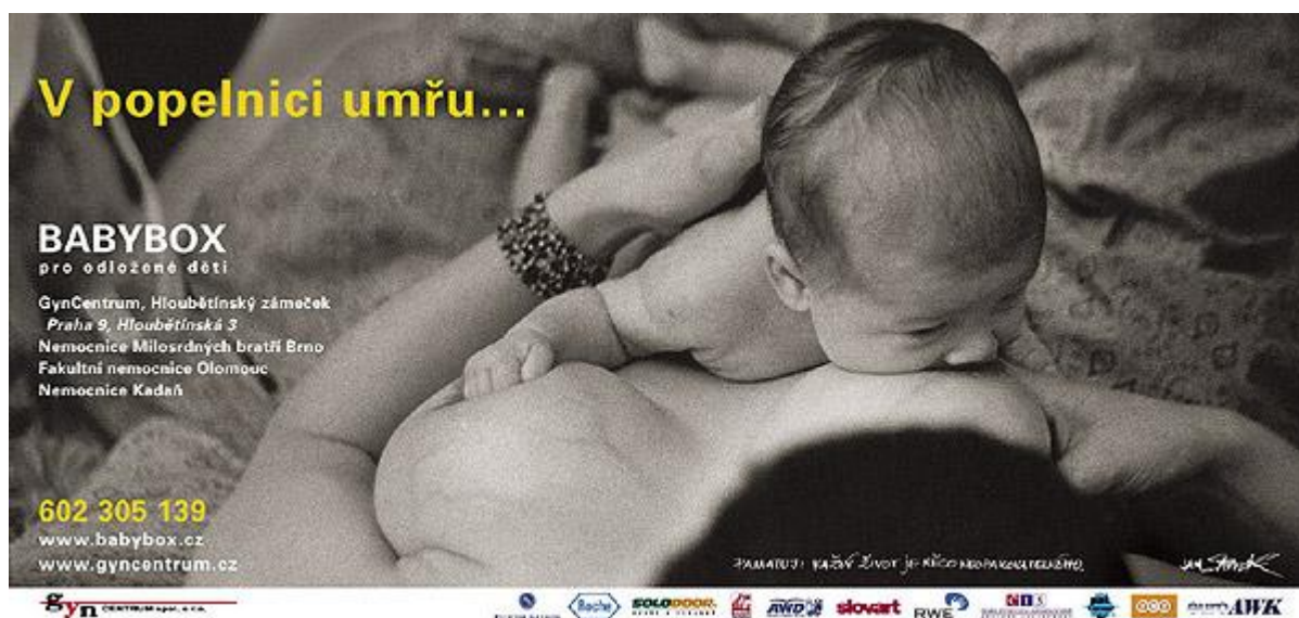
Obrázek č. 6: Billboard na podporu babyboxů