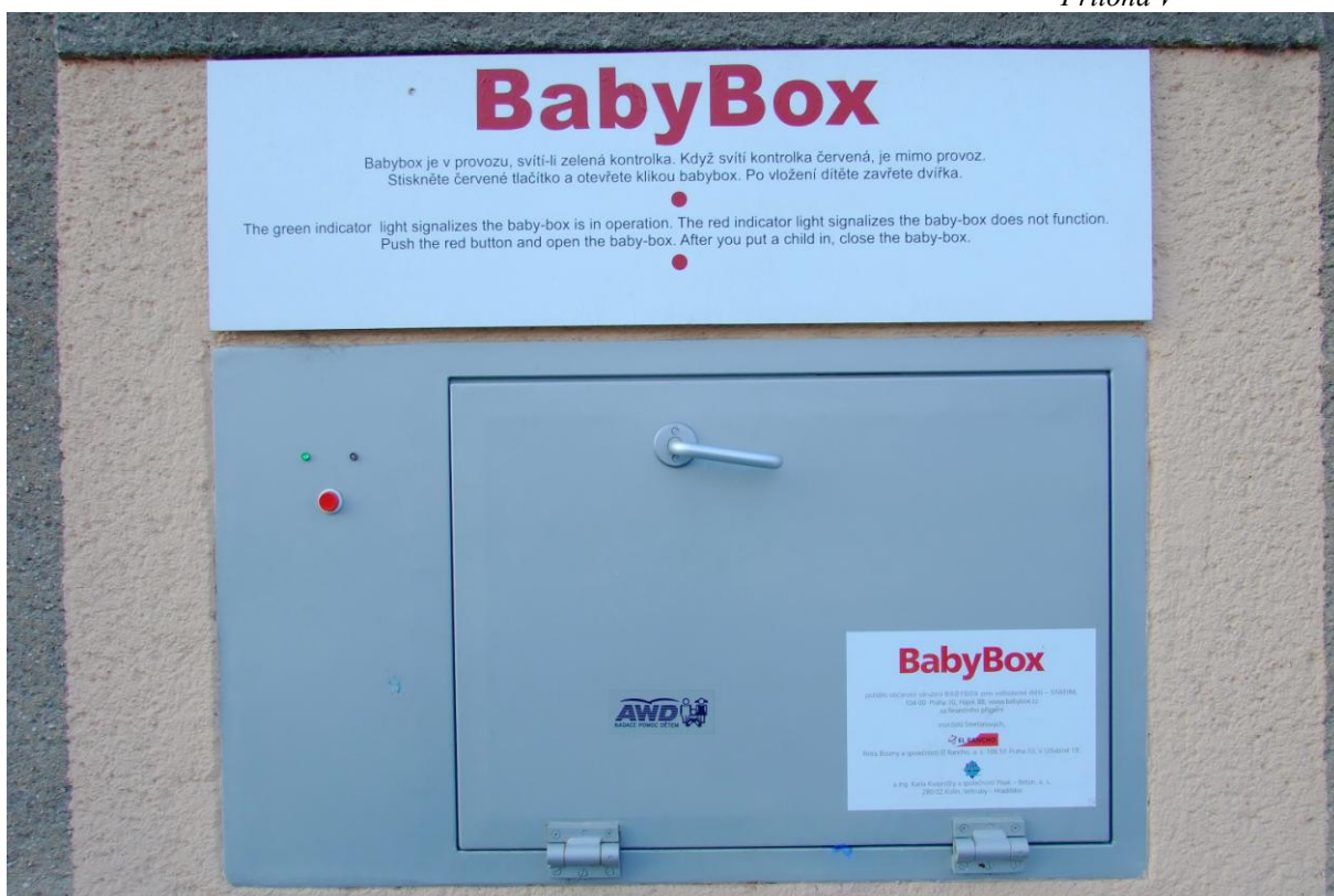
Obrázek č. 3: Venkovní dvířka schránky