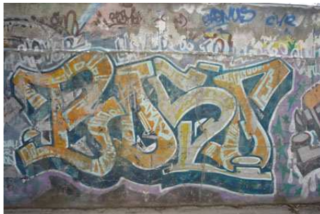
Writer BOSO 1994 – 98.