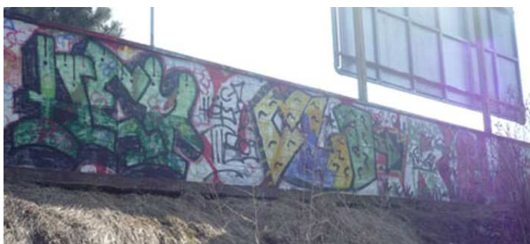
Nejstarší graffiti v Českých Budějovicích, foto: archiv autorky