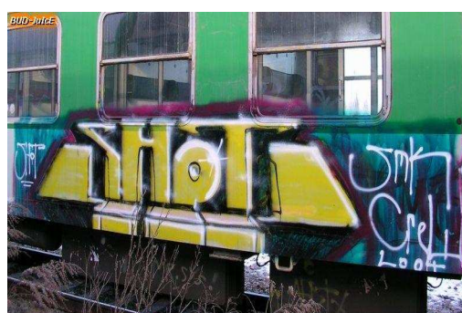
Vlaky, České Budějovice, foto: bud – juice, dostupné na: < http://juice.budweis.net/ > .