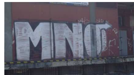
Piecy, České Budějovice, foto: archiv autorky.