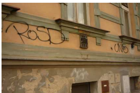
Tagy, České Budějovice, foto: archiv autorky.