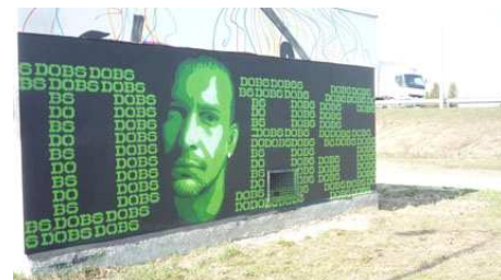
DOBS: charakter .