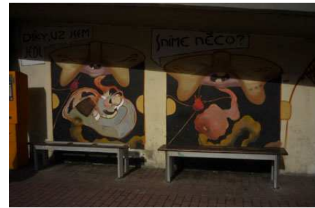
Graffiti z festivalu „Barvy Ulice“.