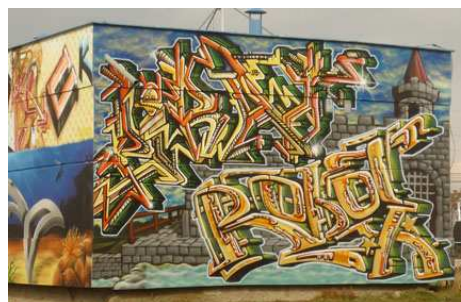
Piecy , České Budějovice, foto: archiv autorky.