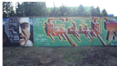
Graffiti trochu jinak, České Budějovice, foto: archiv autorky.