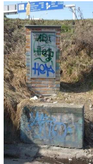
Piecy a tagy, České Budějovice, foto: archiv autorky.