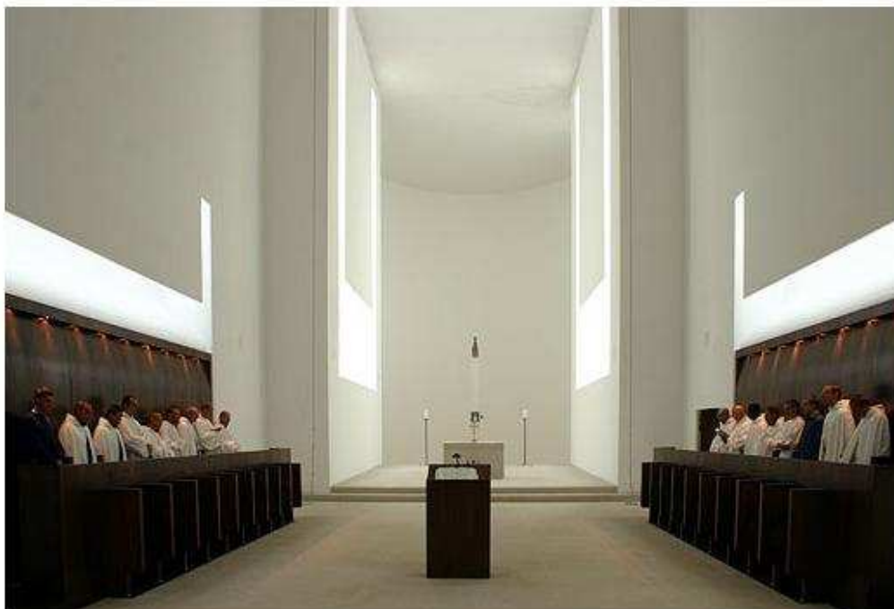
Kostel trapistů Matky Boží na Novém Dvoře