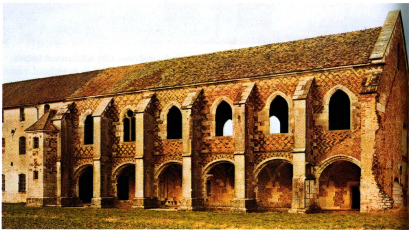
Stará knihovna, nejstarší dochovaná architektonická památka z XV. století v Cîteaux.