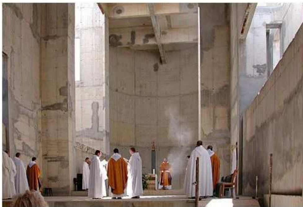
Výstavba kostela na Novém Dvoře

Obrázek 7 – Klášter Nový Dvůr. Prameny: Tamtéž.