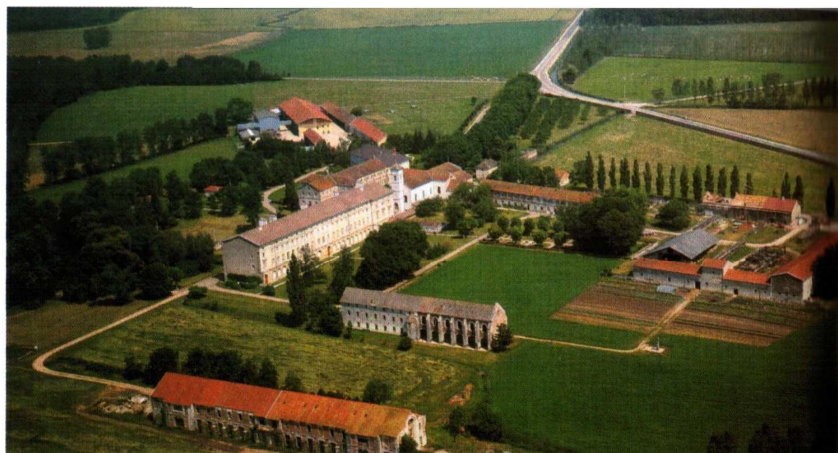
Opatství Cîteaux dnes působí z ptáčí perspektivy velmi nenápadně, skoro jako shluk jakýchsi hospodářských stavení. Silnice v pravé horní části směřuje do nedalekého Dijonu.

Obrázek 3 – Stará knihovna z 15. st. v Cîteaux.