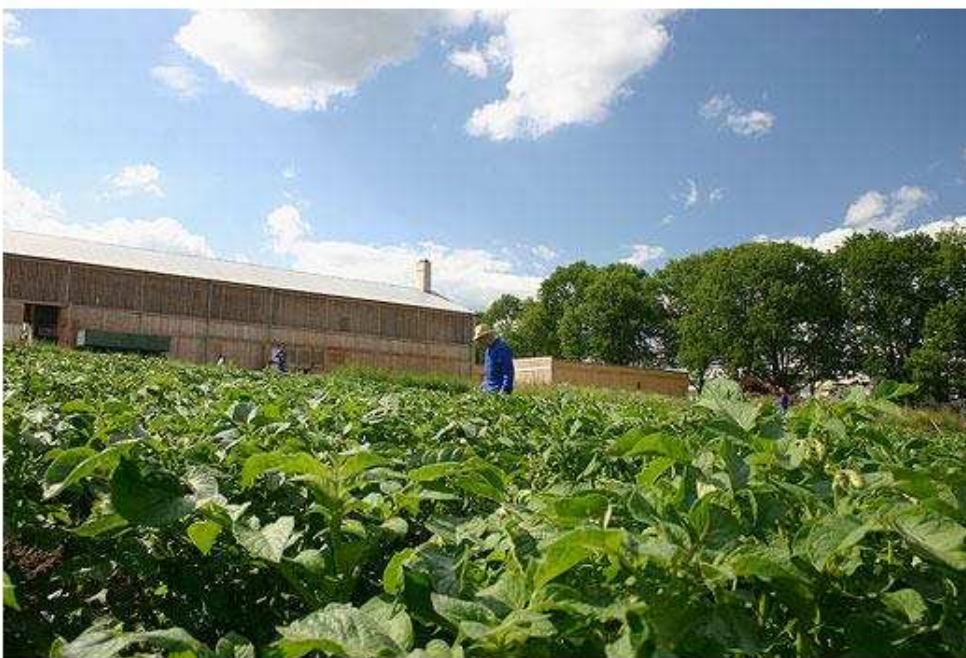
Bratři trapisté při práci