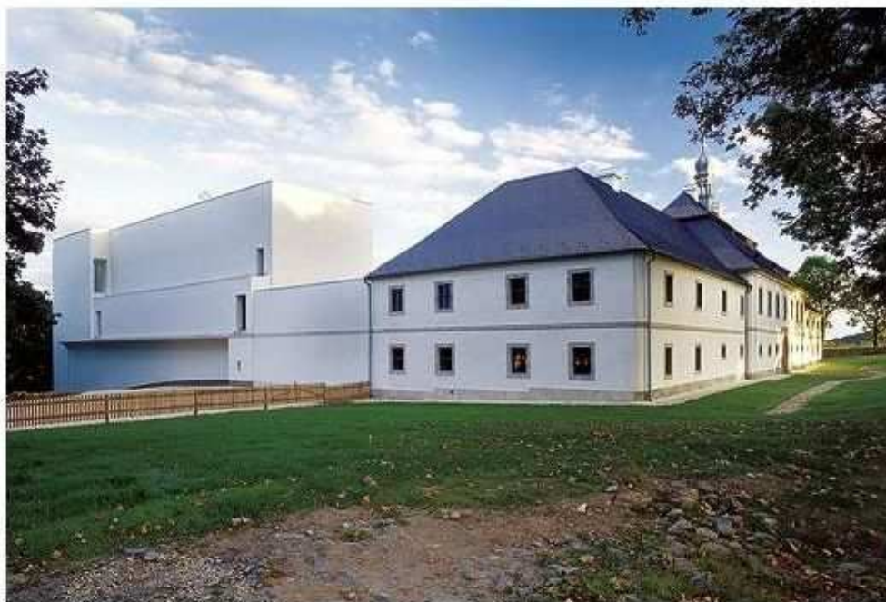
Klášter trapistů na Novém Dvoře