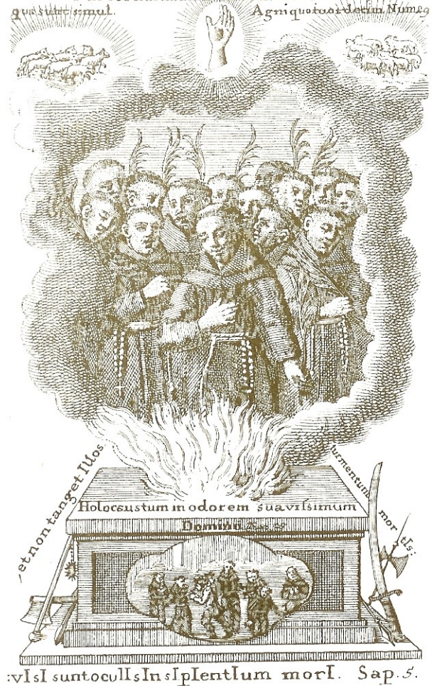
Příloha II – Rytina z františkánských mučedníků z roku 1777, která se nachází v knize Thesaurus Franciscanus od P. Gangulphi Blaník OFM

Die 15. February. Venerabiles Martyres qVatVorDeCIM Pragæ ad Naves interfecti. Justorum animæ in manibus Dei sunt, quæ sunt simul. Agni quatuordecim Numera