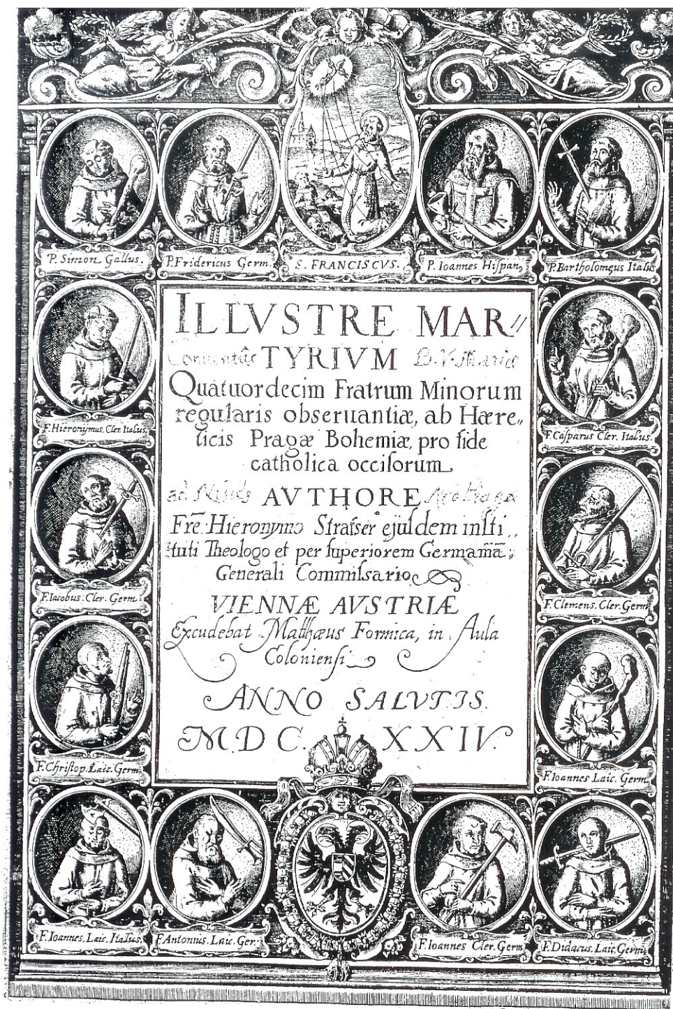
Příloha III – Úvodní strana kroniky P. Jeronýma Strasera Illustre martyrium quatuordecim Fratrum Minorum... , františkánští mučedníci jsou zde vyobrazeni s nástroji svého umučení