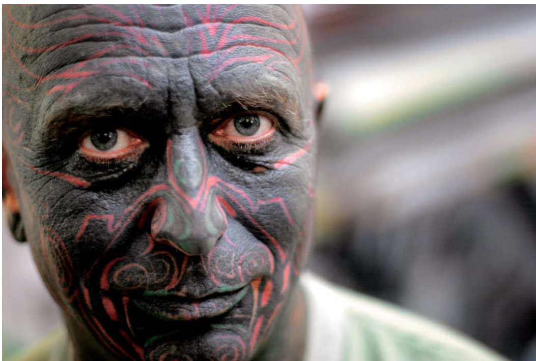
... a nyní