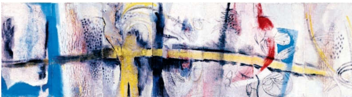
Třeboň - třeboň!

technika/technique: kombinovaná technika/acryl