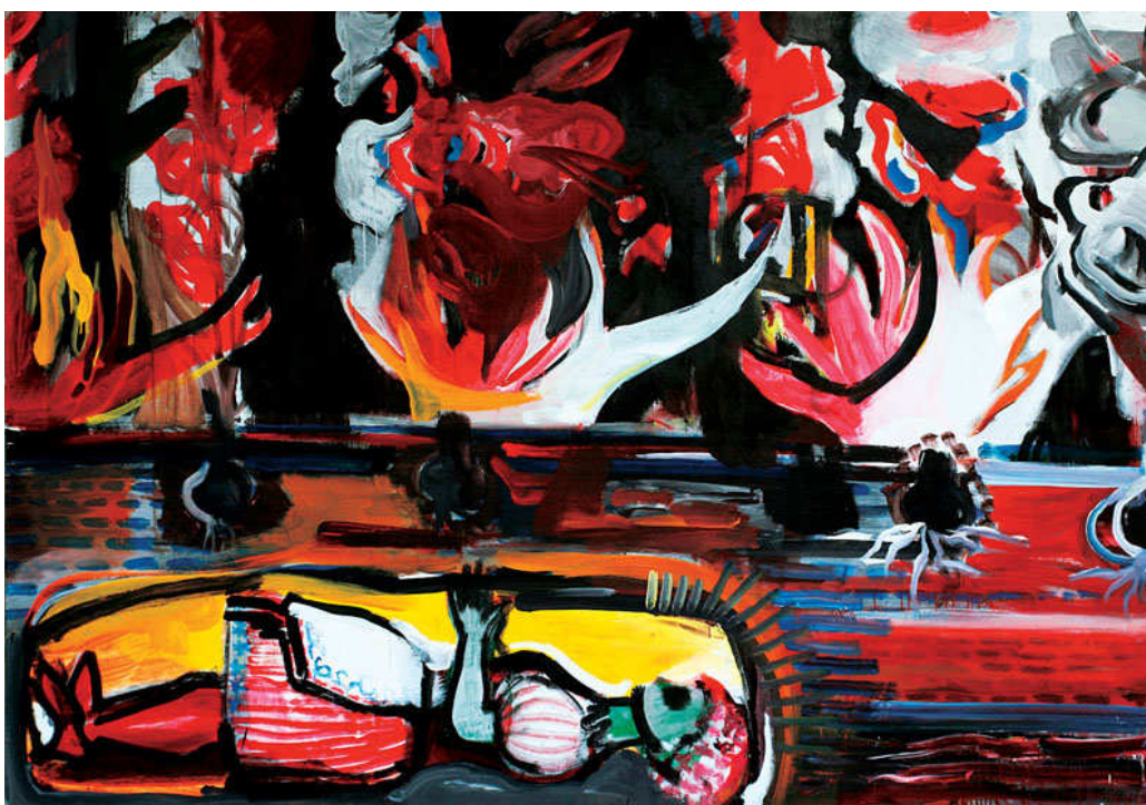
Záhon - mečíky, 2008, 200 x 290 cm, kombinovaná technika