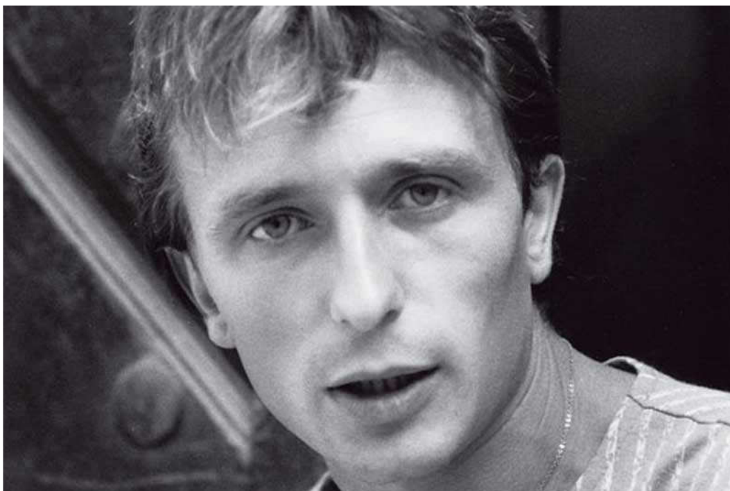
Vladimír Franz v roce 1987