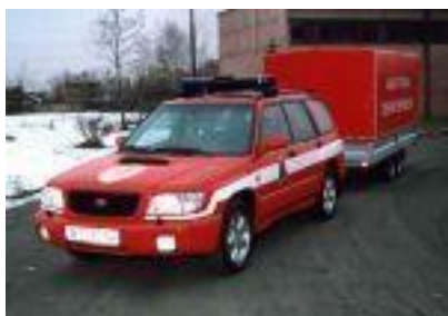
Obr. č. 1 Vůz Subaru s kontejnerem

Vůz Subaru - je určen pro všechny druhy odřadů. Lze připojit vlek s kontejnery. V případě vyslání USAR odřadu dvěma letouny AN 26 lze naložit do jednoho letounu vůz Subaru a kontejnery, do druhého letounu personál a osobní vybavení. Vůz Subaru je u HZS hl.m. Prahy.