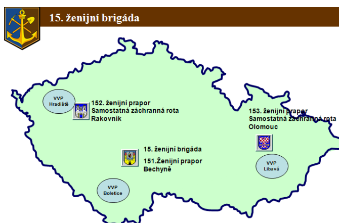
Obr. 3 Působnost ženijních praporů a samostatných záchranných rot

Zdroj: AČR - Rozmístění ženijních praporů a jejich regionální působnost