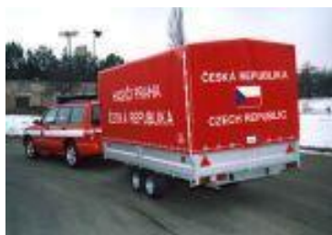
Obr. č 2 Kontejner

Speciální kontejnery - jsou určeny pro leteckou přepravu a přepravu na vleku za vozem Subaru. HZS hl .m. Prahy je vybaven dvaceti těmito kontejnery.