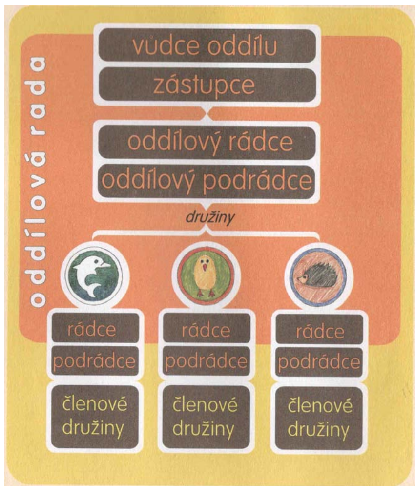
Obr. 2 - Schéma hierarchie českého oddílu 188