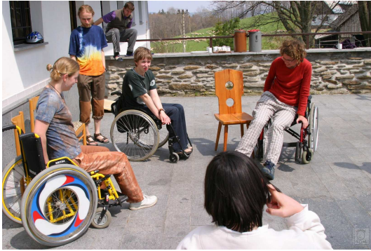
Obr. 8: Autoškola