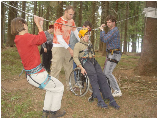
Obr. 16: Nízká lana