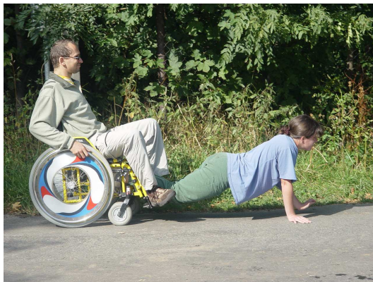
Obr. 3: Trakař