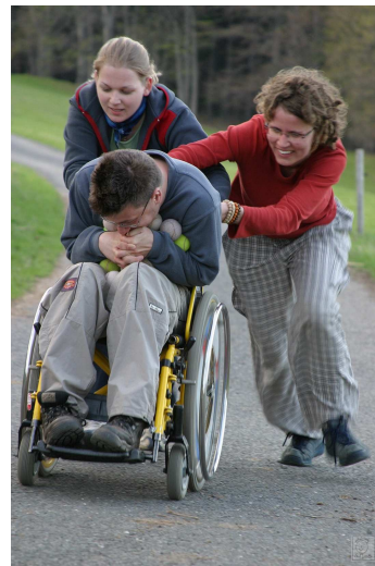
Obr. 11: Kolonie