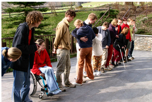
Obr. 4: AB line