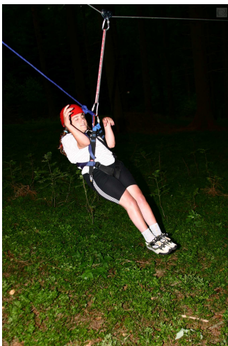
Obr. 18: Nízká lana