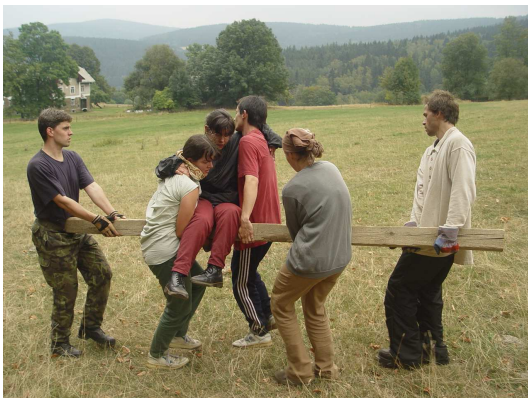
Obr. 12: Oko za oko