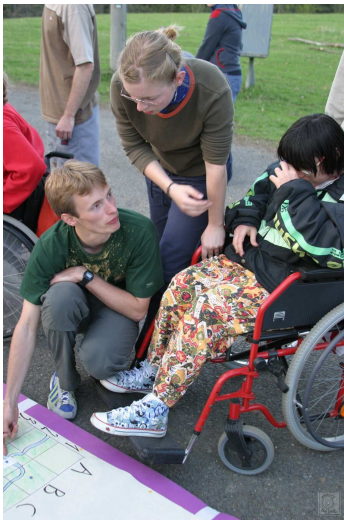
Obr. 10: Kolonie