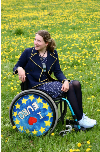
Obr. 14: Vlakové divadlo