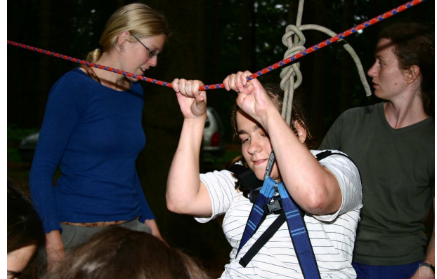
Obr. 17: Nízká lana