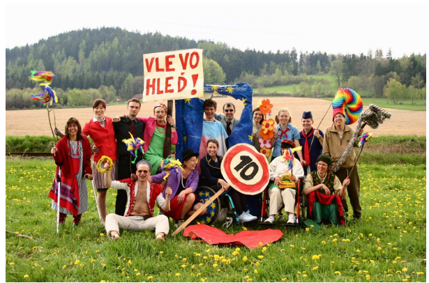
Obr. 15: Vlakové divadlo