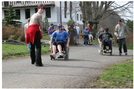
Obr. 9: Autoškola