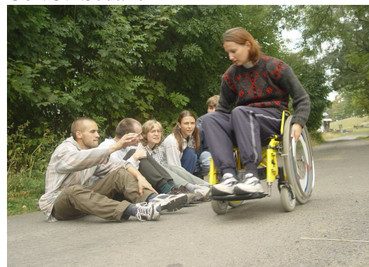
Obr. 5: Sedánek