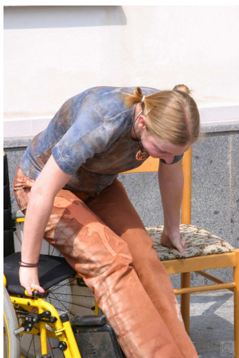
Obr. 6: Autoškola