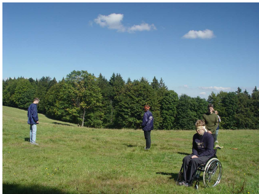
Obr. 2: Ovčák a ovce