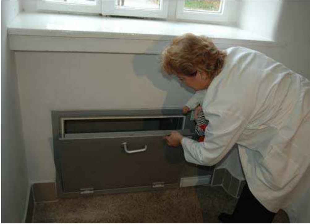
Babybox – Olomouc