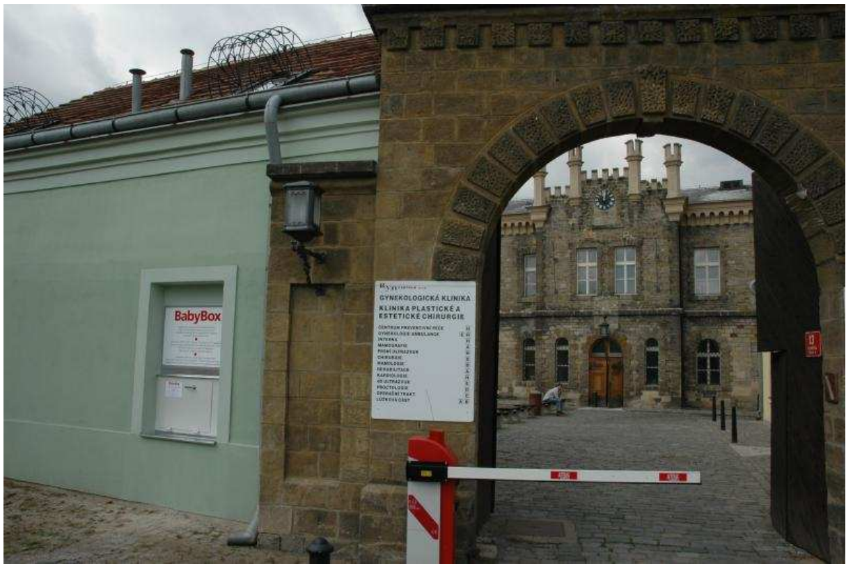
Babybox – Brno