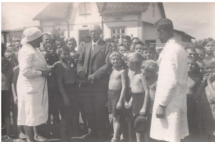
Obr. 10 Lékař při prohlídce dětí.