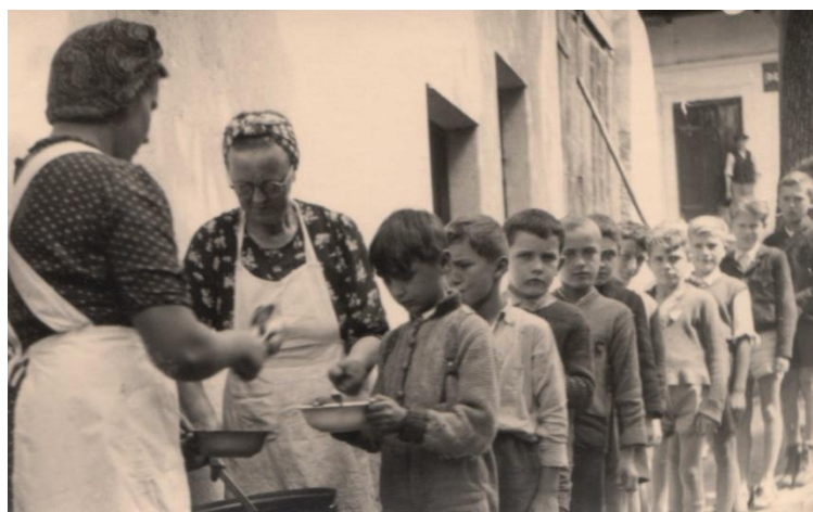
Obr. 17 Výdej stravy.