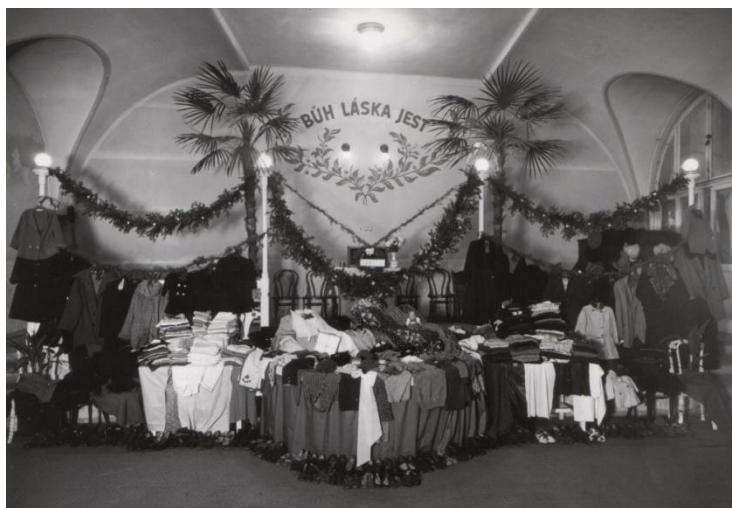
Obr. 8 Tabita v Praze.