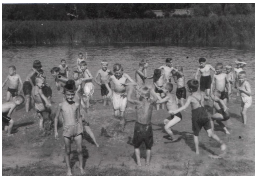
Obr. 18 Koupání a skotačení dětí.