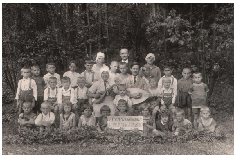
Obr. 11 Děti s pečovateli v ozdravně (1930).