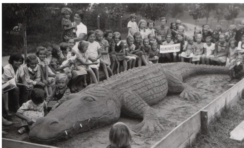
Obr. 15 Na pískovišti.