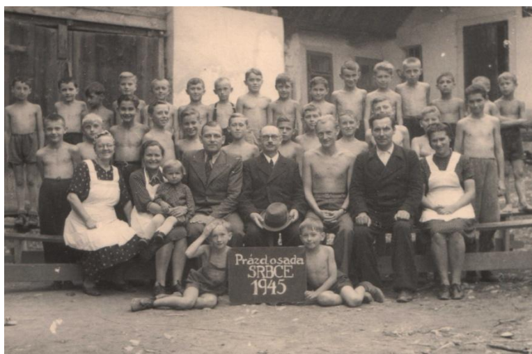
Obr. 16 Letní pobyt v prázdninové osadě Srbce.