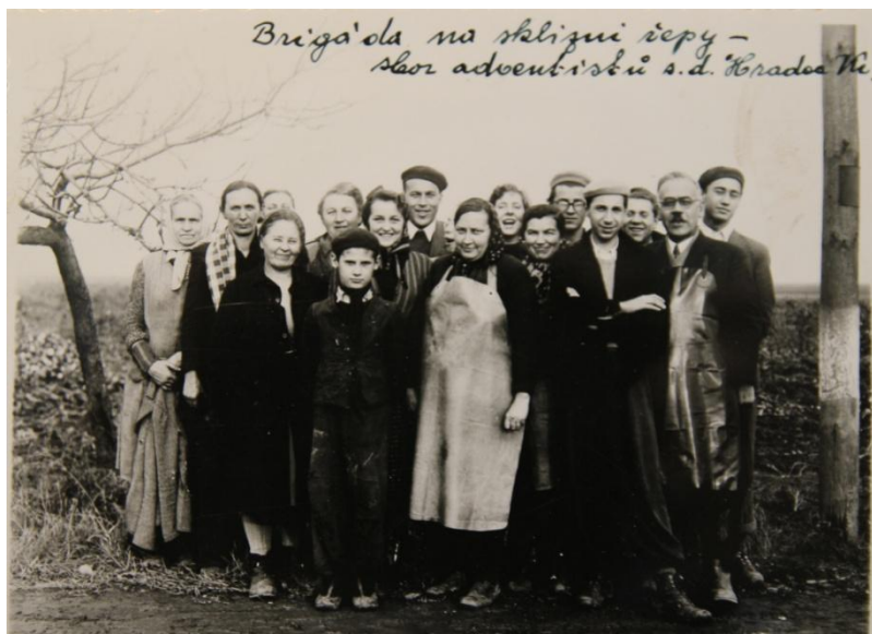
Obr. 20 Brigáda sboru adventistů z Hradce Králové (1950).