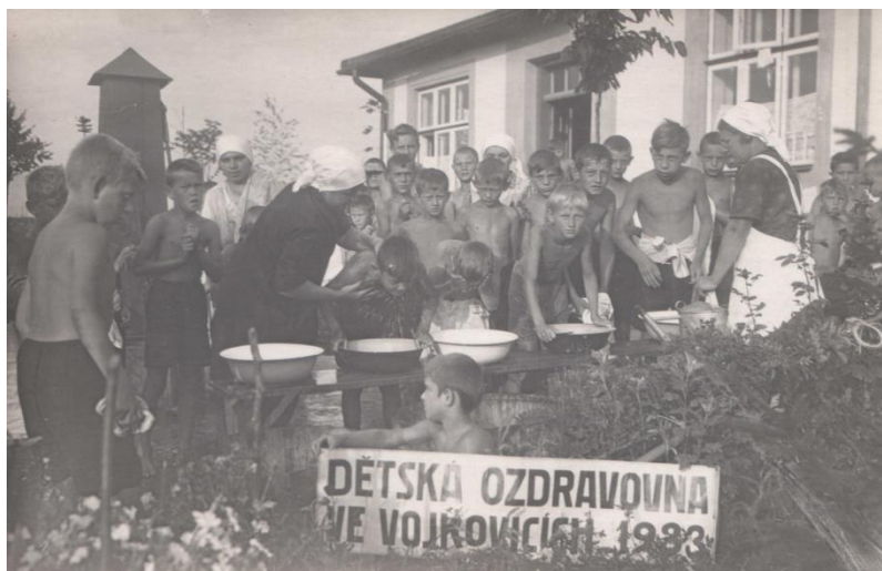
Obr. 13 Ranní hygiena.