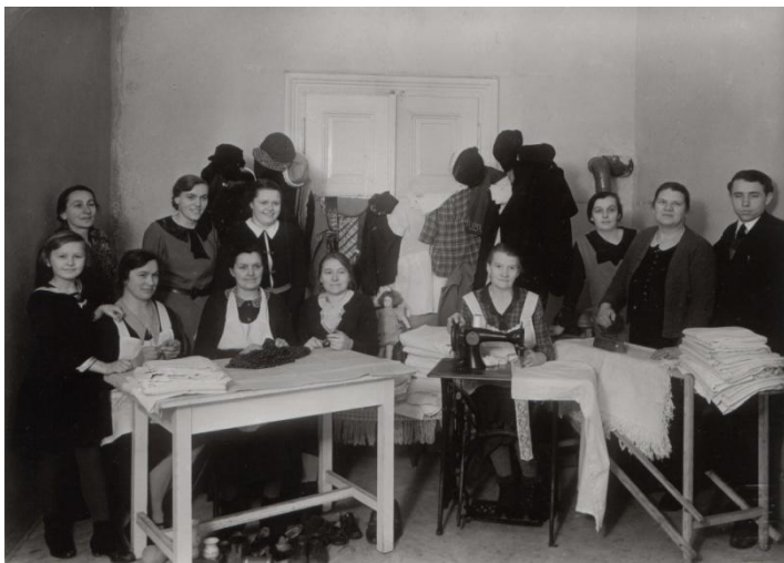
Obr. 7 Členové pražských sborů při práci v Tabitě.