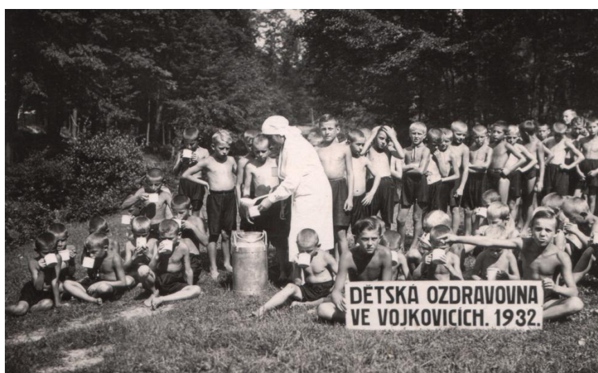
Obr. 12 Léto 1932 ve vojkovické ozdravně.