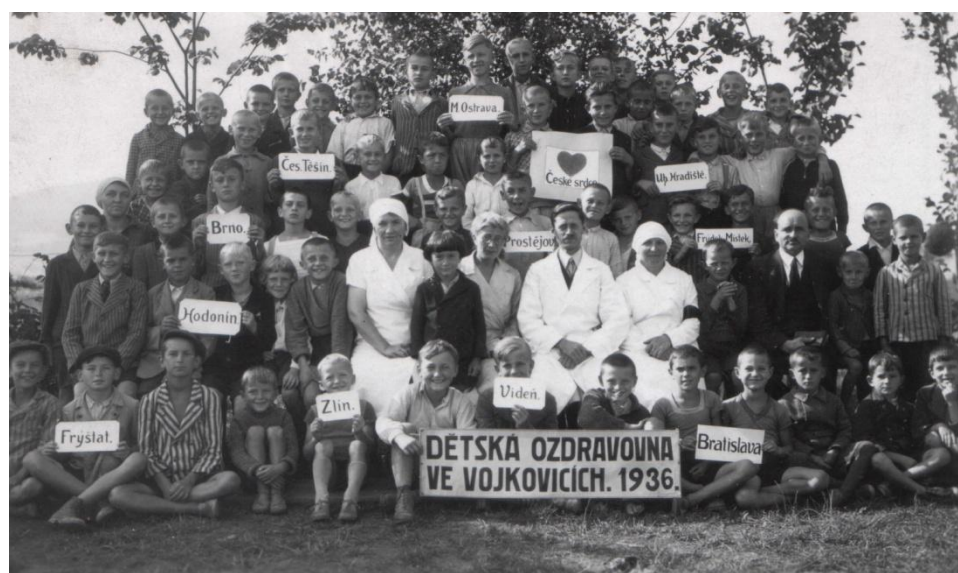
Obr. 14 Léto 1936. Děti a města odkud na pobyt přicestovaly.