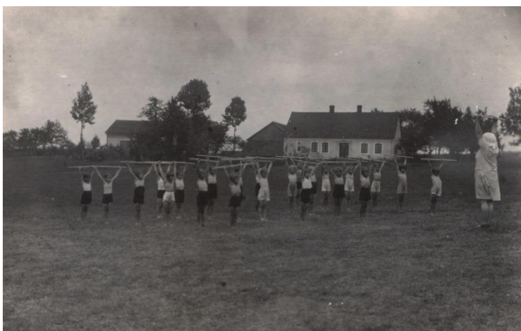
Obr. 9 Děti ve vojkovické ozdravně.