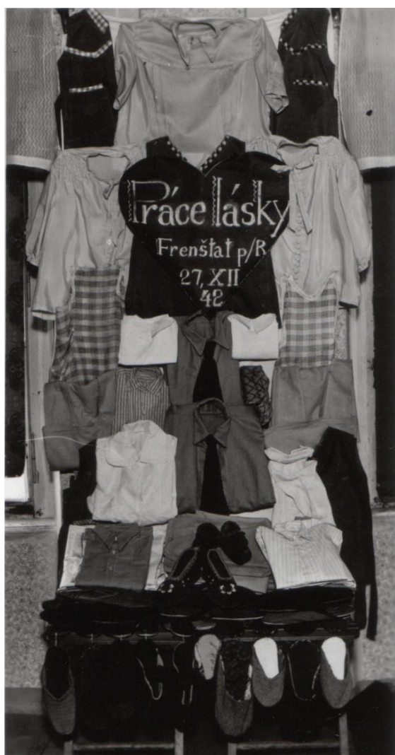
Obr. 5 Tabita ve Frenštátě pod Radhoštěm (1942).