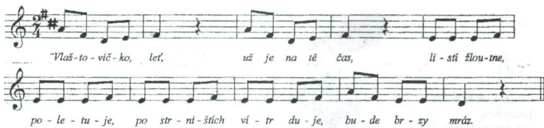
Obrázek 1: Vlaštovičko leť – Věneček Podzim, str. 4