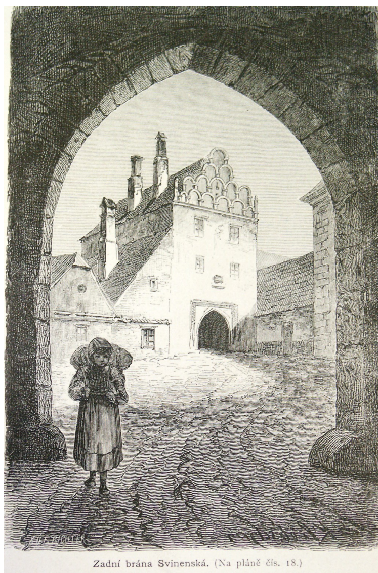
Zadní brána Svinenská. (Na pláně čís. 18.)

Město Třeboň na konci 19. století – Trhosvinenská brána.