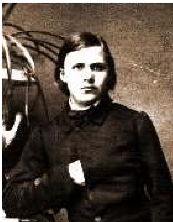
Fridrich Nietzsche v roce 1861