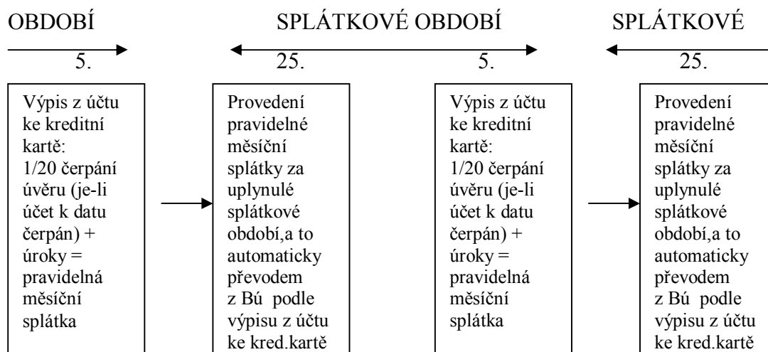
Obrázek 1 – Splátkové období

O splacenou část úvěrového rámce se automaticky zvyšuje částka, kterou může klient znovu čerpat – čím více splácí, tím více může opět čerpat. Kreditní úroková sazba je 0,40.