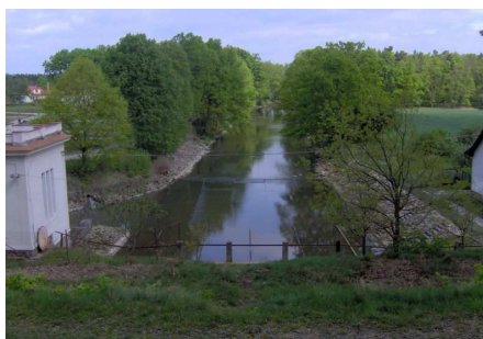
Řeka Lužnice z hráze rybníka Rožmberka

Neméně známým přítokem řeky Lužnice je řeka Nežárka , která ústí do Lužnice ve Veselí nad Lužnicí. Za zmínku stojí i říčky Dračice a Hostice (Kostěnický potok), které se také do Lužnice vlévají.