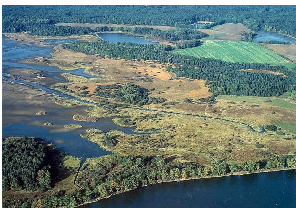
Výtopa rybníka Rožmberka

Každému, kdo tento kraj navštíví, se naskytne pohled na velké množství rybníků, vzácných rašelinišť, šumivých lesů, toků řek, ale i lidských obydlí, která s krajinou plně harmonizují. Je skutečný zážitek, procházet se touto poklidnou krajinou, kde člověku vůbec nic nechybí. Jakoby se zde člověk podřídil krajině a respektoval ji. Nejen pro nic za nic se Třeboňsko stalo inspirací pro velké množství umělců, ať už z řad kreslířů, malířů, spisovatelů či jiných významných osobností.