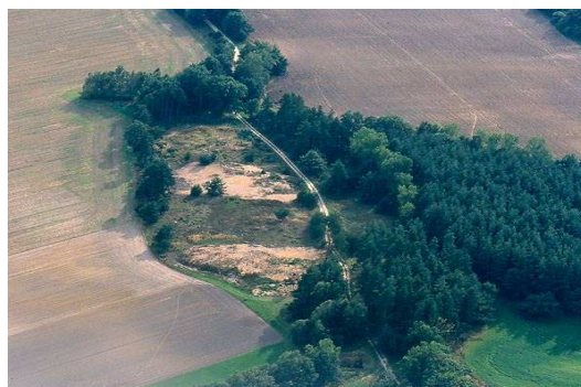
Slepičí vršek (letecký snímek)