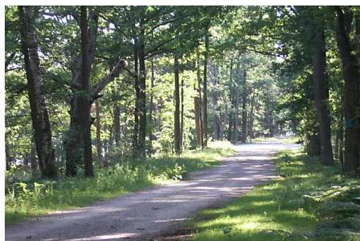
Hráz rybníka Rožmberka