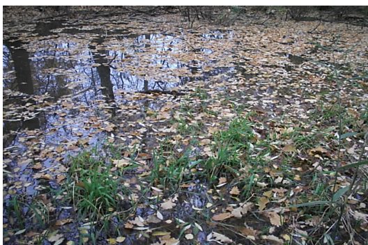
Niva řeky Lužnice