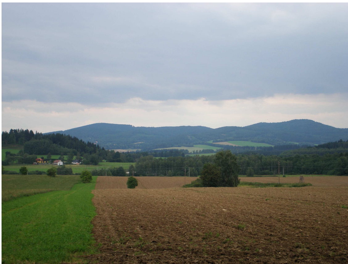
Obr. č. 2. : Zvlněná krajina mezi obcemi Benešov nad Černou a Malonty, kterou ve větším množství po druhé světové válce osídlili rumunští Slováci. (v pozadí masív Soběnovské vrchoviny)