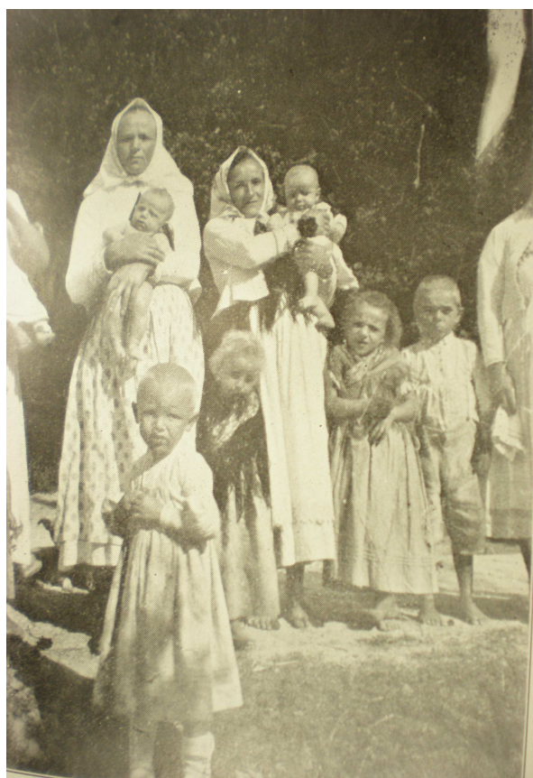
Obr. č. 4.: Slovenské ženy se svými dětmi v rumunském Rudohoří, (převzato, Rudolf Urban, c.d., Bukurešť 1930.)