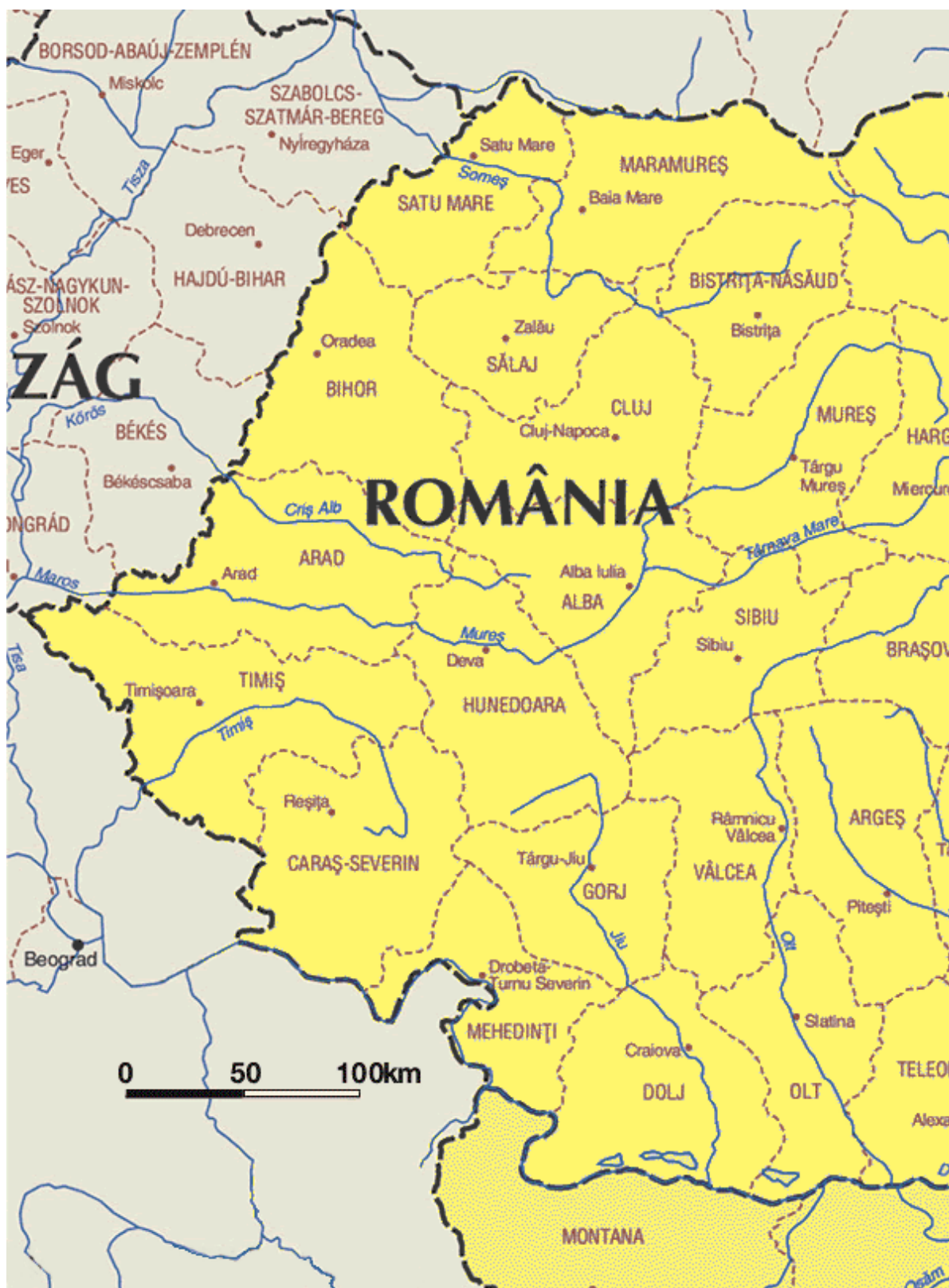
Obr. č. 9.: Správní dělení západní části Rumunska odkud, ze žup Arad, Bihor, Sălaj ve velké míře reemigrovali rumunští Slováci do pohraničních oblastí Československa.

http://europa.eu/abc/maps/regions/romania/romania_w_en.htm