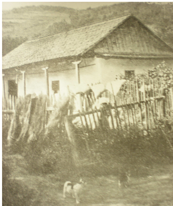
Obr. č. 3.: Typické dřevěné stavení rudohorských Slováků (převzato z publikace Rudolf Urban, Čechoslováci v Rumunsku, Bukurešť 1930.)