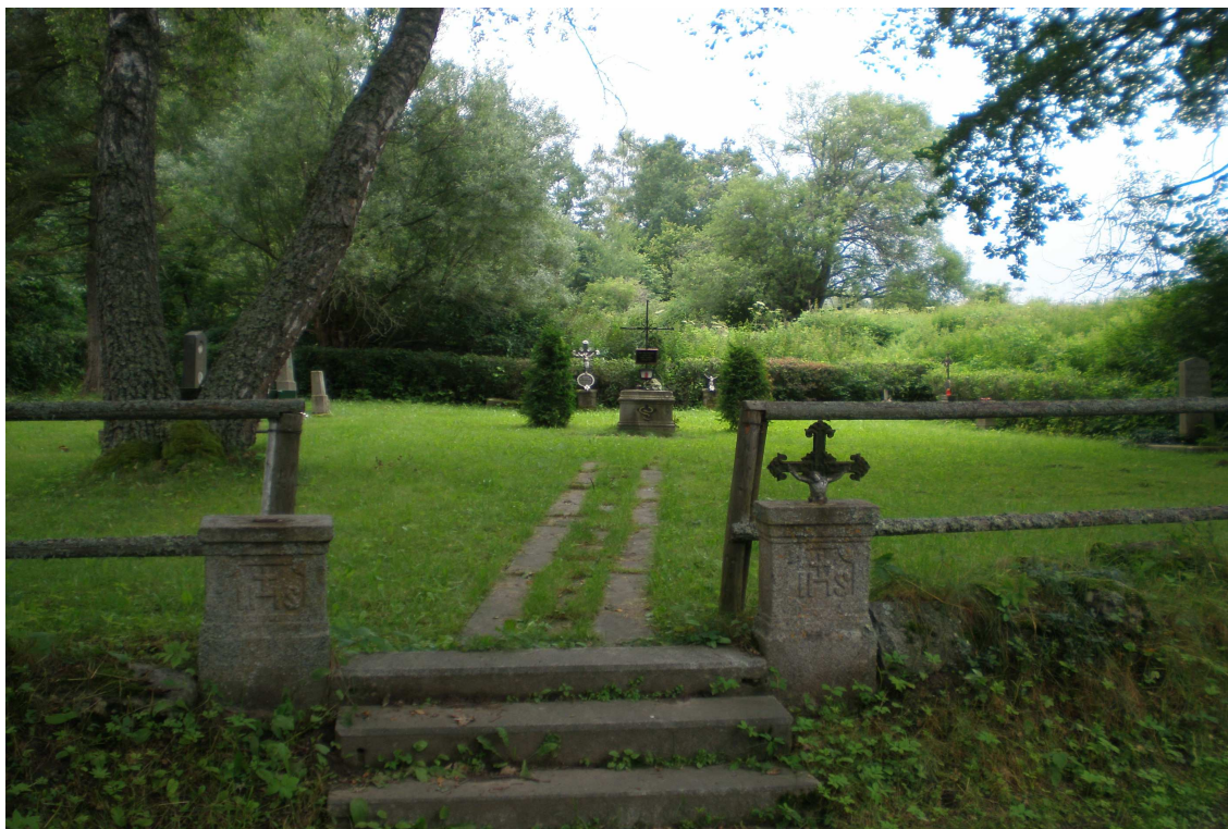
Obr. č. 1. : Bývalý německý hřbitov v dnes již zaniklé obci Cetviny