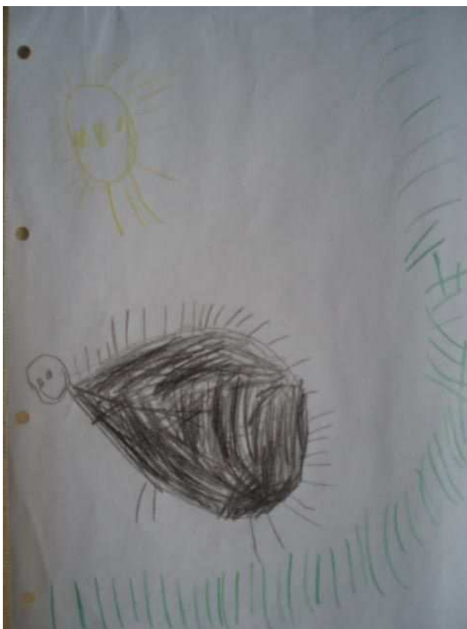
Öbr. 7 Dikobraz v trávě

obrázku, ale po otočení papíru Tonička zvolila za základnu pravou stranu. Užívala si kreslení opakujících se čar.