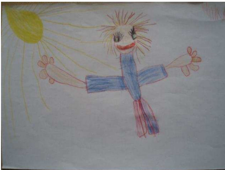
Obr. 23 Maminka

Obr.23 Maminka (12.10.2008). Maminka v oblíbeném pyžamu. Nohy byly nakresleny nejdříve jenom jako čárky, potom jim Tonička „oblekla“ pyžamové kalhoty. Zdůrazněny řasy, charakteristické zelené oči pro maminku a melír. Sluníčko má dlouhé paprsky, protože hodně hřeje. Na rukou je pět prstů.