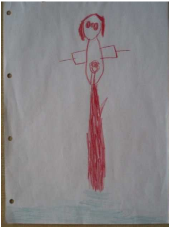
Obr. 2 Maminka

co může být červeného, že by nakreslila něco červenou pastelkou – sama vymyslí červánky. Tonička je s obrázkem spokojená. Postava už není hlavonožcem. Z trupu vycházejí končetiny, ruce, na kterých jsou znázorněny prsty (kolmo v pravém úhlu = R – princip). Hlava má detaily. I miminko v bříšku má nakresleny všechny části. Zatím u obou postav chybí krk a chodidla. Zobrazen vnitřní objem postavy.