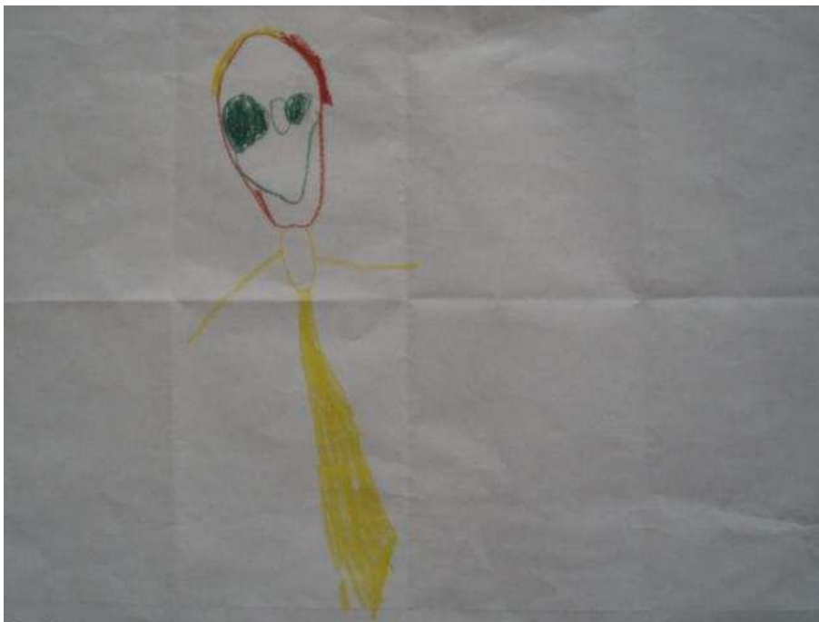
Obr. 3 Maminka

nevejde zbytek rodiny. Chybí ústa, ta má pro změnu usmívající se Stázinka. Nejsou ještě prsty.