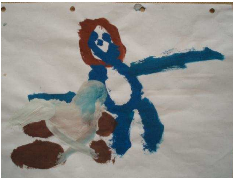
Obr. 4 Kočárek

Obr.3 Maminka (8.4.2008). Maminka v sukni. Byla „na melíru“, což je vidět v barvách na hlavě. Poznávacím znakem maminky jsou zelené oči. Má sukni.