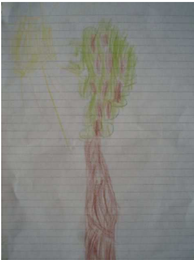
Obr. 37 Strom

Obr.37 Strom (20.2.2009). Hrajeme hru „hádej, co to je“. Kreslíme „něco z bydliště“. Tonička kreslí smrk, co mají na dvoře. Je jí líto, že nakreslila listnáč (se šiškami), protože jehličnatý neumí. Chci jí ho ukázat, naučit, ale nechce. Za pár dní ale nakreslila smrk ve školce a pochlubila se s ním. Děkala jakoby nic.