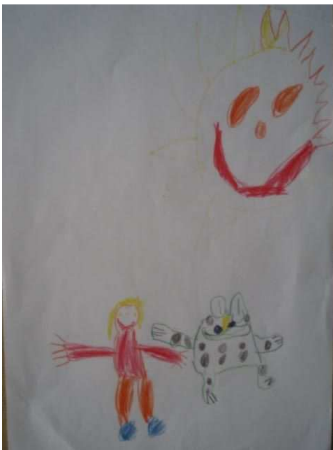
Obr. 34 Žába

Obr.33 Mikuláš (6.12.2008). Kreslí Mikuláše, podle obrázku.