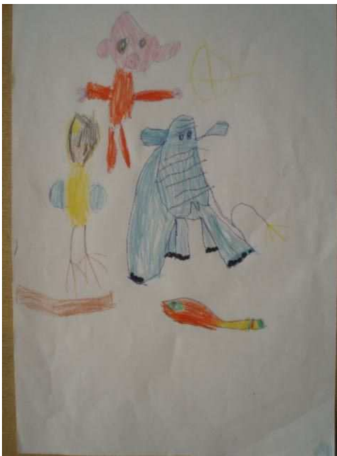
Obr. 25 ZOO

Obr.25 ZOO (25.10.2008). Nejdřív kresleno propiskou, potom vybarveno pastelkami. U slona je vidět naznačení prostoru nakreslením zadních nohou. Vykresleny poznávací znaky zvířátek. Papouška Tonička zná důkladně, přeje si ho totiž k Vánocům. Je nakreslen i s větví, na které by měl sedět.