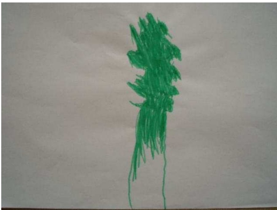
Obr. 21 Strom

Obr. 20 Švestka (18.9.2008). Sběrání trnek u babičky. První strom, co jsem u Toničky viděla, listnatý, inspirovaný sbíráním trnek. Nakreslila na něm plody, ale až dodatečně.