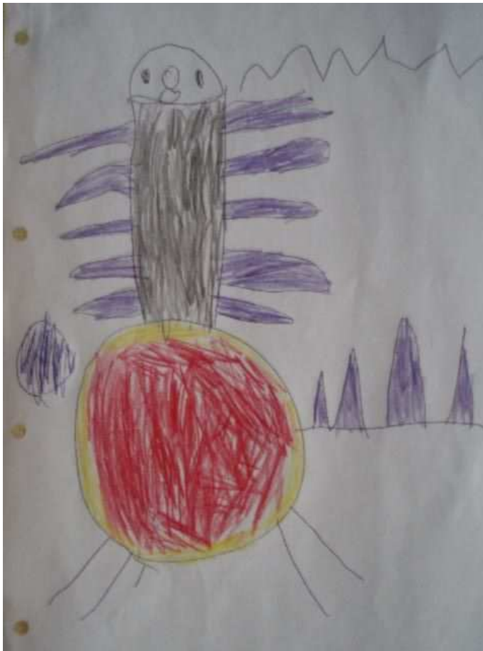
Obr. 11 Drak III