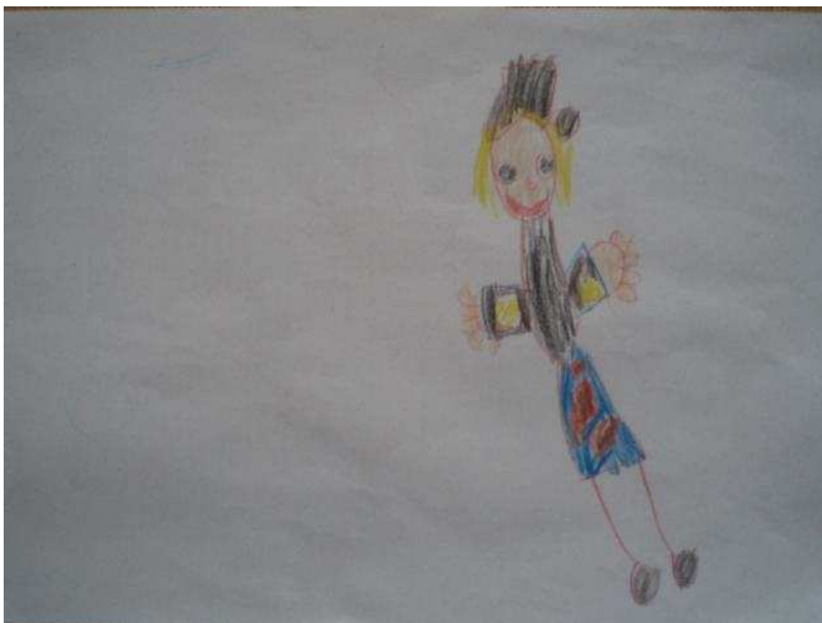
Obr. 29 Čarodějnice