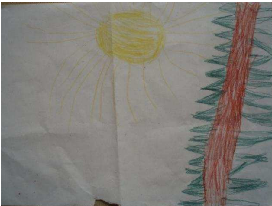
Obr. 40 Smrk

Obr.40 Smrk (3.3.2009). Nakreslila znova smrk, který dřív nakreslit neuměla, pak ho nakreslila ve školce. Větve jsou kolmé na kmen. A sluníčko.