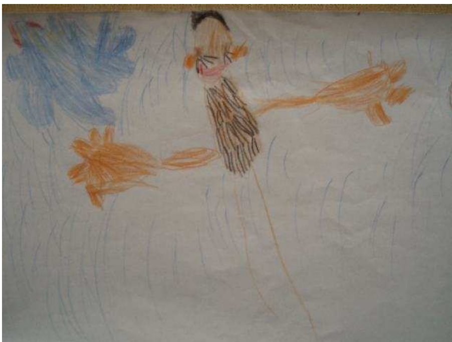
Obr. 22 Tatínek

Obr.21 Strom (18.9.2008). Potom zkoušela kreslit strom fixem. Nedokreslila, protože už se jí nechtělo. Zase listnatý.