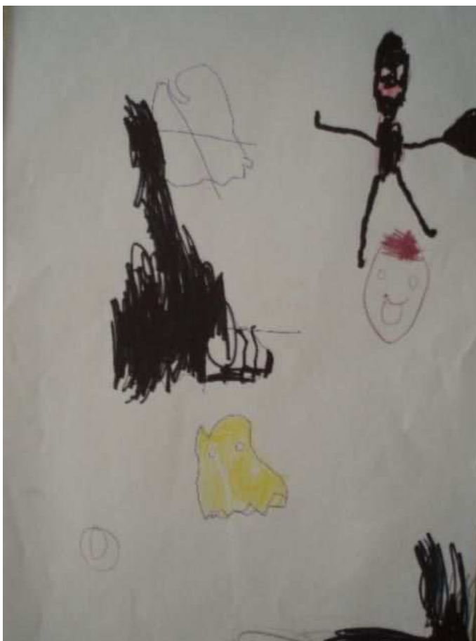
Obr. 26 Lupič

Obr.25 ZOO (25.10.2008). Nejdřív kresleno propiskou, potom vybarveno pastelkami. U slona je vidět naznačení prostoru nakreslením zadních nohou. Vykresleny poznávací znaky zvířátek. Papouška Tonička zná důkladně, přeje si ho totiž k Vánocům. Je nakreslen i s větví, na které by měl sedět.