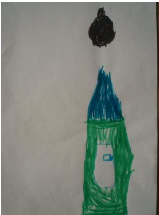
Obr. 27 Domeček

Obr.27 Domeček (25.10.2008). Zase se mu kouří z komína, ale komín chybí, je jenom nakreslen kouř. Je nakreslen detail dveří, i s klikou.