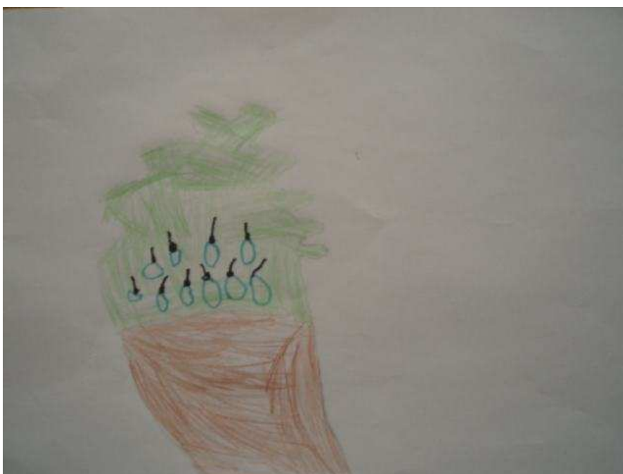
Obr. 20 Švestka

Obr. č. 19 Nádobí (1.9.2008). Tonička kreslila, co všechno mají v kuchyni. Vidlička, nůž, triangl + tyčinka, lžička. Křížkem označila, co se jí nepovedlo. Kreslila propiskou, potom některé objekty vybarvila pastelkami. Objekty rozmístěné v prostoru, ohraničené utěrkou.