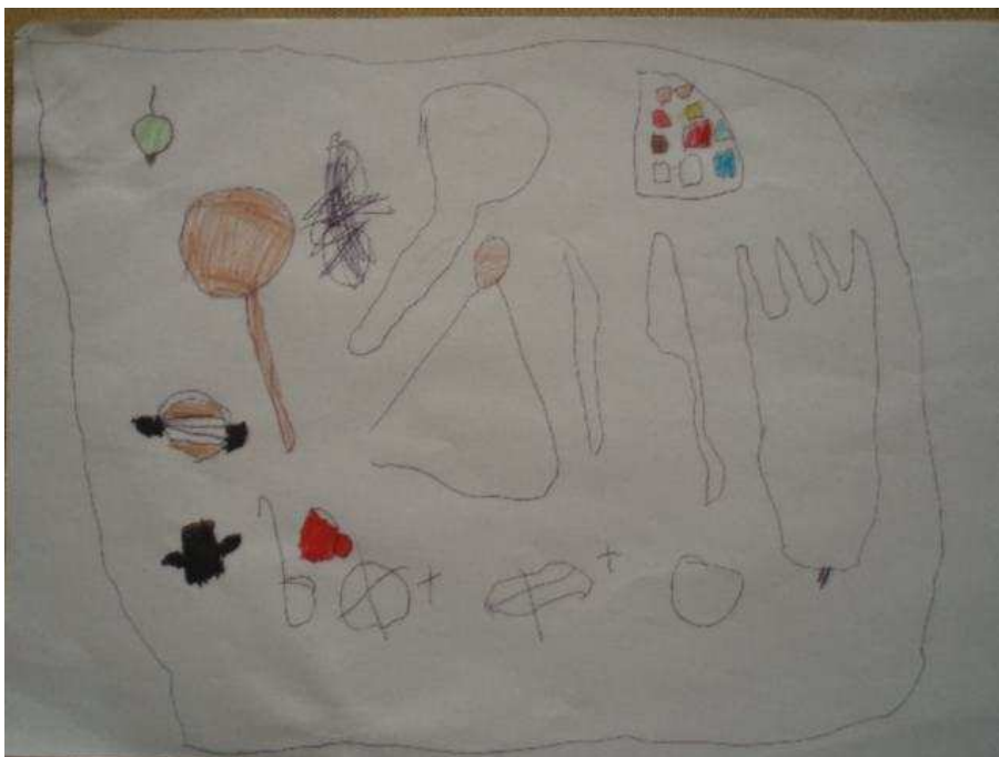
Obr. 19 Nádobí

Obr. č. 19 Nádobí (1.9.2008). Tonička kreslila, co všechno mají v kuchyni. Vidlička, nůž, triangl + tyčinka, lžička. Křížkem označila, co se jí nepovedlo. Kreslila propiskou, potom některé objekty vybarvila pastelkami. Objekty rozmístěné v prostoru, ohraničené utěrkou.