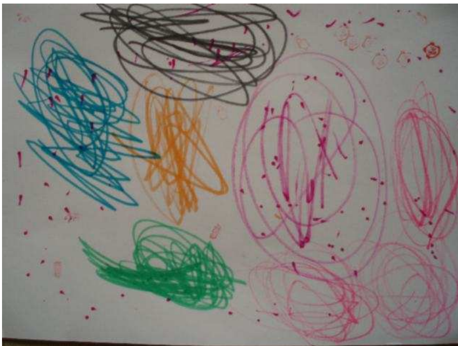
Obr. 6 Ohňostroj