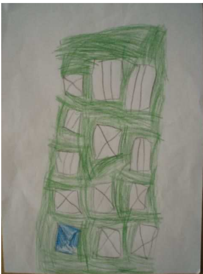
Obr. 38 Panelák

Obr.37 Strom (20.2.2009). Hrajeme hru „hádej, co to je“. Kreslíme „něco z bydliště“. Tonička kreslí smrk, co mají na dvoře. Je jí líto, že nakreslila listnáč (se šiškami), protože jehličnatý neumí. Chci jí ho ukázat, naučit, ale nechce. Za pár dní ale nakreslila smrk ve školce a pochlubila se s ním. Děkala jakoby nic.