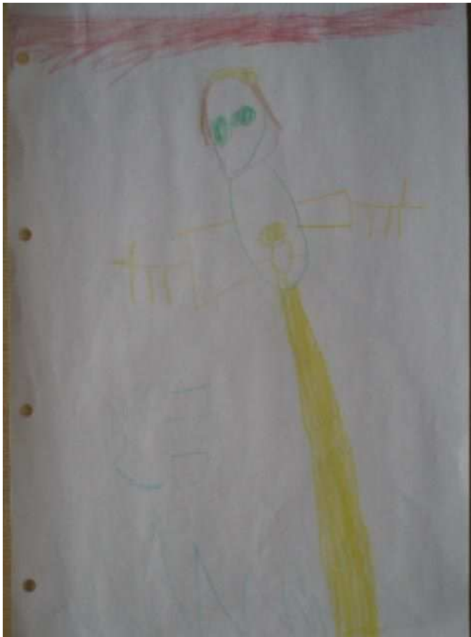
Obr. 1 Maminka