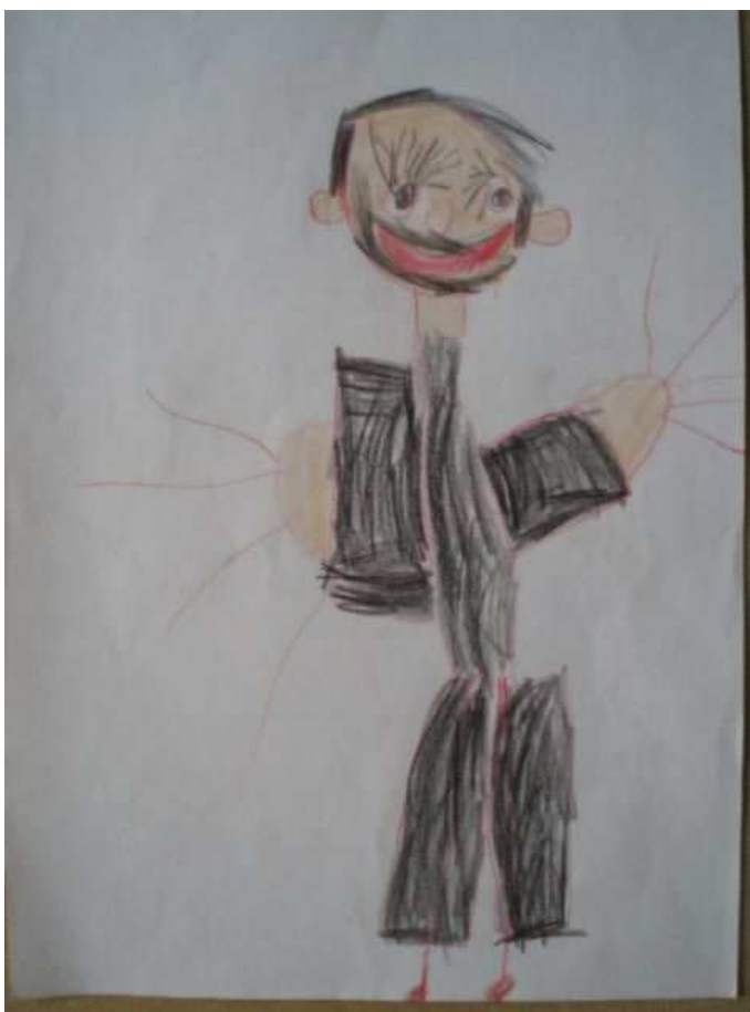
Obr. 28 Tatínek

Obr.27 Domeček (25.10.2008). Zase se mu kouří z komína, ale komín chybí, je jenom nakreslen kouř. Je nakreslen detail dveří, i s klikou.