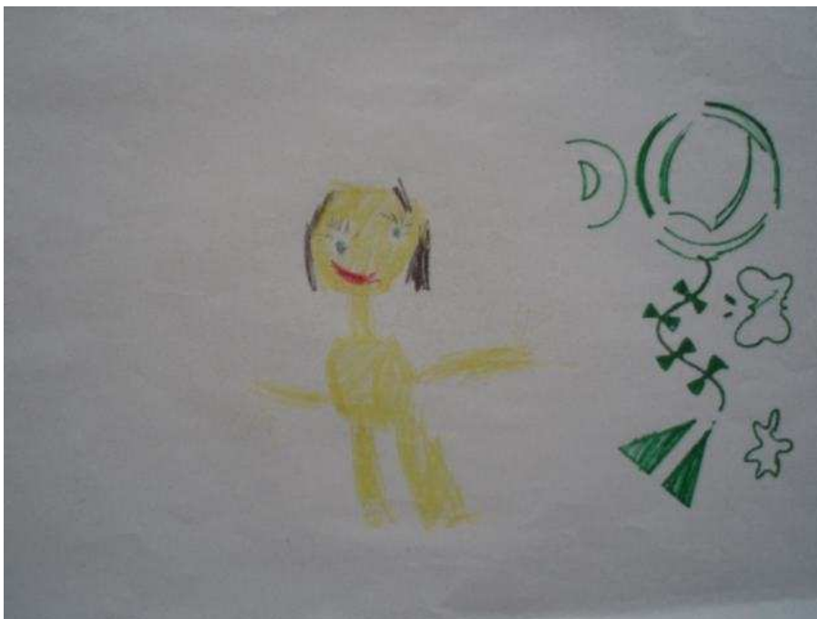
Obr. 17 Maminka

Obr.17 Maminka (1.9.2008). Tonička kreslí postavu maminky. Na papíře jsou také ornamenty, kreslené podle šablon a pravítek. Na obrázku kreslí poprvé řasy. Stěžuje si, že nemá tělovou barvu, že by ji potřebovala.