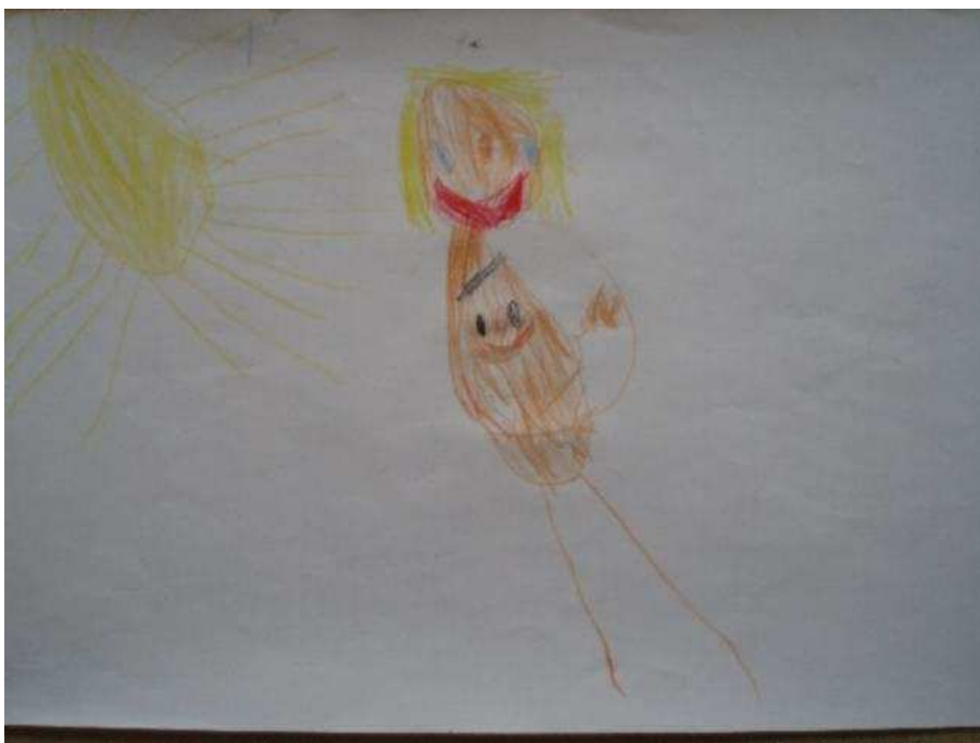
Obr. 24 Tonička se Stázinkou

Obr.23 Maminka (12.10.2008). Maminka v oblíbeném pyžamu. Nohy byly nakresleny nejdříve jenom jako čárky, potom jim Tonička „oblekla“ pyžamové kalhoty. Zdůrazněny řasy, charakteristické zelené oči pro maminku a melír. Sluníčko má dlouhé paprsky, protože hodně hřeje. Na rukou je pět prstů.