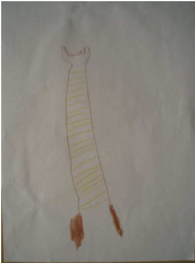
Obr. 15 Žirafa - rozhledna

Obr.15 Žirafa – rozhledna. (12.8.2008). Anička z Toniččiny školky už prý umí nakreslit krk. Tonička říká, že zkusí nakreslit žirafu, ale nepovede se jí, udělá tedy z žirafy rozhlednu. Nahoře jsou lidi, dole je podstavec. Krajinu kolem žádnou kreslit nechtěla. Obrátila papír z druhé strany a zkoušela nakreslit postavičku s krkem. Zjišťuje, že to není tak lehké.