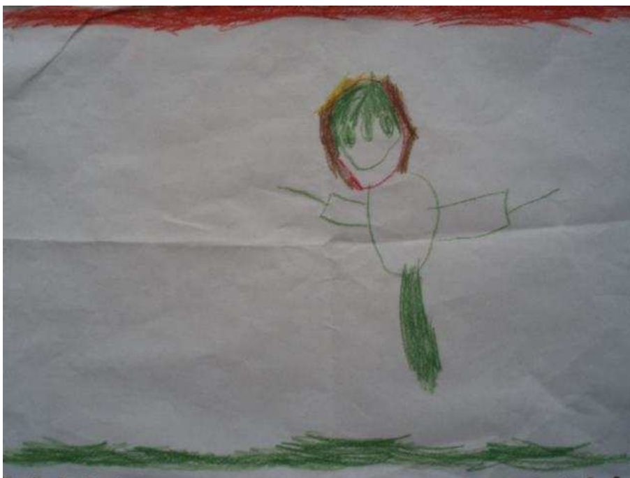
Obr. 5 Maminka v trávě

Obr.4 Kočárek (8.4.2008). Tonička obrázek namalovala barvami po příchodu z mateřské školy. Ptala jsem se jí, čím by chtěla být, odpověděla „maminkou dětí“, na otázku „proč?“, odpověděla, že by je mohla ochraňovat. Na obr.namalovala sebe s bílým kočárkem na 4 kolech. Kočárek má před sebou, myslím, že jde o naznačení prostoru, postava se s kočárkem překrývá. Chtěla namalovat, že ho drží. Obrázek je velmi zdařilý.