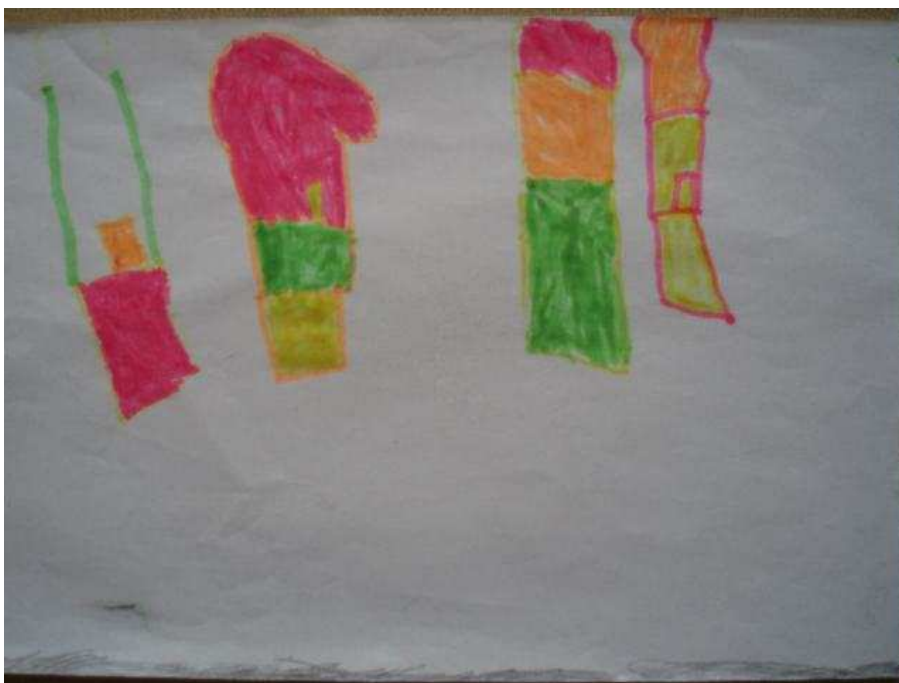
Obr. 14 Létající balony

Obr.14 Létající balony (5.8.2008). Viděla je v televizi, v pořadu Matýsek. Nejdříve nakreslila tužkou zem, základní čáru a balóny pak umístila u horního okraje, aby naznačila, že se vznášejí.