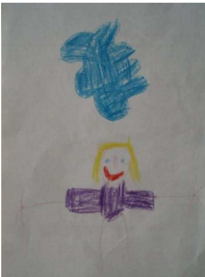
Obr. 36 Tonička

Obr.36 Tonička (12.1.2009). Nakreslila sebe. Oblohu nenaznačuje čára, ale mrak.