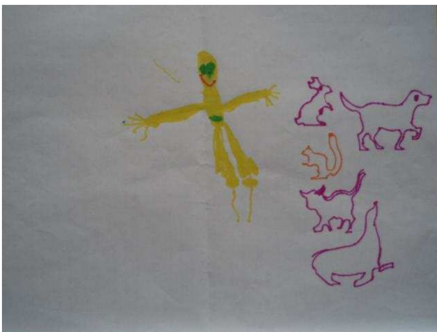
Obr. 18 Maminka

Obr.17 Maminka (1.9.2008). Tonička kreslí postavu maminky. Na papíře jsou také ornamenty, kreslené podle šablon a pravítek. Na obrázku kreslí poprvé řasy. Stěžuje si, že nemá tělovou barvu, že by ji potřebovala.