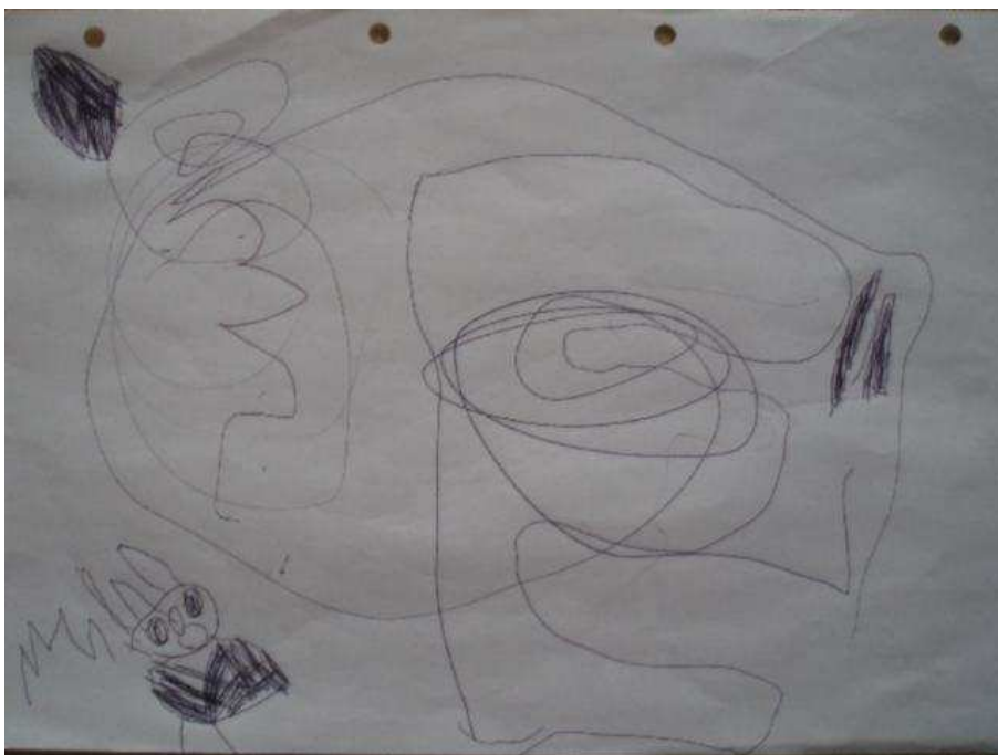
Obr. 9 Drak I

Následuje skupina tří obrázků č. 9, 10, 11. Drak. (16.6.2008). Tonička dostala k svátku propisku. Zkoušela s ní kreslit. Nejdřív nakreslila „plánek“ = čáranice uprostřed prvního