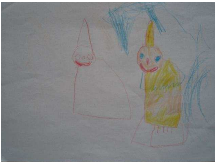
Obr. 33 Mikuláš

Obr.33 Mikuláš (6.12.2008). Kreslí Mikuláše, podle obrázku.