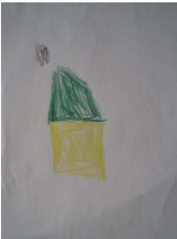
Obr. 16 Domeček

Obr.15 Žirafa – rozhledna. (12.8.2008). Anička z Toniččiny školky už prý umí nakreslit krk. Tonička říká, že zkusí nakreslit žirafu, ale nepovede se jí, udělá tedy z žirafy rozhlednu. Nahoře jsou lidi, dole je podstavec. Krajinu kolem žádnou kreslit nechtěla. Obrátila papír z druhé strany a zkoušela nakreslit postavičku s krkem. Zjišťuje, že to není tak lehké.