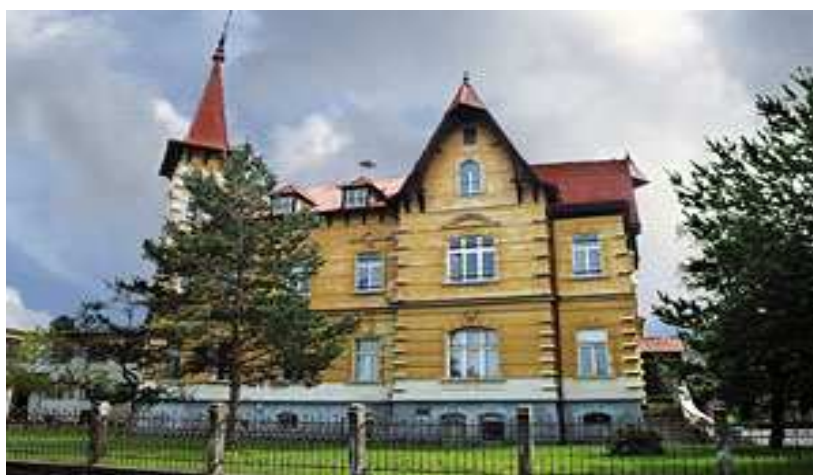
Výchovné zařízení Boletice nad Labem

Nezletilý vrah, který brutálně zabil třináctiletou Barboru z Kmetiněvsi u Kladna, a jeden z pětice chlapců, kteří nůžkami ubodali důchodkyni z Olešnice na Rychnovsku. To byli první dva klienti speciálního zařízení pro nebezpečné dětské delikventy, které Ministerstvo školství otevřelo v již existujícím výchovném ústavu v děčínské městské části Boletice. 26