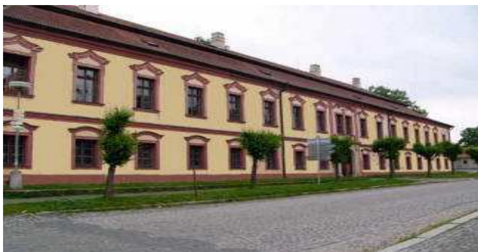
Dětský domov se školou Načeradec

Veteráni kruté války, kteří na vlastní kůži poznali utrpení a krutost válečného období, při němž strádaly zejména děti, které ztratily v tomto konfliktu rodiče, zde zřídili dětský domov. Náklady na provoz byly hrazeny dobročinnými sbírkami a ze státní dotace. Ve skromných ubytovacích prostorech, ale s velkým úsilím pro spravedlivou věc byly po generace v těchto objektech umisťovány a vychovávány děti, které neměly vlastní rodinu. Tomuto účelu sloužil ústav s určitými proměnami závislými na společenské a politické situaci do roku 1958, kdy se domov stává zařízením pro děti a mládež s poruchami chování. V současné době je zde umístěn dětský domov se školou.