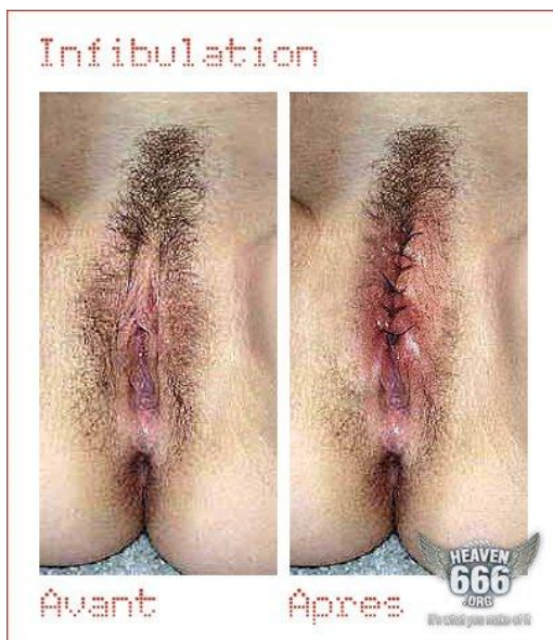
Obr. 2 108