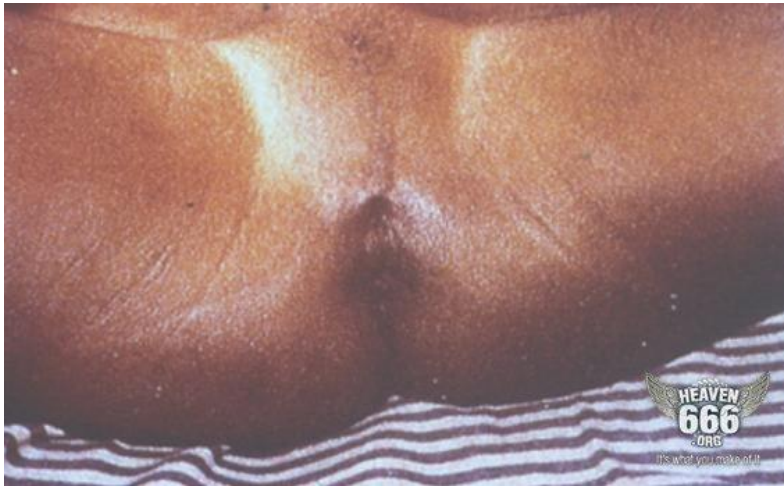
Obr. 1 107