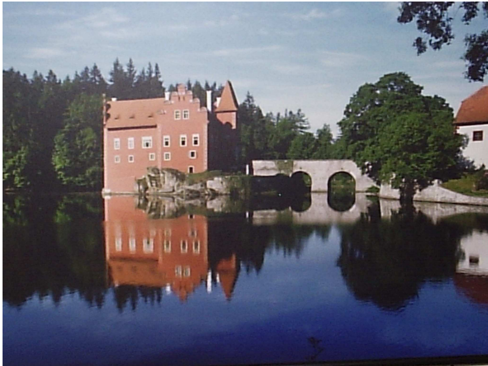
1) Červená Lhota – pohled od zámeckého parku