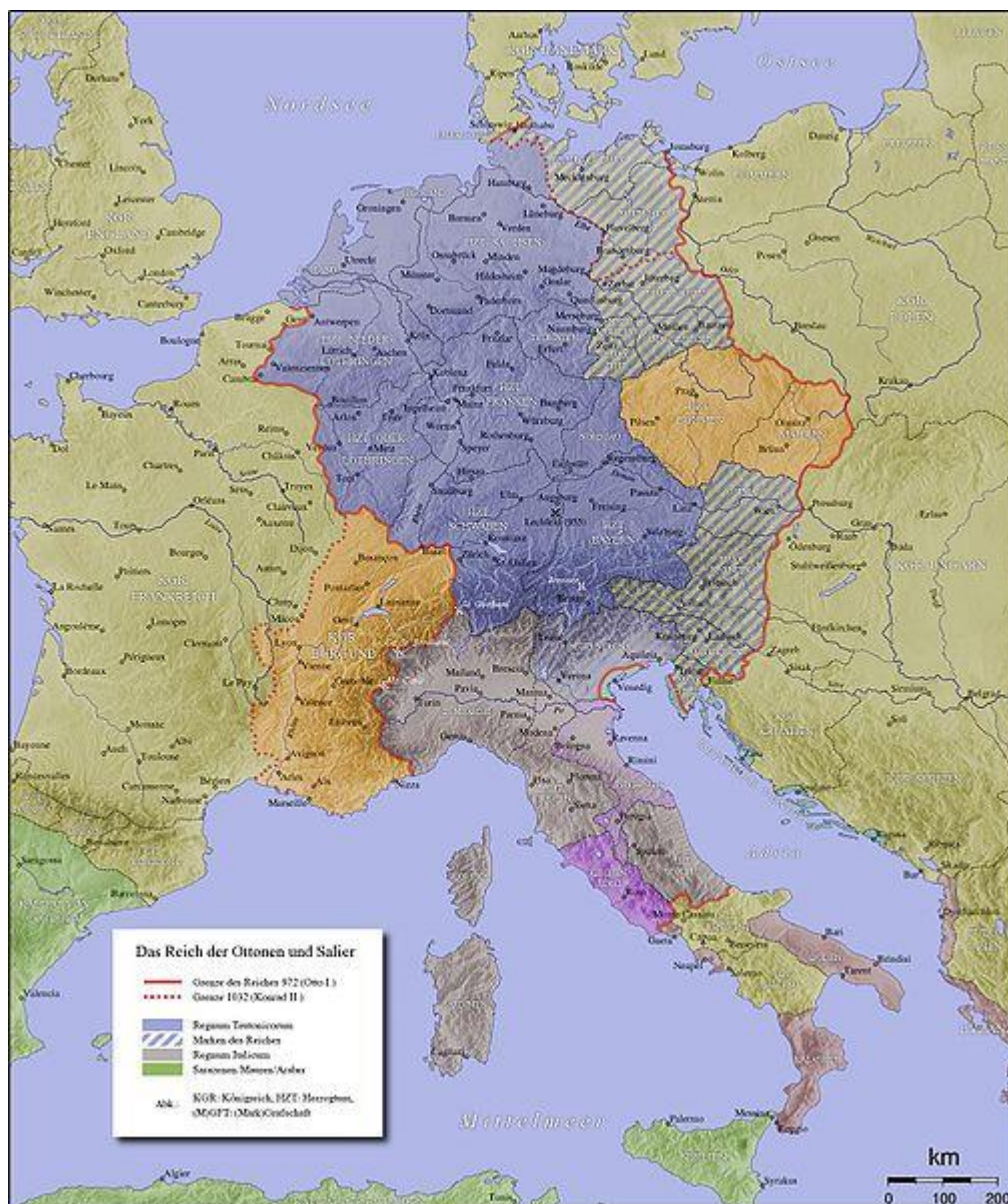
Obrázek č. 5: Mapa svaté říše římské kolem r. 1000 26