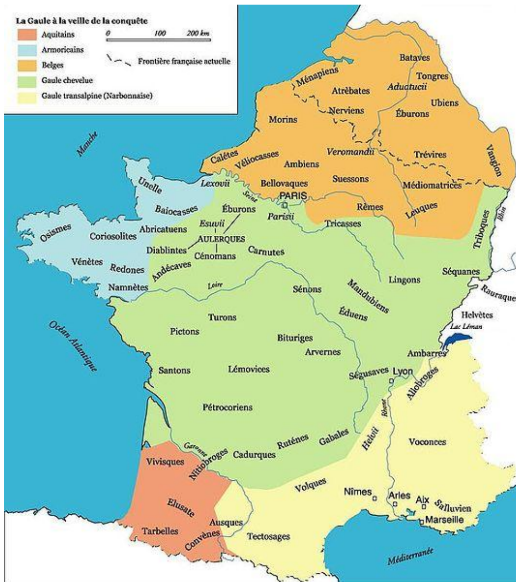
Obrázek č. 1 : Mapa keltských kmenů v předvečer dobytí Galie Římany 4

Stejně jako většina střední Evropy i území Lucemburska bylo původně osídleno keltskými kmeny. Na území dnešního Lucemburska, v jihovýchodní Belgii a v jihozápadní části Německa se jednalo konkrétně o kmen Treverů. Jejich hlavní oppidum Titelberg (lucembursky Tételberg) ležící na kopci nad řekou Chiers (lucembursky Kuer, německy Korn), je dnes největším archeologickým nalezištěm na lucemburském území. Památky zde nalezené pocházejí přibližně z 5. století př. Kr.