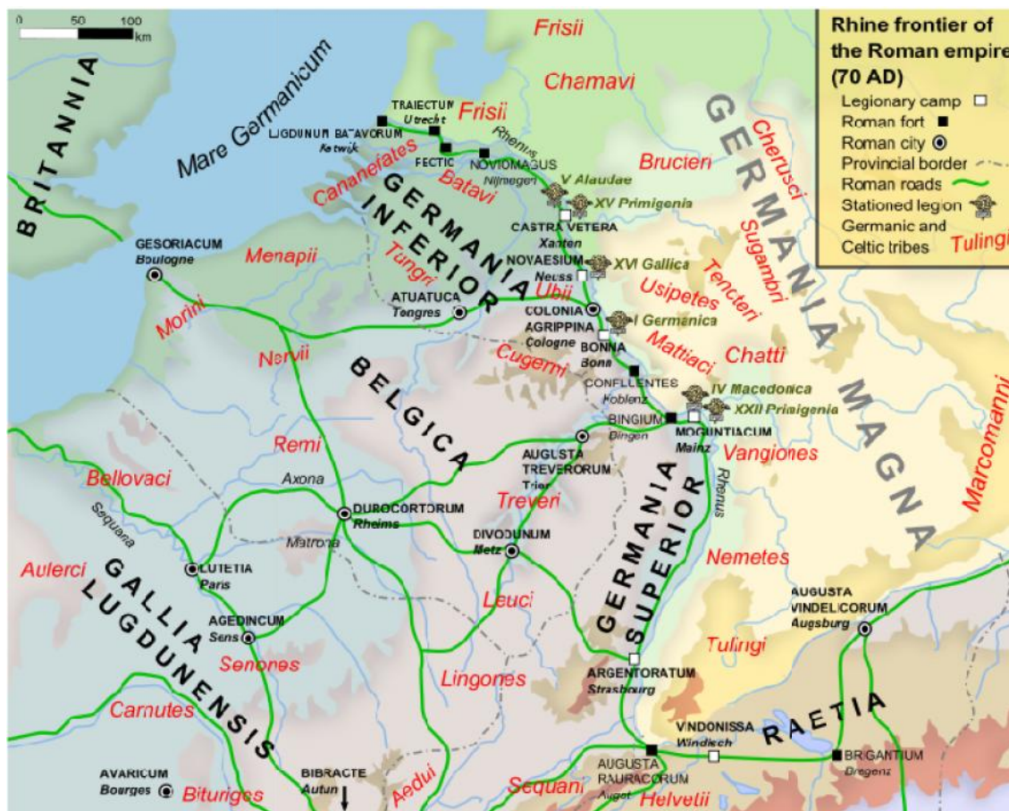
Obrázek č. 3: Hranice římské říše a germánského území kolem roku 70 9