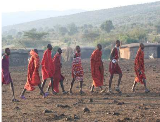
Obr.13. Masajové v tradičním oděvu.

Víte, že... Masajové jsou původním východoafrickým kmenem, který žije podél keňsko - tanzanské hranice. Celkem je jich asi 100 000. Masajové jsou pastevci, kteří svá stáda pasou pod Kilimandžárem již 300 let. Základem jejich výživy je kravské mléko. Dobytek má pro Masaje obrovskou cenu. Nikdy nemají stálý domov, každé 3 - 4 roky, když jsou okolní pastviny spasené, odstěhuje se kmen o kus dál.