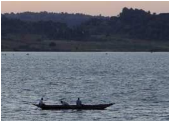
Obr.2. Viktoriino jezero.

Víte, že... Viktoriino jezero (Ukerewe) je po Kaspickém moři a Hořejším jezeru třetím největším jezerem světa. Je jednou z hlavních zdrojnic Nilu (Bílý Nil). Jezero roku 1855 objevil britský cestovatel Livingstone a pojmenoval ho Viktoriino jezero.