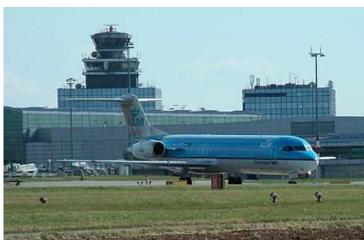
Obr.20. Mezinárodní letiště v Kampale.

Doprava je rozvinuta jen velice málo. Komunikace jsou vybudovány jen místně a nepokrývají celé území. Silnice jsou vybudovány jen mezi velkými městy, ale kvalita neodpovídá potřebám. Železnice některé země vůbec nemají. Lodní doprava se provozuje na velkých východoafrických jezerech. Rozvinutá je i námořní doprava. Mezinárodní letišťe má každé hlavní město.