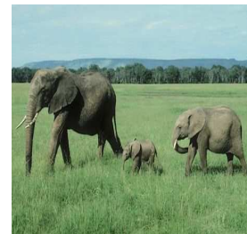
Obr.9. Slon africký.