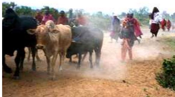
Obr.16.Masajové ženoucí stádo krav.

Víte, že... Početná stáda masajských krav spasou všechnu trávu, kopyty rozdrťí kořínky a rozmělní okolní půdu na prach. V krajině po nich pak zůstanou pouze akácie a keře s dlouhými a nebezpečnými trny. Početná stáda krav patří k největším ničitelům krajiny.