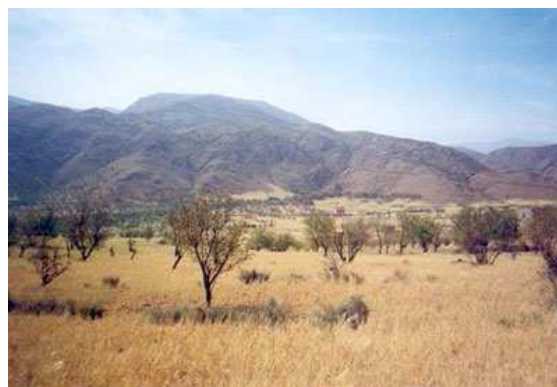
Obr.5. Pohled na typickou oblast savany.

Savany jsou travnaté porosty s roztroušenými lesíky a jednotlivými stromy (akácie, baobaby..). Pásmo savan je bohatě zastoupeno živočišnými druhy jako jsou zebry, žirafy, lev, antilopy, sloni, nosorožci, levharti, hroši, buvoli, aj.