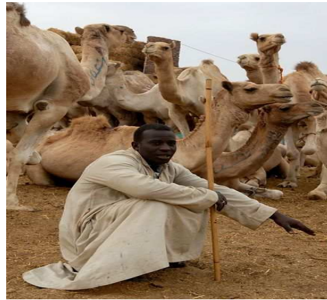
Obr.18. Somálský muž se svým stádem velbloudů.