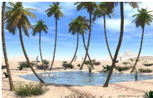
Obr.10. Pouštní oáza.

V pásmu pouští a polopouští rostliny rostou jen velice řídce, jsou přizpůsobeny jen malému množství vody - sukulenty. V místech, kde se k povrchu dostává podzemní voda, vznikají oázy. V nich rostou háje palm. Pouště a polopouště mají mnohem chudší zastoupení živočichů než savany, ale nejsou úplně bez života. Najdeme zde malé hlodavce – myši, hady, velbloudy.