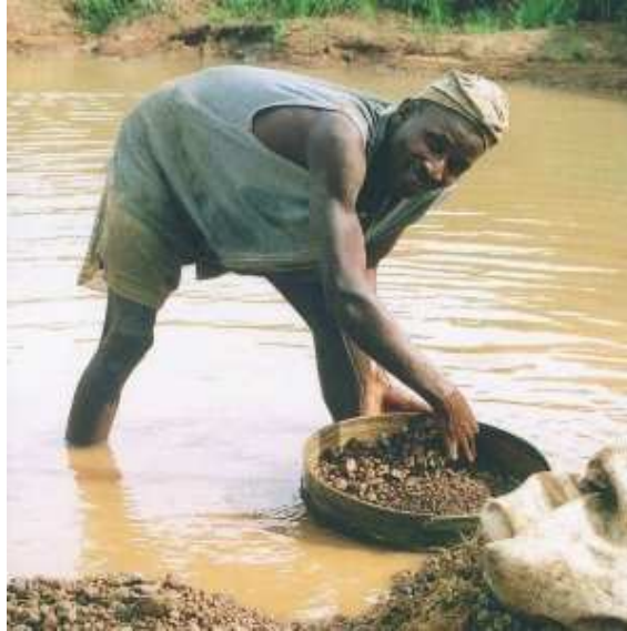
Obr.19. Afričan při těžbě diamantů.