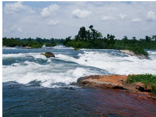
Obr.3. Bílý Nil.

Víte, že... Jezero Tanganika leží ve východní části Velké středoafriické příkopové propadliny. Rozkládá se na hranici čtyř států v nadmořské výšce 775 m. Jezero není zdrojnicí Nilu, jak se dlouho předpokládalo. Má pouze jeden výtok, řeku Lukugo, která se vlévá do řeky Kongo. Jezero je splavné, bohatý je zde i rybolov.