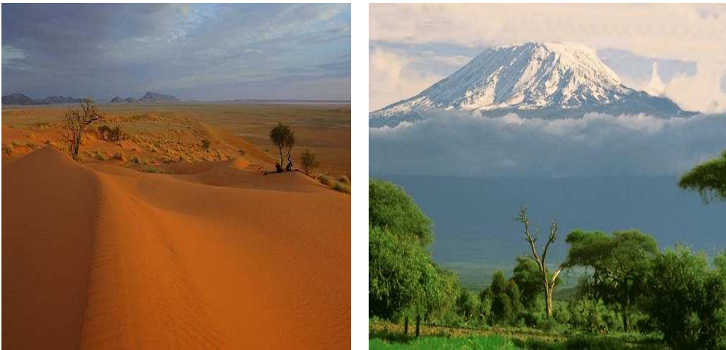
Obr.4. Východní Afrika plná protikladů – najdeme zde jak pouštní oblasti (obr. vlevo), tak i oblasti s trvalou pokrývkou sněhu (obr. vpravo, Kilimandžáro)

Oblast Somálského poloostrova spadá do tropického suchého podnebného pásu . V této oblasti je velké sucho, horko a obrovské rozdíly teplot mezi dnem a nocí. Srážky se zde vyskytují pouze ojediněle. Toto podnebí je ovlivněno suchými pasáty, vanoucími z Arabského poloostrova.