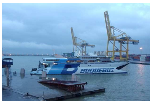
Obr.21. Přístav ve městě Mogadišu.

Víte, že... Ve východní Africe mají pořád svůj význam tradiční formy dopravy – velbloudi, osli, ženy (nosící náklad na hlavě).