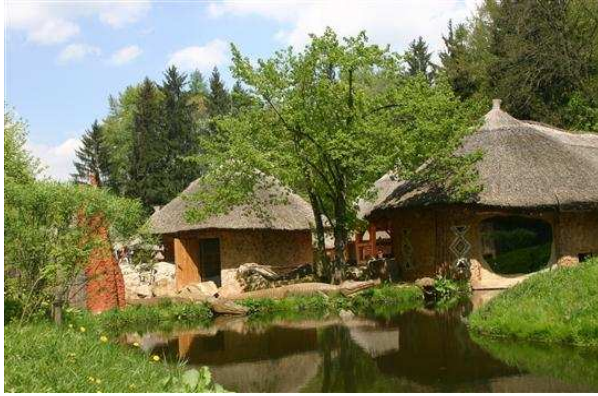
Obr.11. Tradiční venkovské obydlí.