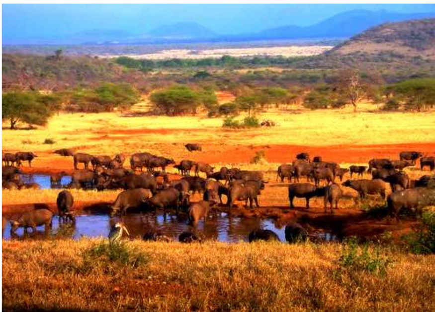
Obr.23. Buvoli v národním parku Serengeti.

Cestovní ruch ve východní Africe má velký význam. Evropští kolonizátoři již na počátku 20. století začaly budovat ve východní Africe rezervace, které se později staly národními parky . Mezi nejznámější národní parky patří Serengeti (Tanzanie) a mezi nejrozsáhlejší národní parky patří Tsavo (Keňa), rozloha 20 800 km 2 . Každý rok národní parky navštíví miliony turistů z celého světa.