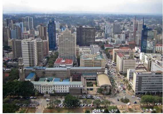
Obr.12. Moderní část města Nairobi.

Víte, že... Masajové jsou původním východoafrickým kmenem, který žije podél keňsko - tanzanské hranice. Celkem je jich asi 100 000. Masajové jsou pastevci, kteří svá stáda pasou pod Kilimandžárem již 300 let. Základem jejich výživy je kravské mléko. Dobytek má pro Masaje obrovskou cenu. Nikdy nemají stálý domov, každé 3 - 4 roky, když jsou okolní pastviny spasené, odstěhuje se kmen o kus dál.