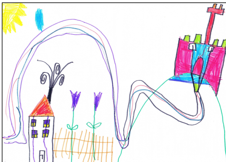
obrázek 4 - Na hradě