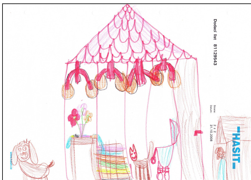
obrázek 1 – Vysněný dům

Rozhovor s Markem nebyl pořízen, neboť onemocněl neštovicemi.