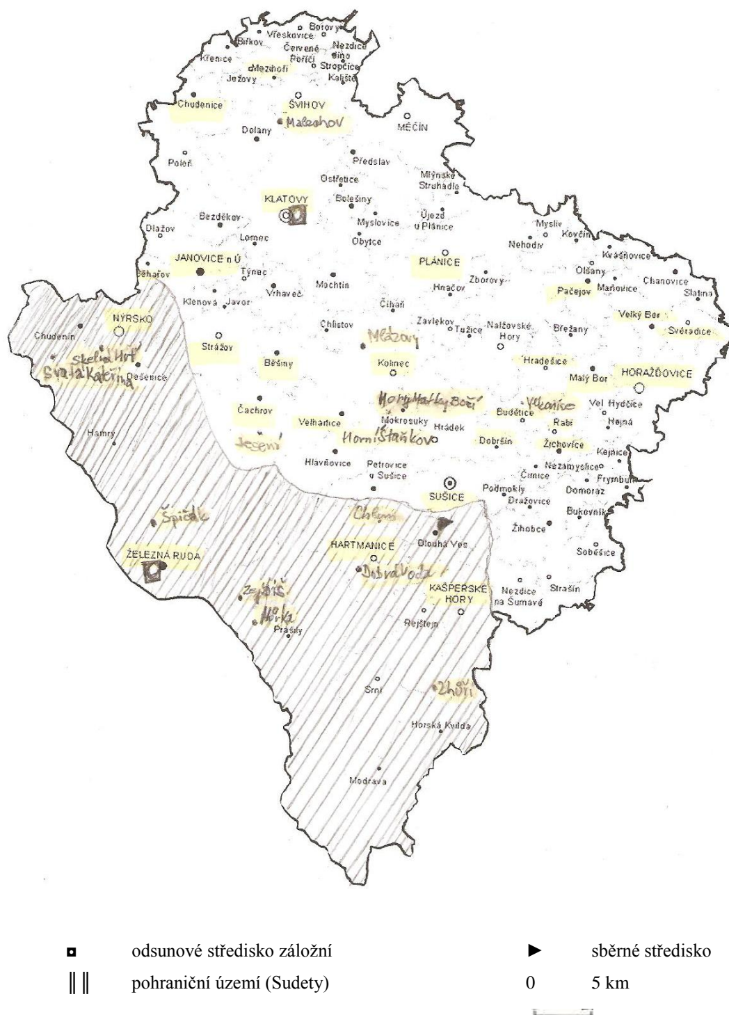
Příloha č. 19: Mapa okresu Klatovy [online]. [2009-20-5] Dostupný z WWW:

< http://www.czso.cz/xp/redakce.nsf/i/4A957C56423F8B36C12574020049DA18/$File/Administrativni_cleneni.jpg >. Mapa byla vlastnoručně upravena a doplněna o další údaje.