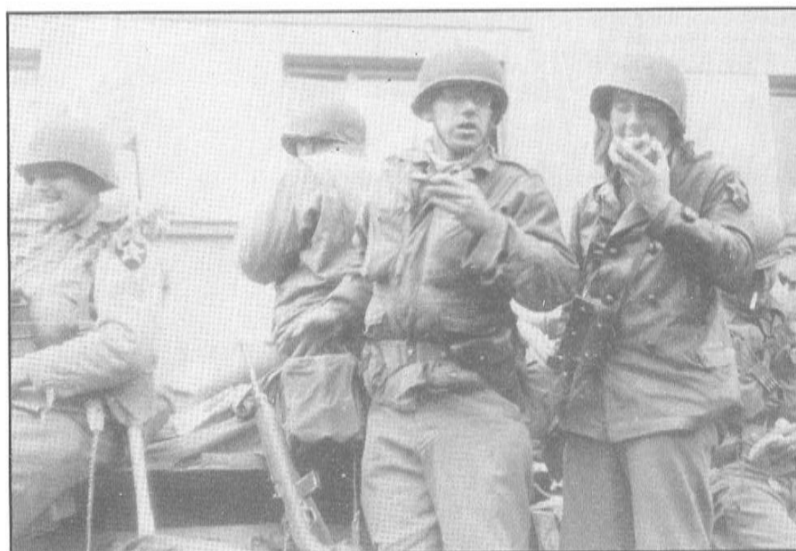
Poddůstojníci 2. pěší divize si pochutnávají na koláčích 6.5.1945 ve Švihově.