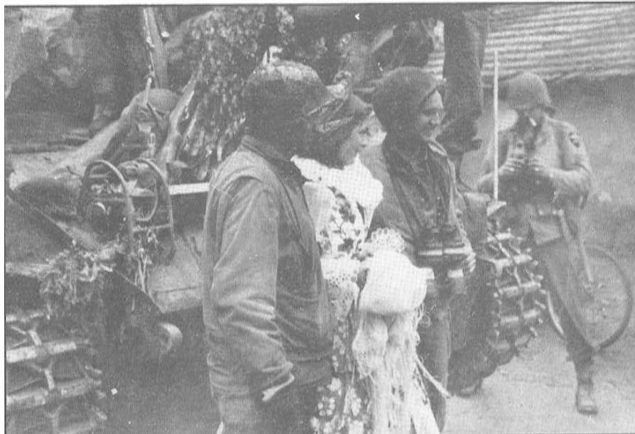
Přijezd čelních jednotek 2. pěší divize do Švihova 6.5.1945.