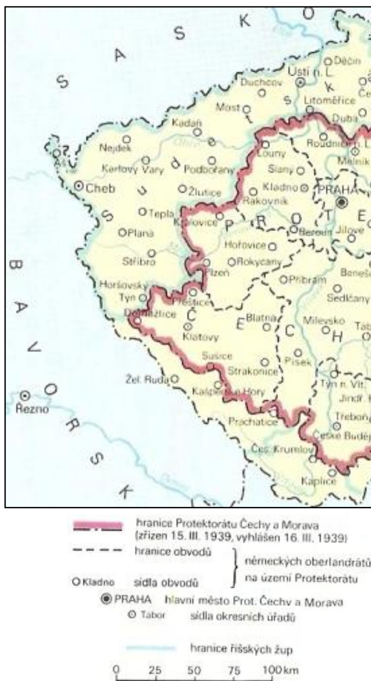
Příloha č. 3: Kol. autorů: Vojenské dějiny Československa: 1939–1945 . 4. díl 1. vyd. Praha: Naše vojsko, 1988. 797 s.