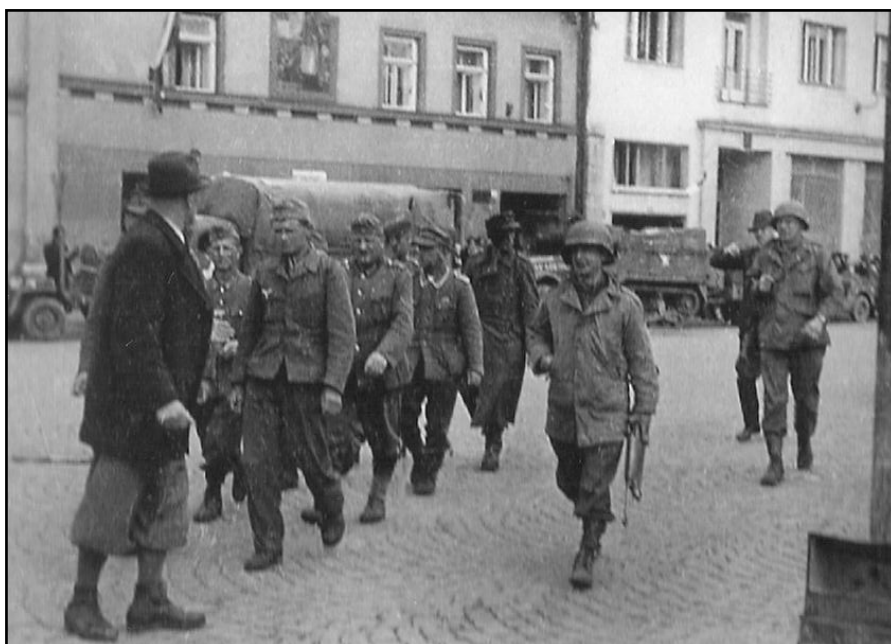
Zajatí němečtí vojáci v Sušici.