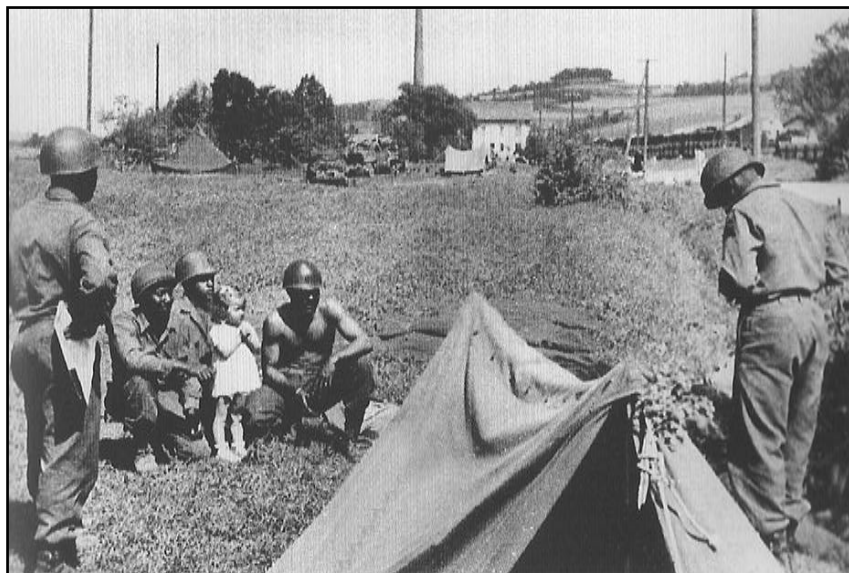
Polní tábor u nádraží. The American camp by the railway station.