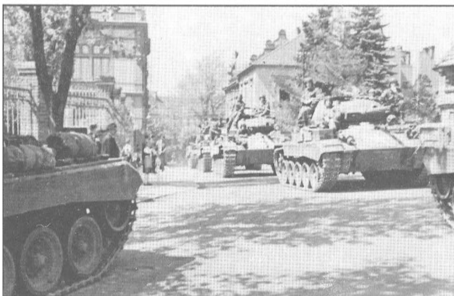
Americká technika plní klatovské ulice. Kolona lehkých tanků M 24 Chaffee projíždí Hostašovou ulicí.

Příloha č. 9: Jirák, J.: Osvobození Klatovska 1945–1995 . Klatovy: Okresní muzeum, 1995. Nestr.