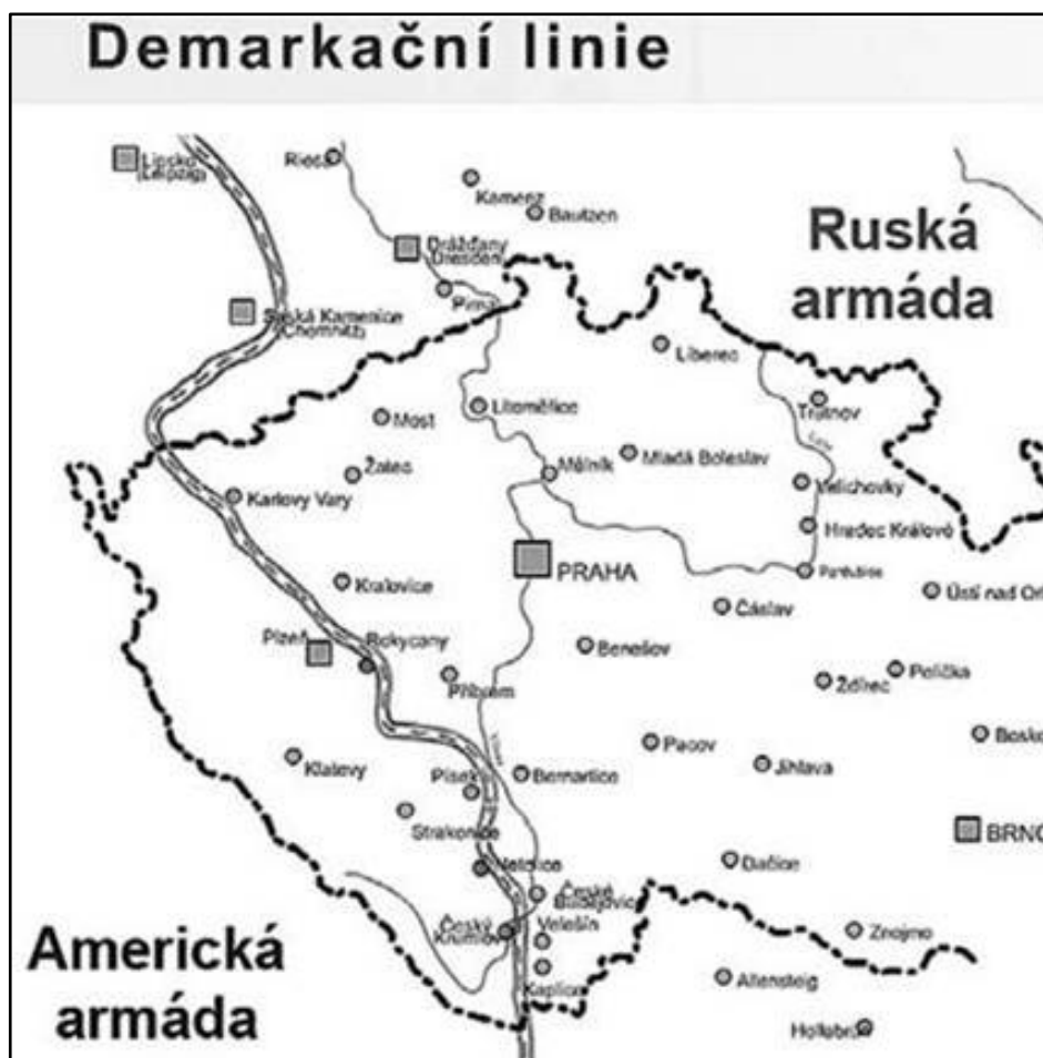
Demarkační linie (Karlovy Vary – Plzeň – České Budějovice)

Příloha č. 6: Demarkační linie [online]. [2008-25-10] Dostupný z WWW: < http://i.idnes.cz/08/051/gal/ITU22e75f_Budejovice1.jpg >.