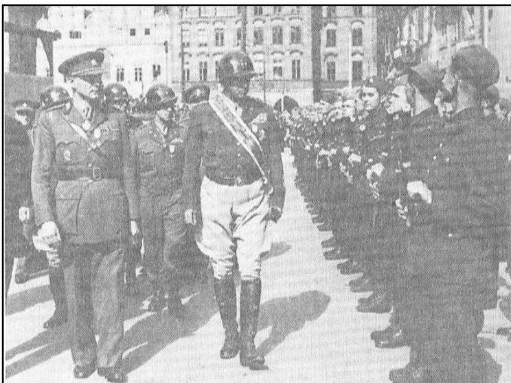
27. července 1945: Generál George Patton na Staroměstském náměstí v Praze po dekorování vysokými čs. řády