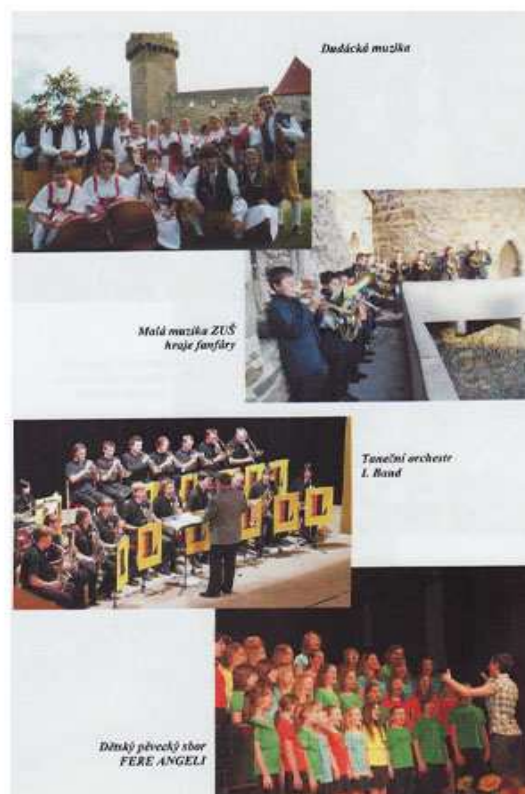
Obr. č. 12