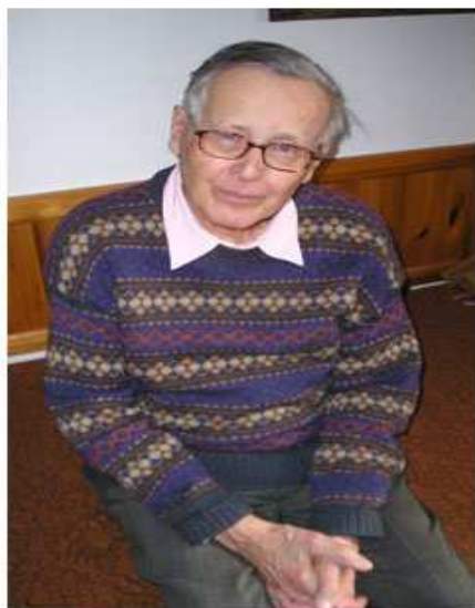
Obr. č. 11