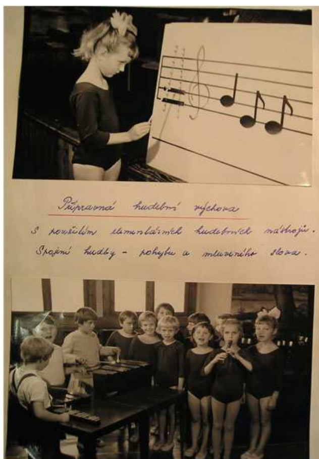
Obr. č. 9