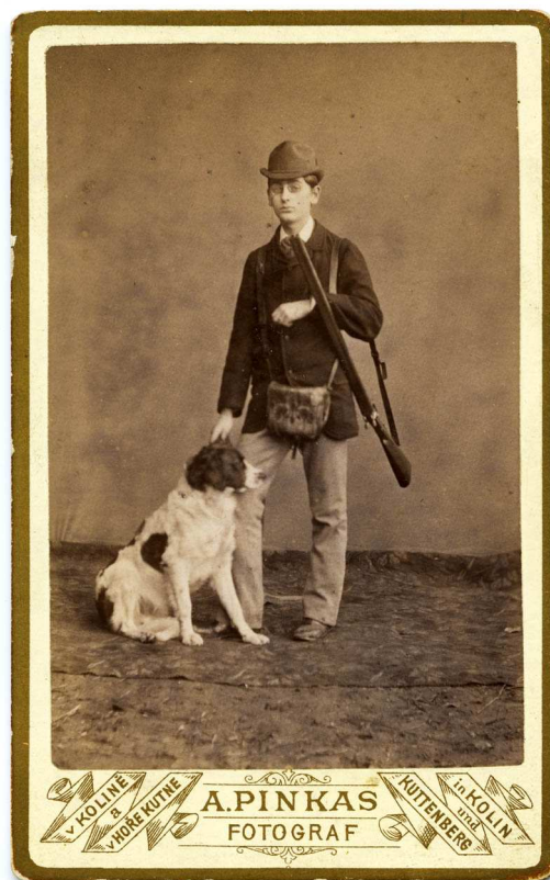
A. Pinkas, bez názvu.