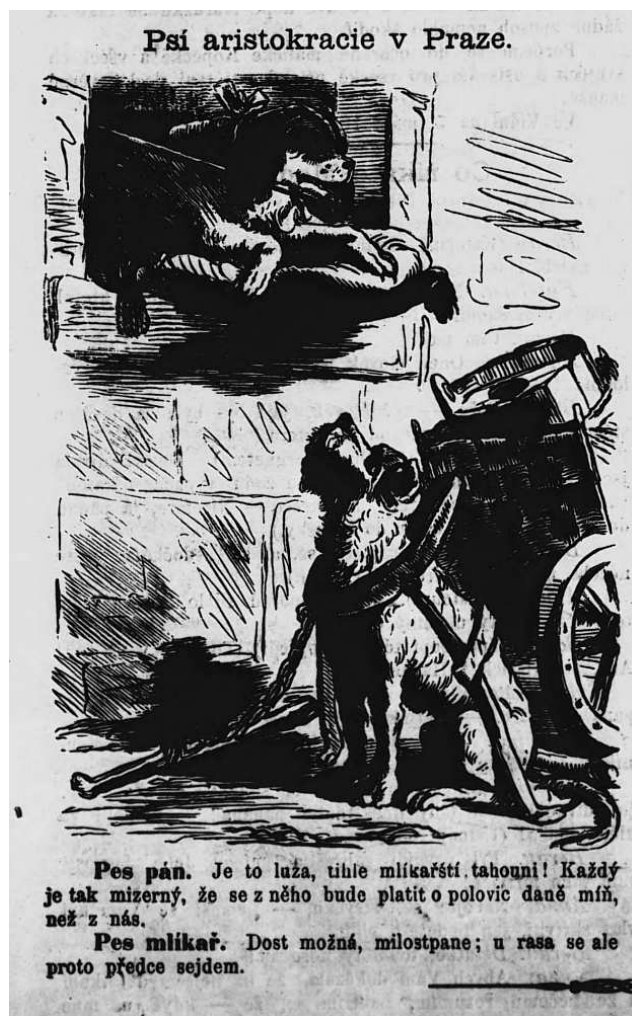
Reakce na zavedení daně ze psů