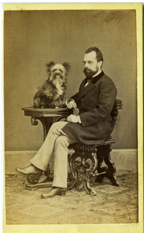
A. F. Grifkonski, bez názvu, Archiv Scheufler.