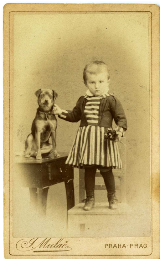
T. Mulač, bez názvu, Archiv Scheufler.