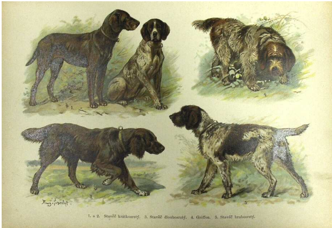
Ukázka loveckých psů - stavěč krátkosrstý, dlouhosrstý, grifon, stavěč hrubosrstý.