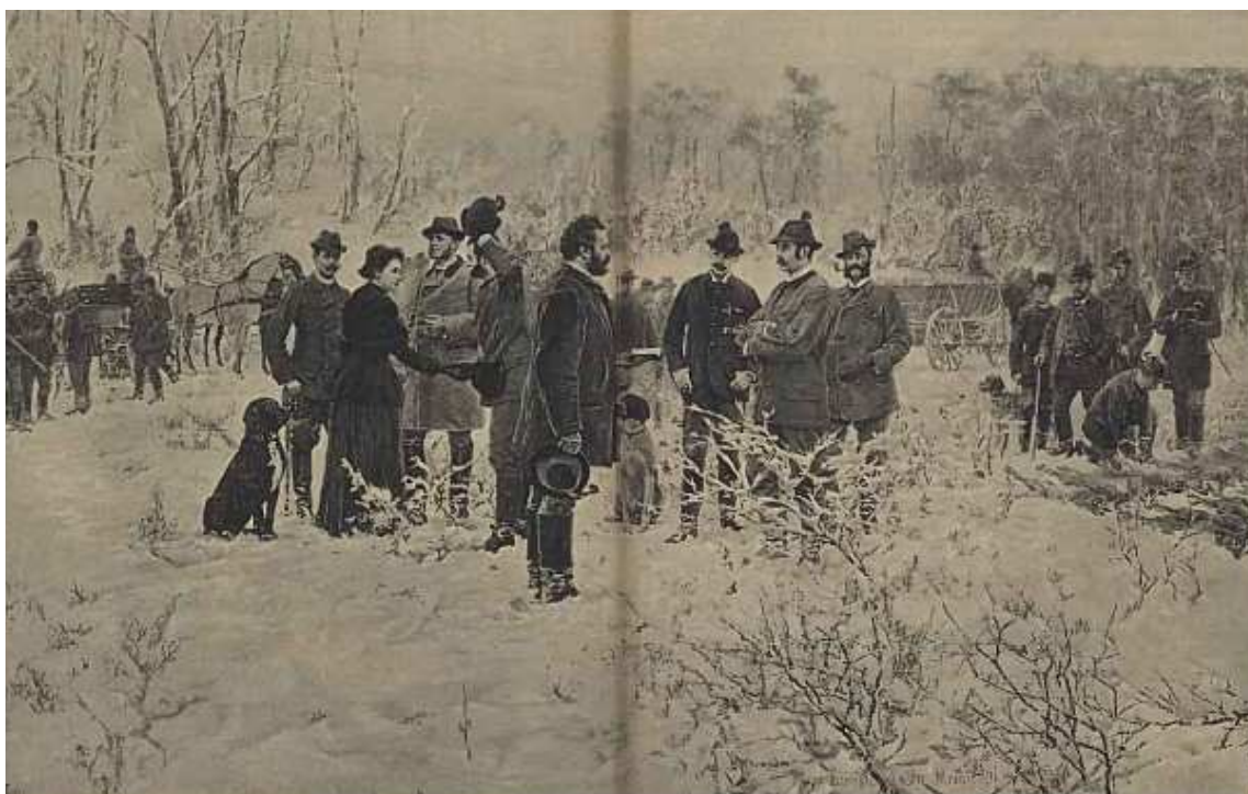
Honba v Průhonicích