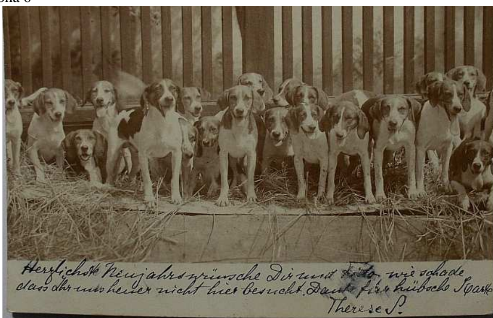
Blahopřání k novému roku