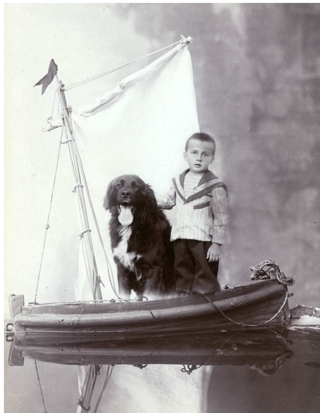
K. Smolka, bez názvu, Archiv Scheufler.