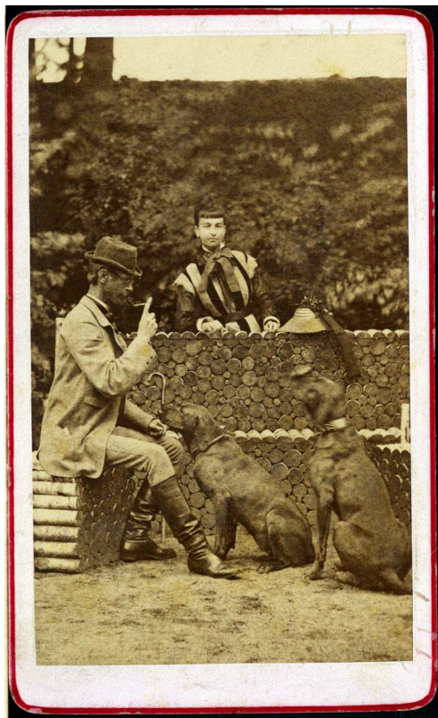
Anonym s poznámkou „Hrabě Aichelburg s paní“, Archiv Scheufler.