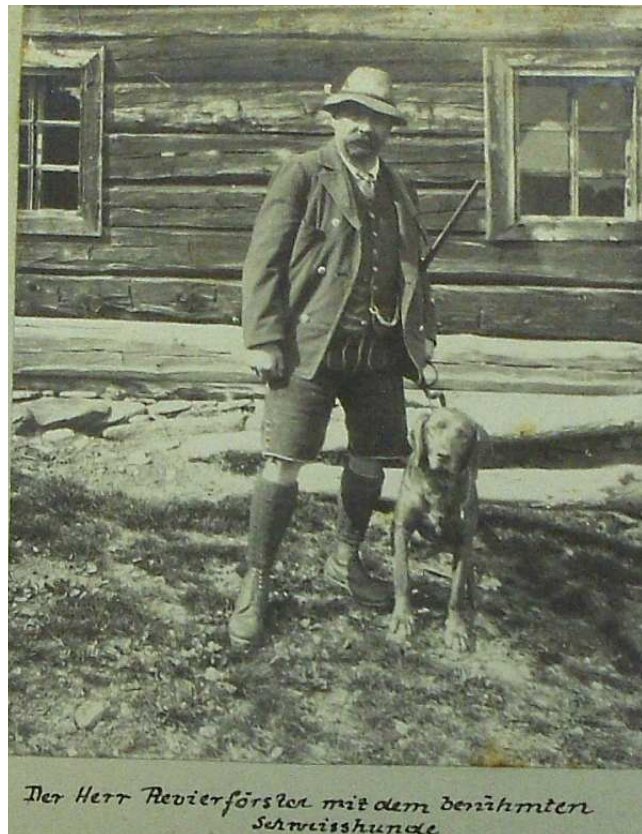
Revírník s proslulým psem