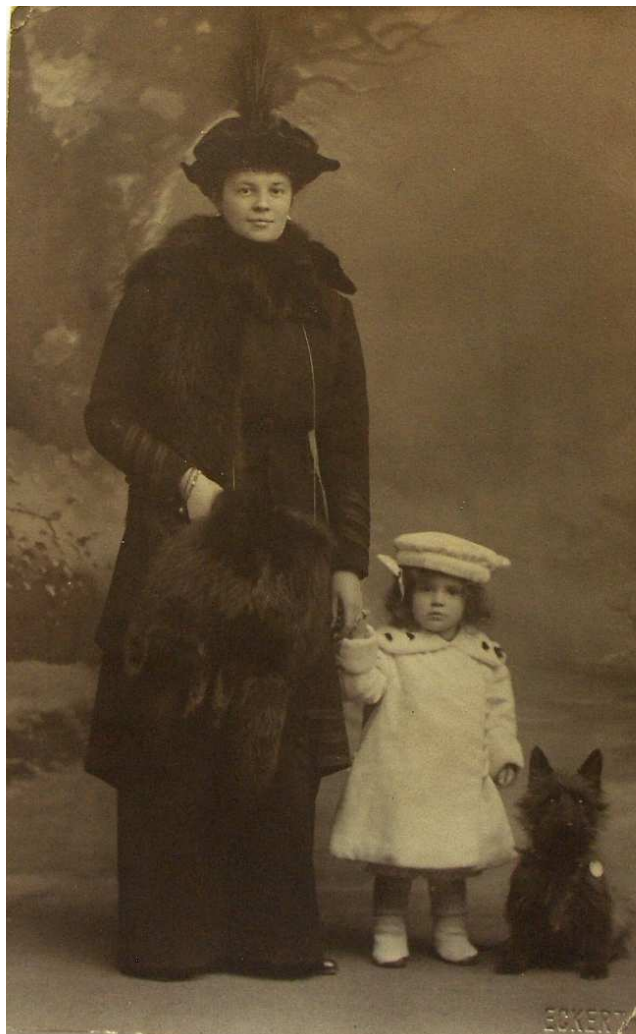
Pohlednice Bedřichovi ze Schwarzenbergu