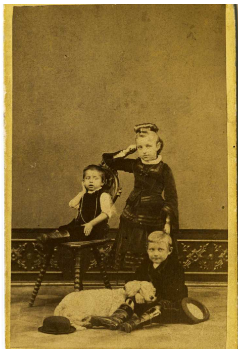
J. Benda, bez názvu, Archiv Scheufler.