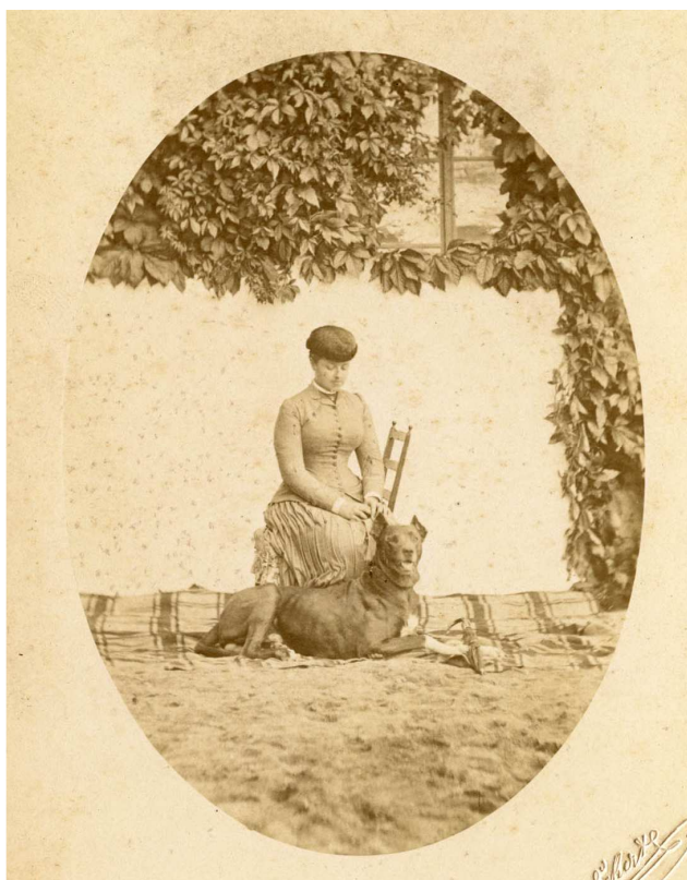
Jindřich Eckert, bez názvu, Archiv Scheufler.