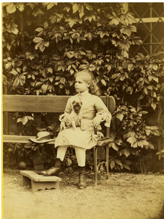
Anonym, Fürstenberg 1876, Archiv Scheufler.