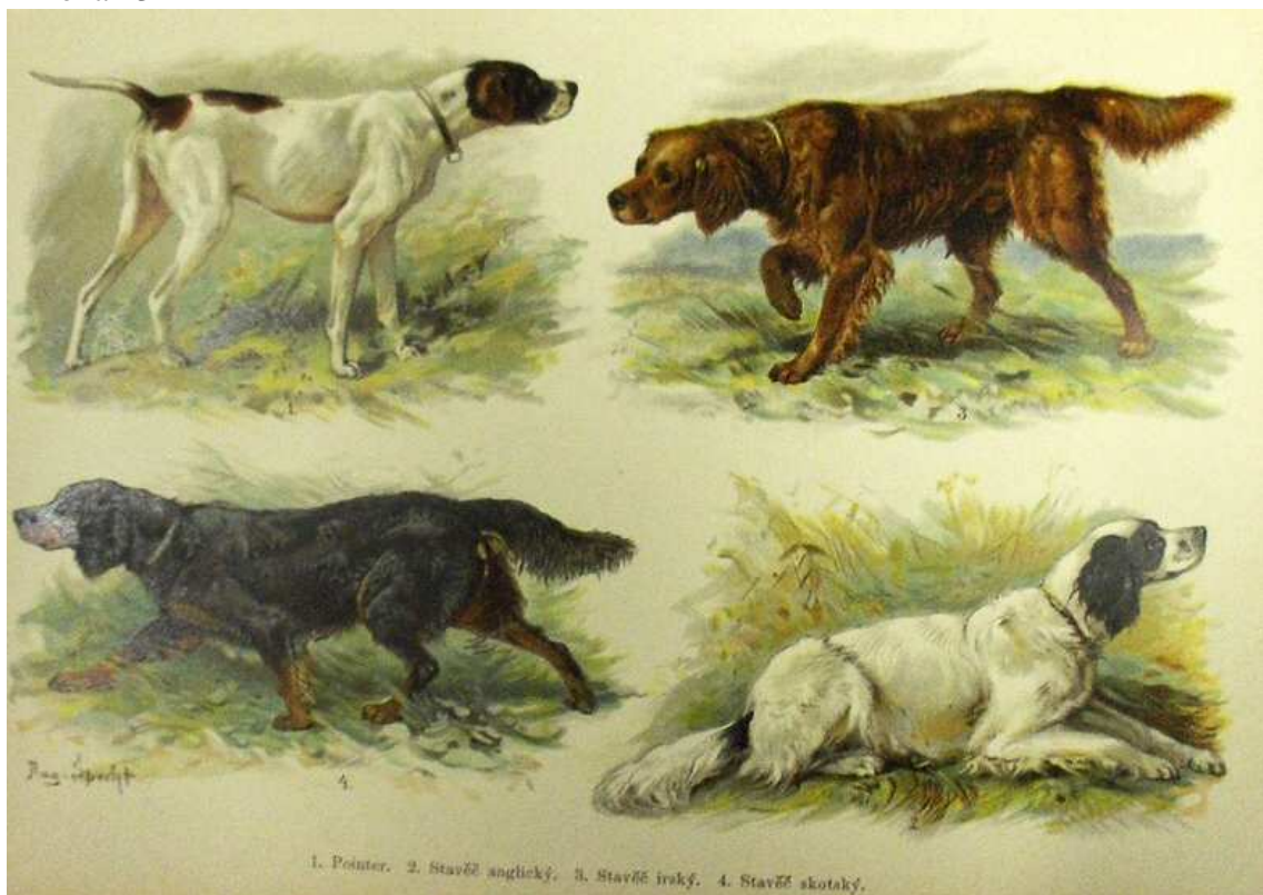
Ukázka loveckých psů - pointer, stavěč anglický, irský, skotský.