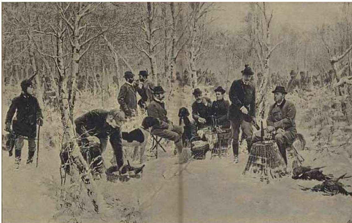
Snídaně v bažantnici o honbě v Průhonicích