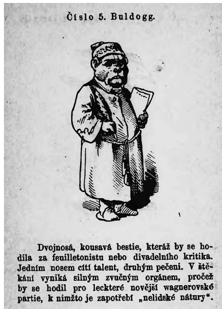
Ukázka dobového humoristického tisku