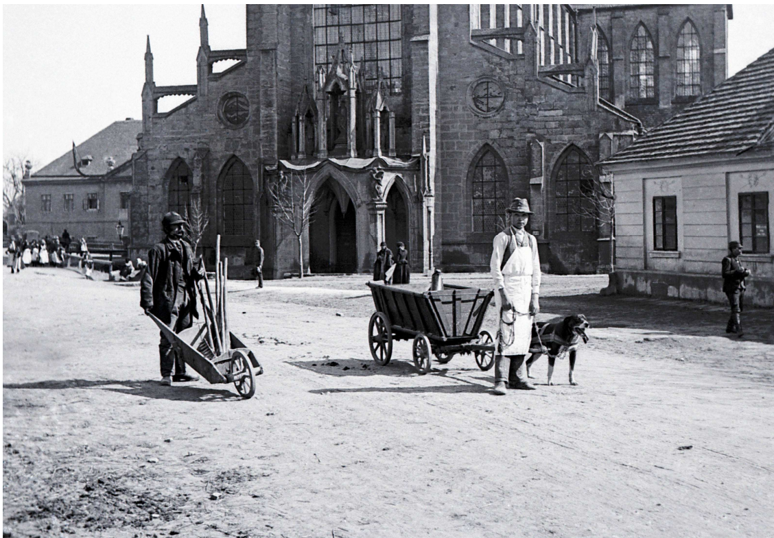
František Krátký, bez názvu, Archiv Scheufler.