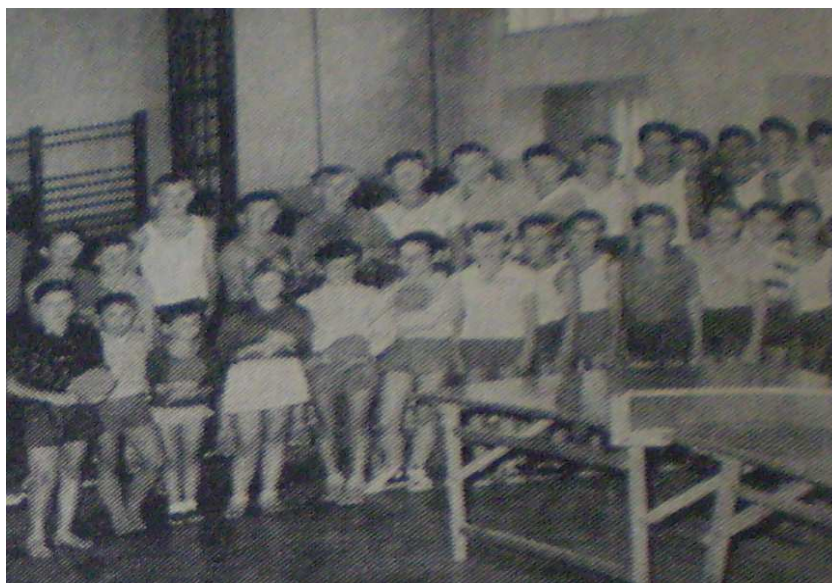
Foto č. 8: Klub I. T. T. K. Zbraslav

Zbraslavský klub byl znám po celé republice. Na Zbraslav přijížděly k utkání přední pražské ligové kluby: AC Sparta, Vysokoškolský klub Praha, Malostranský,... Hráči ze Zbraslavi jezdili do Prahy, na Kladno, do Plzně, Berouna, Českých Budějovic, Jindřichova Hradce, Hořovic, Českého Brodu a dalších měst. Úspěchy zbraslavských hráčů upoutal asociaci a klub dostával nabídky k sehrání meziklubových zápasů. Historie stolního tenisu ve Zbraslavi byla založena z nadšení, zájmu o sport, snaze podávat co nejlepší výkony. Tehdy klub neměl finančních prostředků, a tak se hrálo na „revanš“. Každý jednotlivec si musel hradit cestovné sám ze svého. Hráči stolního tenisu ve Zbraslavi byli dělníci, truhlářští učni a museli šetřit, aby mohli jet na zápas. 93