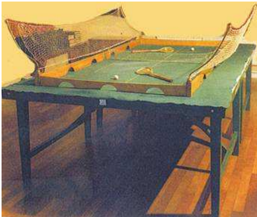
Foto č. 1: Parlour lawn tennis (salonní tenis)