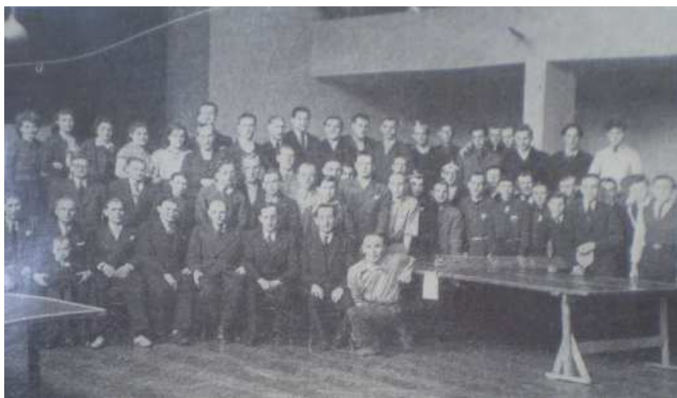
Foto č. 9: Účastníci svazového mistrovství ve stolním tenise v Uhříněvsi

Dne 22. - 23. února téhož roku se v Lidovém domě v Uhříněvsi uskutečnilo mistrovství svazu ve stolním tenisu. I když nebyly nalezeny výsledky tohoto mistrovství, ví se, že zde byly zde sehrány různé soutěže: tříčlenná družstva mužů, dvoučlenná družstva žen, soutěže jednotlivců, pánské, dámské a smíšené čtyřhry. Na mistrovství přijeli zástupci Ostravska, Rokycanska, Hradecka, Kladenska, Hořovicka. (viz foto č. 9). 103