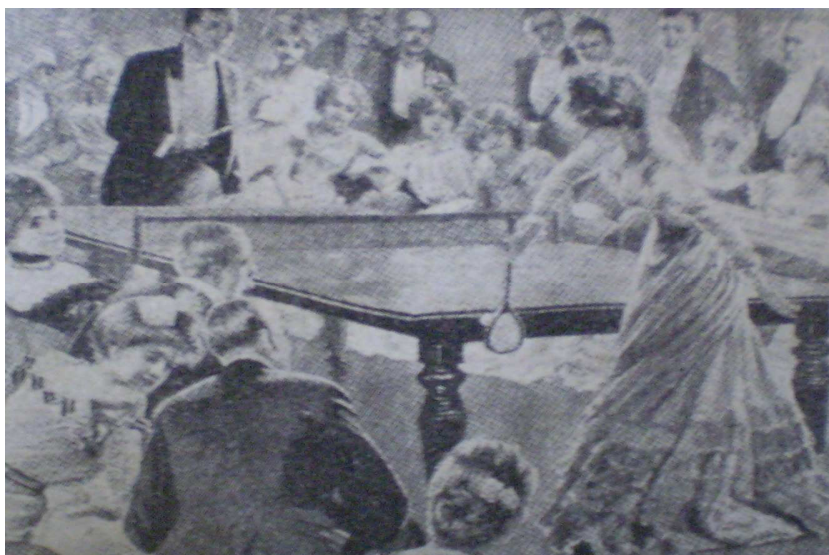
Foto č. 2: Hra Gossima

dobře osvědčily při hře. James Gibb přiměl Johna Jaquese, sportovního výrobce, aby zaregistroval již zmiňovaný název Gossima (tato hra se provozovala od 16. 7. 1891). Gossima byla hrací souprava obsahující přenosnou síť, kterou dali na stůl. Ve večerních hodinách hráli ve večerních úborech angličtí gentlemani a jejich lady v plesových toaletách. V ruce měli malé bandžo – páčky s dlouhými držadly, něco jako bubínky s pergamenem napjatým v dřevěných rámech (viz foto č. 2). Pergamenové páčky podléhaly často změnám vzduchu, a tak se později hrálo s dřevěnými páčkami. Později bylo ke hře používáno pálek, které byly opatřeny na hrací ploše kordem, knihařským plátnem, hladkou a různě vroubkovanou gumou. V r. 1891 si dal Charles Barter z Blockleye patentovat vynález páčky pokryté knihvazačským plátnem nebo podobným materiálem, aby se míčku mohla dávat faleš. Pro verzi této hry se prvně používalo kaučukových míčů o rozměrech 30 mm. Poté byl vystřídán kaučukový míček korkovým, ten měl rozměr 50 mm. 2