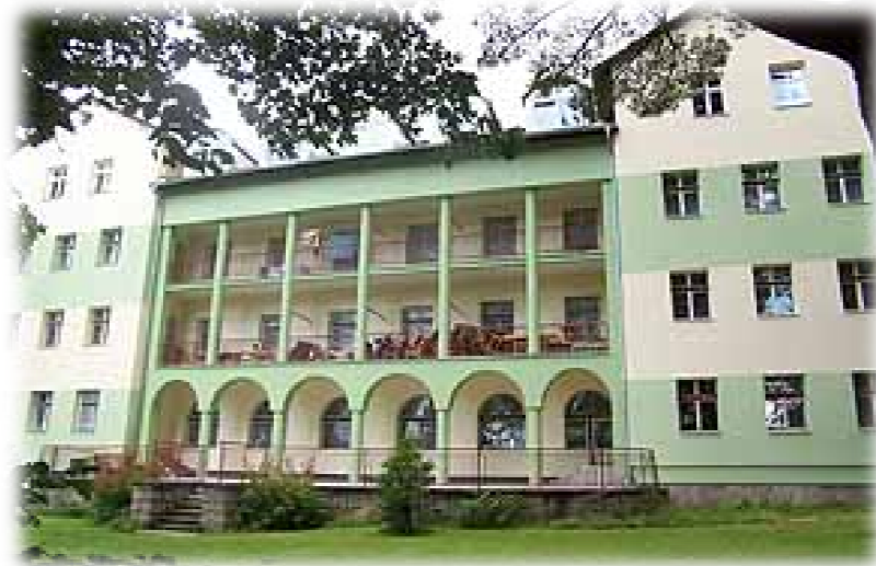
Internát VÚ Počátky