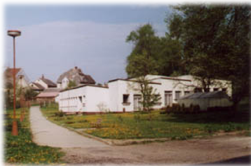
Škola VÚ Počátky