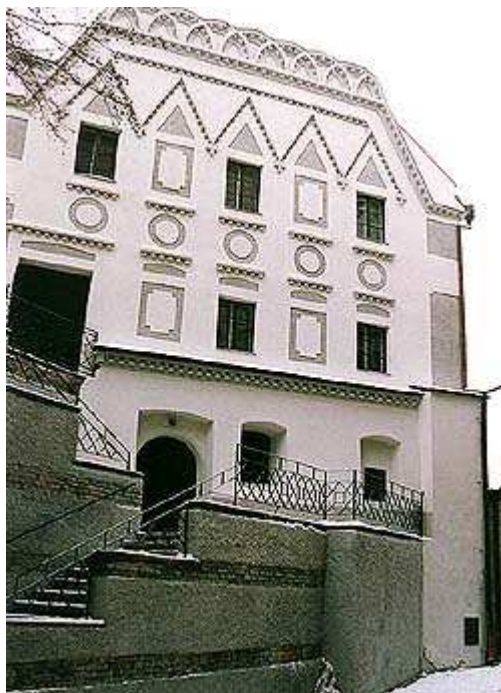
Obr. č. 3: Dům v Kostelní ulici č. 162 – první kamenná škola