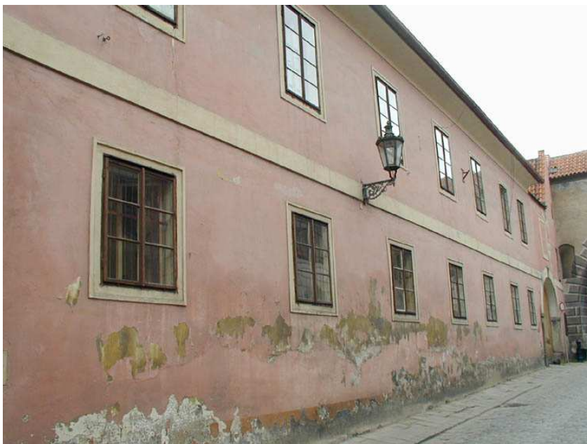
Obr. č. 4: Latrán č. p. 67

Klášteř klarisek se nacházel na Latránu č. p. 67, kde v současné době sídlí několik podnikatelsky zaměřených subjektů. Na obrázku č. 4 je pohled na bývalý klášter klarisek z hlavní ulice.