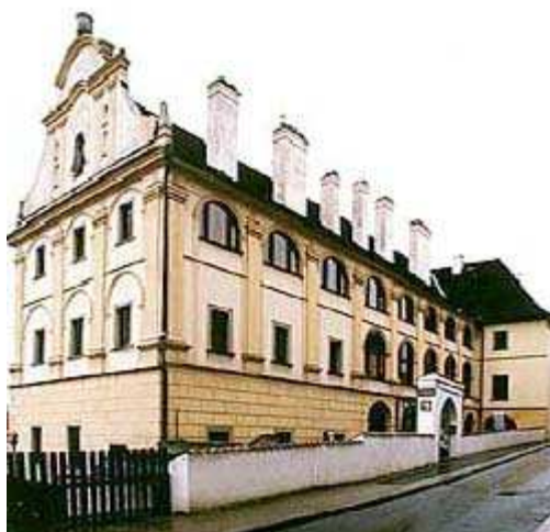
Obr. č. 6: Horní ulice č. p. 152