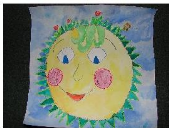
“Jarní sluníčko“ Kolorovaná kresba