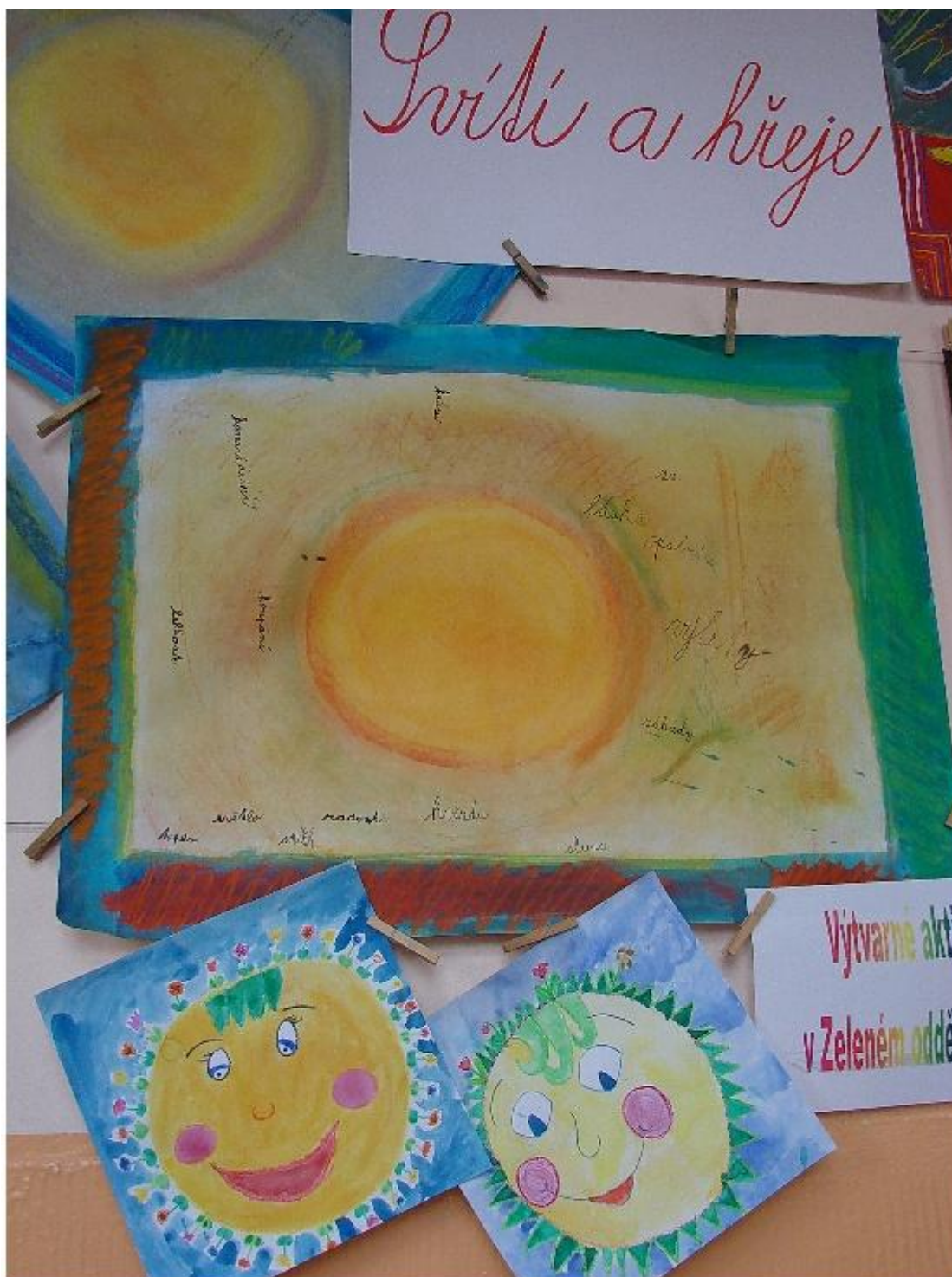
Výtvarný projekt „Sluníčko“ Výstava dětských prací ve škole