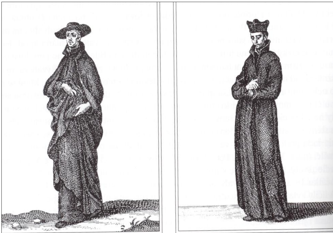
Příloha I. Kněz řádu jezuitů v klerice s cingulem, na hlavě kvadrátek Laický člen řádu jezuitů v černém plášti, klobouku, černé klerice s cingulem.