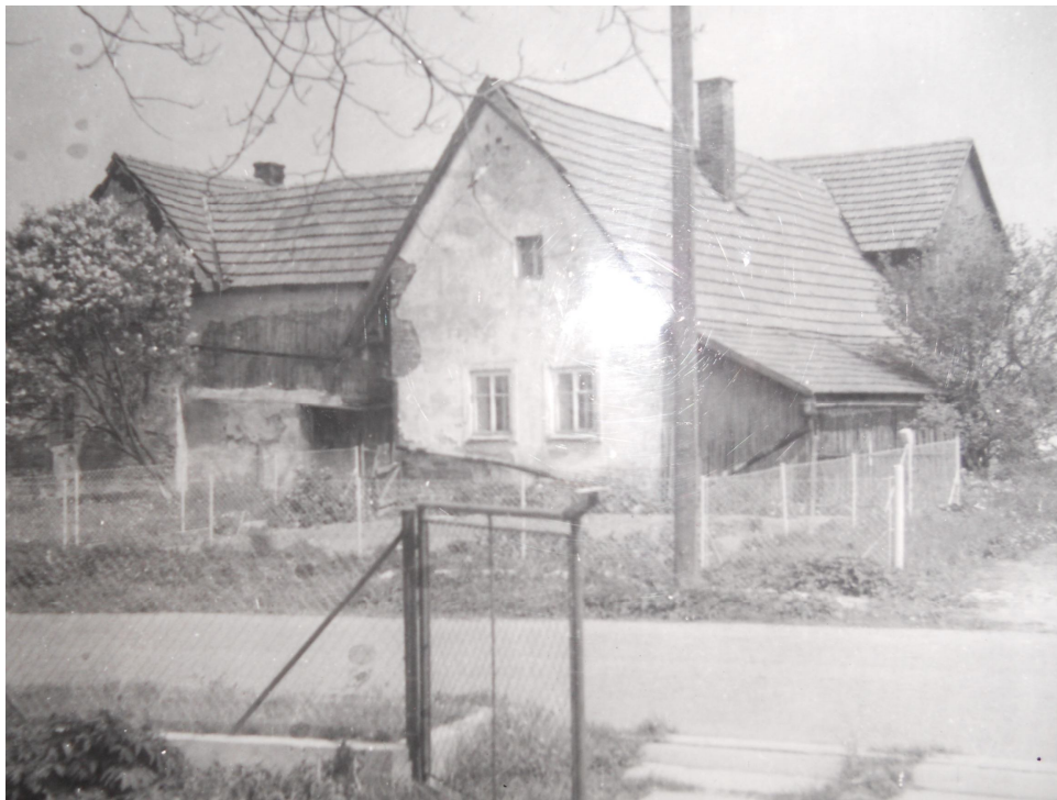
Příloha č. I Rodný dům