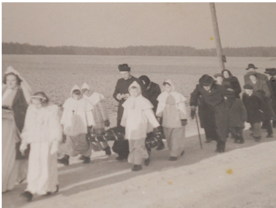
Příloha č. II Primiční průvod