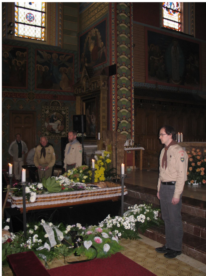
Příloha č. V Pohřeb 15. 10. 2008