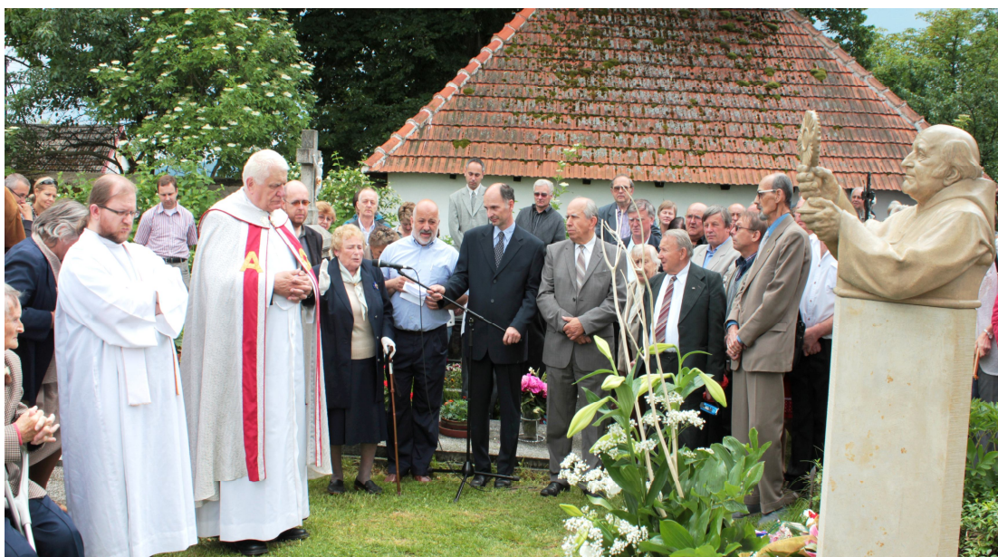
Příloha č. VI Odhalení pomníku na Dobří