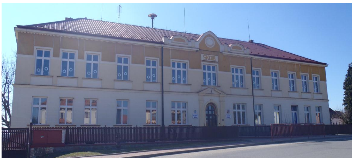
Obrázek 8: Budova školy v současné době

Celkem přijato 25 dětí. Tento rok nastoupil i můj 3letý synovec Ondřej. Do školky se těší, že si pohraje s kamarády. V prosinci si pro rodiče děti připravily Vánoční besídku. Po vstoupení děti mohly vytvářet vánoční přáníčka, dekorace, povídali si u cukroví a vánočního čaje. Spolupráce s rodiči je na dobré úrovni. Od 1. ledna 2012 pracuje ve školní kuchyni nová kuchařka paní L. Doktorová. Na měsíc červen učitelky s dětmi připravují pásmo písní k příležitosti 100letého výročí školy. Do 1. třídy bude odcházet 5 dětí.