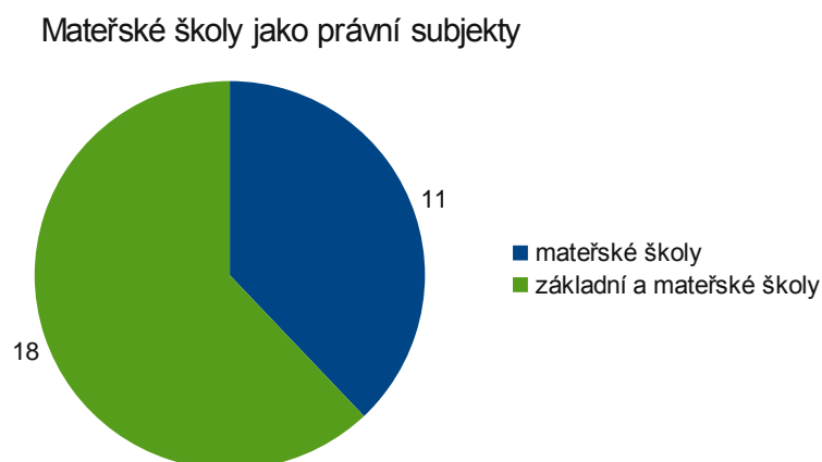
Obrázek 10: Mateřské školy jako právní subjekty

Graf poukazuje na to, kolik mateřských škol spadá do jednoho právního subjektu se základní školou. Celkem 37,9%(11) samostatně fungujících mateřských škol a 62,1% (18) tvoří mateřské školy spojené do jednoho právního subjektu se základní školou.