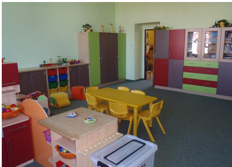
Obrázek 11: Šatna