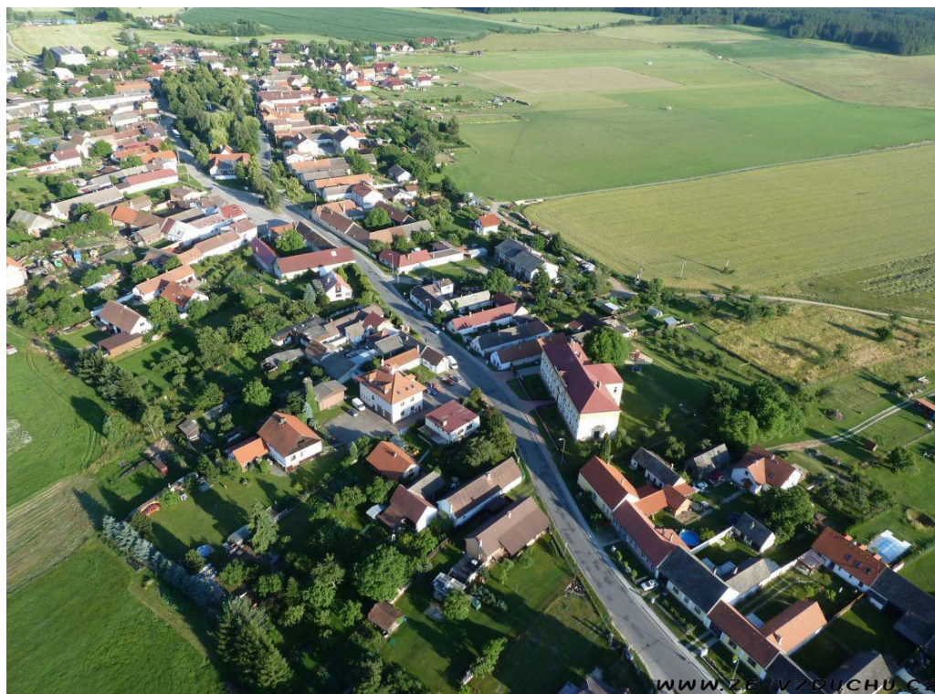
Obrázek 2: Letecký snímek obce Novosedly nad Nežárkou

Obec Novosedly nad Nežárkou (lidově Novosedla) je poprvé zaznamenána v roce 1359, kdy patřila k panství Strážskému. Jméno obce pravděpodobně vyjadřuje skutečnost vesnice nově osídlené, druhá část názvu "sedly" bezpochyby souvisí se slovy sedět, sedlat, sedlo či sídlo. Vesnice patří do okresu J. Hradec a náleží pod Jihočeský kraj. Obec se rozkládá asi 16kilometrů jihozápadně od J. Hradce a 10kilometrů severovýchodně od města Třeboň. V současné době žije v této středně velké vesnici a přilehlých obcích 656 obyvatel. K Novosedlům nad Nežárkou dále patří obce Kolence a Mláka. Pod Novosedly protéká řeka Nežárka. Pro děti školního věku je v obci k dispozici základní škola nižšího stupně a předškolní děti mohou navštěvovat jednotřídní mateřskou školu. V letošním roce 2012 oslaví Základní a mateřská škola své 100leté výročí od založení. Při tvorbě této studie jsem čerpala z Národní památní knihy, kroniky školy, vzpomínek pamětníků i vzpomínek mých vlastních. Případný zájemce se může o všech změnách, rekonstrukcích a všech akcích týkajících se provozu mateřské školy dočíst v kronice MŠ, která je ve zkrácené podobě k dispozici.