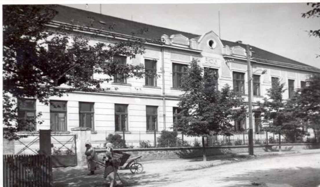
Obrázek 4: Budova školy v roce 1937

školu rádio přijímač pro školský rozhlas. Ve školním roce 1934/35 počalo se s vyučováním III. třídy v pobočce dělené podle pohlaví. Ve školním roce 1936/37 byla škola zřízena pro organizaci školy čtyřtřídní. Do školy chodí celkem 151 dětí. Pro přespolní a pro všechny děti zdejší školy zavedla Místní péče o mládež stravovací akci (1940). Školu navštěvoval okresní školní inspektor F. Molík, vždy odcházel spokojený. Školní rok 1944/45 bylo zapsáno 83 dětí do zdejší školy. V měsíci září 1944 vypukla ve zdejší obci přenosná dětská obrna. Onemocnělo několik dětí a 3 z nich zemřely. V době, kdy byla škola obsazena německými uprchlíky, tj. od 15. února do 5. května 1945 nebylo pravidelné vyučování. Dvakrát týdně dávány domácí úkoly v netopených místnostech hostince „U Čápů“, dnešní budova české pošty. Ve dnech 2. – 5. května byla zdejší školní budova obsazena větší jednotkou SS. Škola byla po těchto třech dnech uvnitř zdemolována. Na toto vzpomíná paní Mašková (rozená Štichová), která viděla, jak byla škola zničena. „Bylo to strašné, co všechno zničili.“