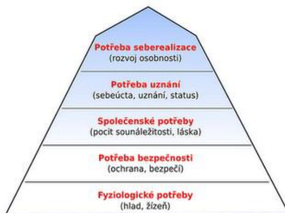
Obrázek 1: Maslowova pyramida lidských potřeb

Pro uskutečňování vzdělávání dětí v mateřské škole je potřebné vytvářet příznivé podmínky. Americký psycholog A. Maslow vytvořil teorii přirozených lidských potřeb, které seřadil hierarchicky podle důležitosti od těch nejnaléhavějších až po nejméně naléhavé. Pro každé patro z pětistupňové pyramidy je vyhrazena jedna oblast potřeb. Svobodová (2007b) vyzdvihuje, že pokud dítě nemá naplněny potřeby z prvních dvou pater, nemůže se v určitém prostředí cítit dobře, zažívat pocit uznání a mít pocit sounáležitosti s ostatními. Dítě nemá možnost se tedy ani učit. Platí zde pravidlo: „Pokud není naplněno nižší patro, nemůže být naplněno patro vyšší.“