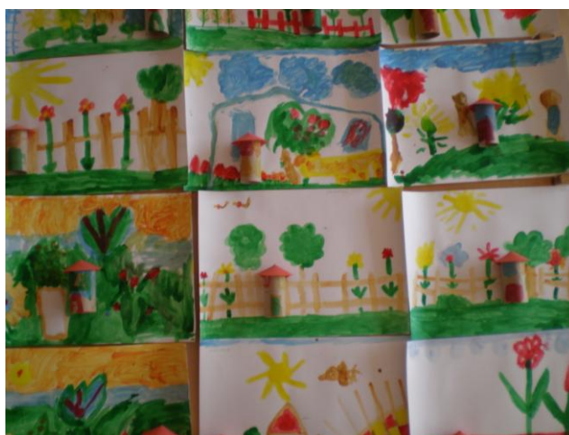
obr. 6. Malba louky a zahrady s dolepeným domečkem

Po příchodu si děti mohly prohlížet knihy s obrázky přírody, květin a zvířat. Poté, kdo chtěl, mohl pro motýly a jiná zvířata malovat temperovými barvami louku. Následovaly činnosti na koberci, při kterých se děti nejdříve protáhly a zahrály si na zvířata za zvuku písně Hajný je lesa pán. Děti byly seznámeny s pravidly hry a poté měnily pohyby podle toho, které zvíře jsem řekla. Když byly děti dostatečně uvolněné, povídaly jsme si v kroužku o zvířatech, která žijí v lese a na louce, jak vypadají, kde bydlí a čím se živí. Také jsem dětem ukázala namalované stopy zvířat a děti hádaly, komu stopy patří. Poté jsem připravila překážkovou dráhu, která měla připomínat procházku lesem. Děti chodily mezi papírovými stopami zvířat, prolézaly látkovým tunelem jako liščí norou, válely sudy na žíněnce jako medvědi. Když si všichni prošli dráhu alespoň jednou, měly děti za úkol namalovat u stolečků jedno lesní zvíře nebo strom.