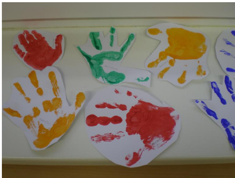
obr. 18. Otisk dlaní