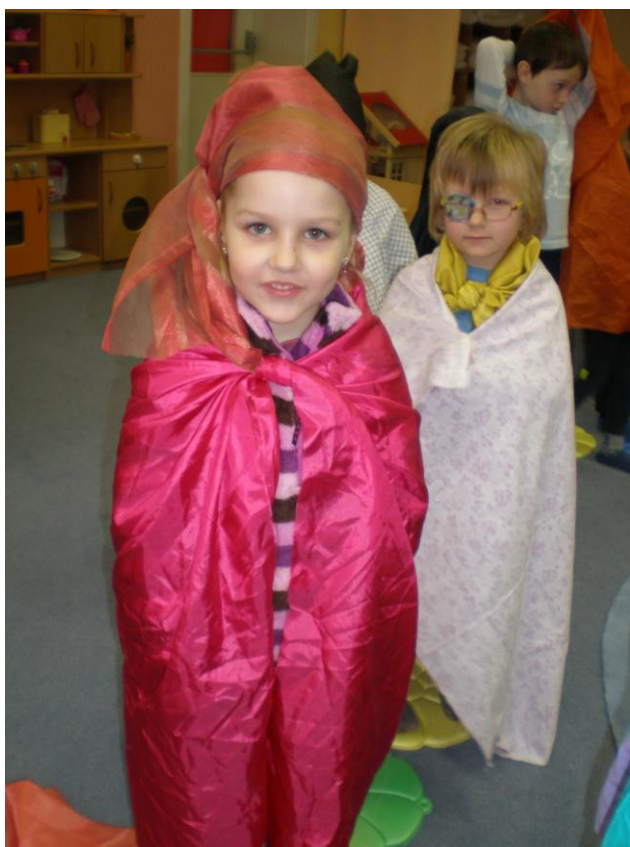
obr. 19. Kostým Červená Karkulka