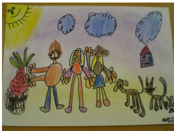
obr. 13. Kolorovaná pohádka