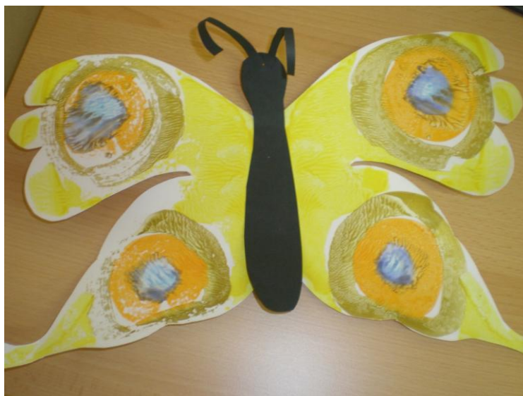
obr. 5. Motýl z otisku temperových barev