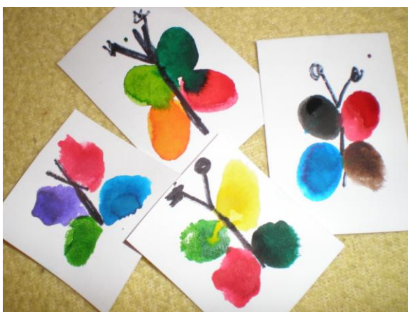
obr. 3. Motýl z otisku prstových barev

Hned ráno si některé děti vybarvovaly omalovánky a jiné tvořily u stolečku motýly otiskováním prstových barev na čtvrtku. Po tomto otiskování a seznámením s barvou následovalo zapouštění bretonových barev do klovatiny a z toho i následná výroba motýlů. Při této činnosti děti především pozorovaly zapouštění barev do sebe a vznik nových barevných odstínů. Po svačině jsem si s dětmi povídala o motýlech, o tom jaké mají barvy, z čeho se vyvíjí atd. Na toto povídání navázala hra Let motýlů. Když se děti dostatečně rozeřádaly, začali jsme se cvičením, které bylo motivováno barevnými křídly motýlů, na která jsme využily barevné tylové látky. Po protažení a zacvičení si každé dítě u stolečku vyrobilo dalšího motýla, tentokrát otisknutím temperových barev z jedné poloviny křídel na druhou. Při příchodu z vycházky jsem společně s dětmi vyzdobila třídu vyrobenými motýly.