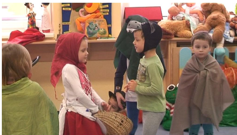
obr. 16. Dramatizace pohádky

Při ranních činnostech děti za mé pomoci vyráběly bramborová tiskátka a tiskly na zástěru určenou Karkulce a na přeloženou čtvrtku určenou jako přáníčko. Po této činnosti a svačině následovalo převyprávění pohádky O Červené Karkulce s pomocí obrázků a maňáska. Zeptala jsem se dětí: „Jaké postavy byly v pohádce? Jakou barvu nosí na svém oblečení myslivec? Proč se holčička z pohádky jmenovala Červená Karkulka? Jaké znáte ještě červené věci? Co Karkulka mohla v lese vidět? Co byste babičce daly vy? “ Po těchto otázkách se děti protáhly u hry Jakou barvu máš na sobě a Čáp ztratil čepičku. Následovala dramatizace pohádky, při které se děti vystřídalily v roli herců a diváků. Na dramatizaci volně navázalo hledání vystřižených papírových květin viditelně schovaných po třídě a jejich následné vybarvování voskovými pastely a přilepení izolepou na špejli. Nakonec následovala odměna v podobě rozkrájené buchty.