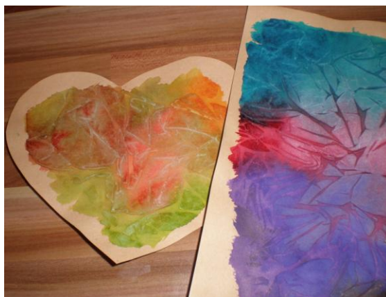
obr. 15. Otisk potravinářské fólie