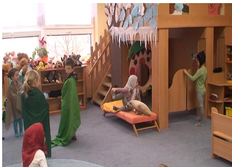
obr. 23. Dramatizace pohádky