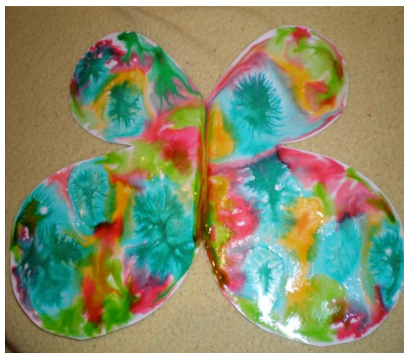
obr. 4. Motýl ze zapouštění barev do klovatiny