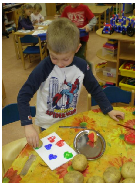
obr. 17. Tisk bramborovým tiskátkem