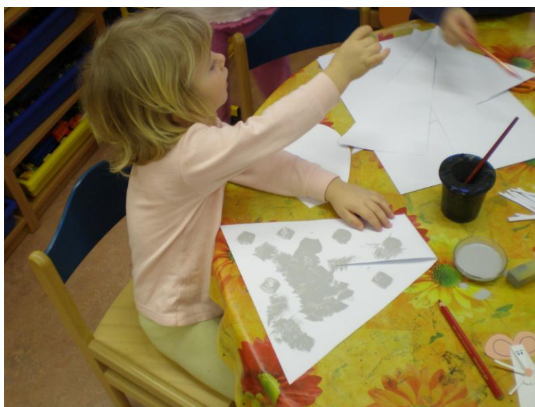
obr. 21. Tisk houbičkou