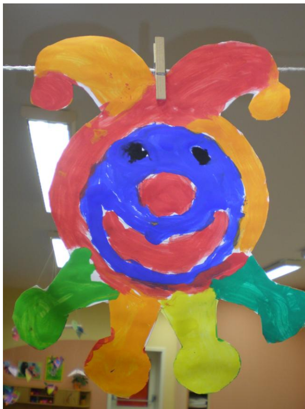
obr. 20. Namalovaný šašek