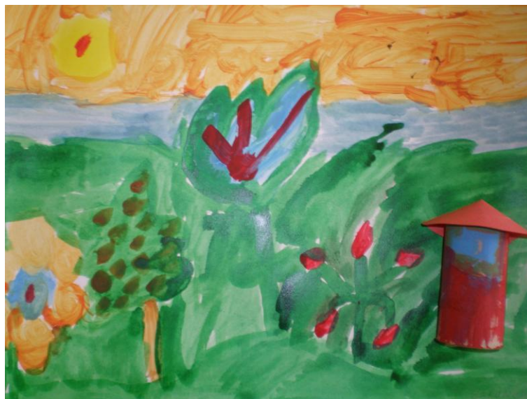
obr. 22. Malba louky