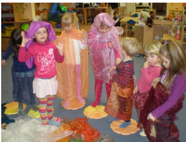
obr. 8. Tvorba kostýmů z barevných látek

Ráno si děti u stolečků prohlížely připravené pohádkové knížky a poté si mohly jít otisknout svou pohádkou stopu. Měly za úkol vybrat si barvu, kterou by do pohádky chtěly vstoupit. Po svačince jsem si s dětmi v kroužku povídala o jejich oblíbených pohádkách a o tom, které barvy by podle nich měly na sobě postavy z pohádek. Když jsme si dopovídali, donesla jsem velký pytel, ze kterého jsem postupně vyndávala látky různých barev, velikostí a materiálů. Děti říkaly, které postavě by tuto látku oblékly. Pak si každý vybral jednu látku a při hudbě s ní tančil. Děti měly za úkol tancovat tak, jak na ně působí vybraná barva (vesele, smutně). Když všichni dotančili, mělo každé dítě za úkol, převléci se pomocí látek do nějaké pohádkové postavy. Poté každé dítě řeklo, která postava je. Nakonec přišla tvorba pohádkového světa z barevných látek. Tento svět děti dotvořily barevnými otisky rukou a otisky korkových zátek.