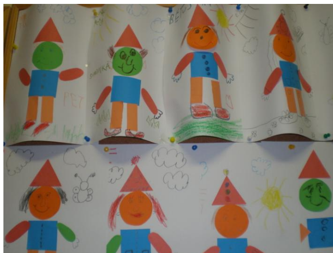
obr. 11. Nalepení šišci z geometrických tvarů