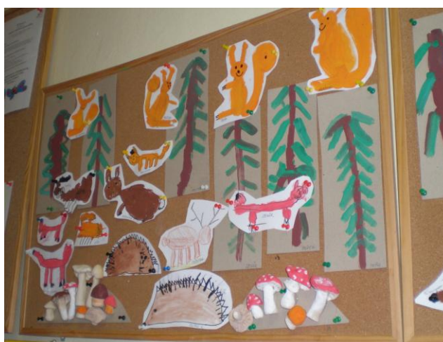
obr. 7. Malba lesních zvířat a stromů