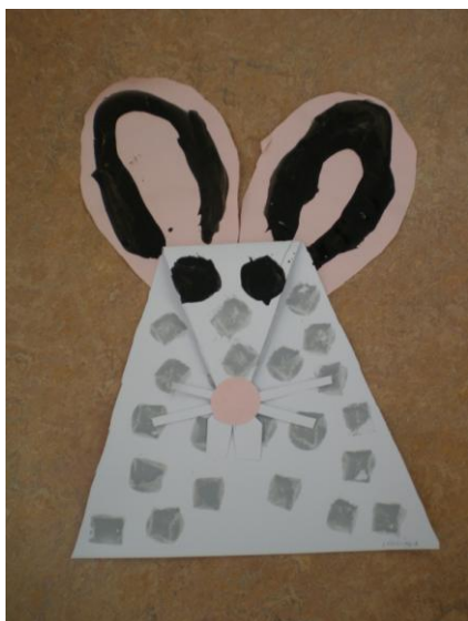
obr. 12. Otisk houbičkou