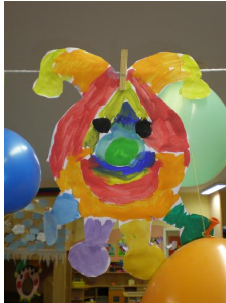
obr. 10. Namalovaný šašek