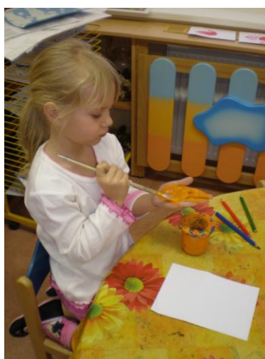
obr. 9. Otiskování dlaně