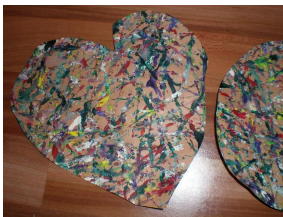
obr. 14. Otisk kuličkou

Nejprve si děti při ranních činnostech mohly vytvořit papírové perníčky technikou otisku hliněné kuličky a otisku potravinářské fólie. Nebo si mohly prohlížet obrázky a vybarvovat omalovánky z pohádky. Také několik dětí stavělo chaloupku z molitanových kostek a látek. Po těchto činnostech následovalo převyprávění pohádky společně s dětmi. Když si všechny děti pohádku připomněly, zaměřila jsem se na vlastnosti ježibaby. Děti měly za úkol vymýšlet, jaké vlastnosti mohla mít a proč byla tak zlá. Pak jsme společně vymýšleli pravidla chování při tom, když se ztratíme. Následovalo zdobení chaloupky ráno vytvořenými perníčky pomocí izolepy a hra Na spící babu. Na samém konci děti vleže relaxovaly, při hudbě doplněné zvuky přírody.