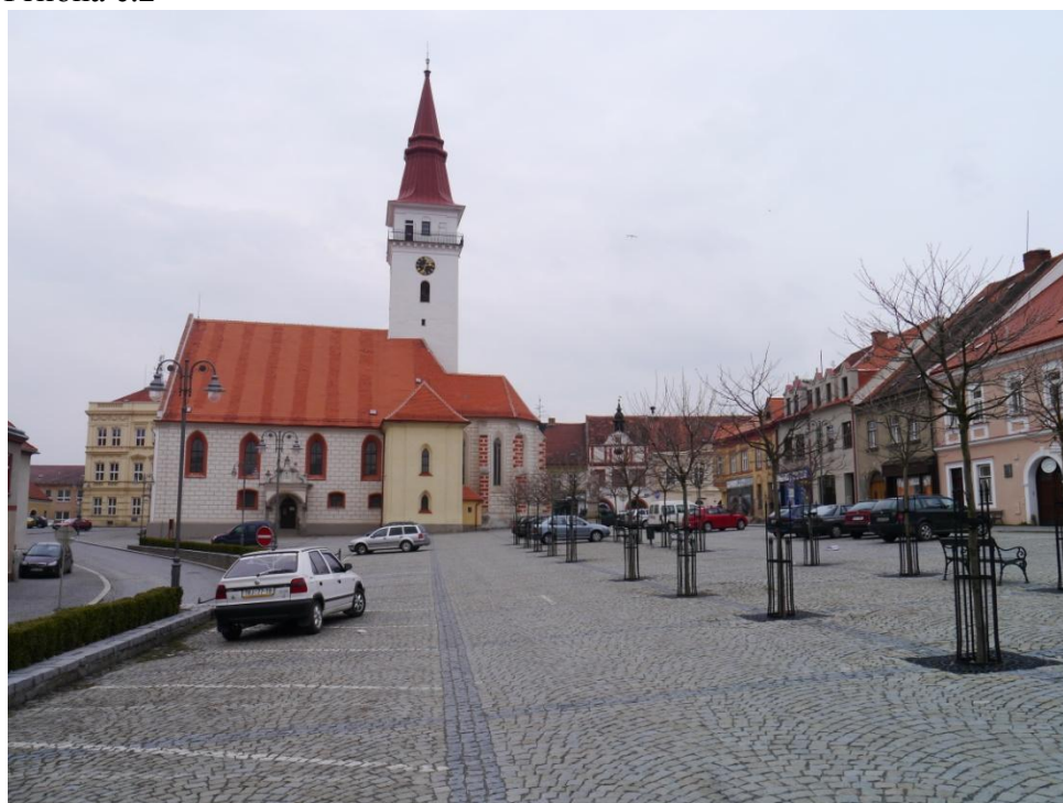
Jemnice- Náměstí Svobody