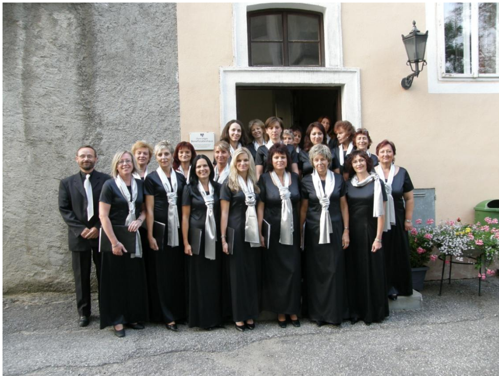
Komorní ženský sbor