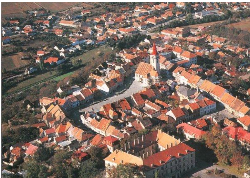
Jemnice- letecký pohled