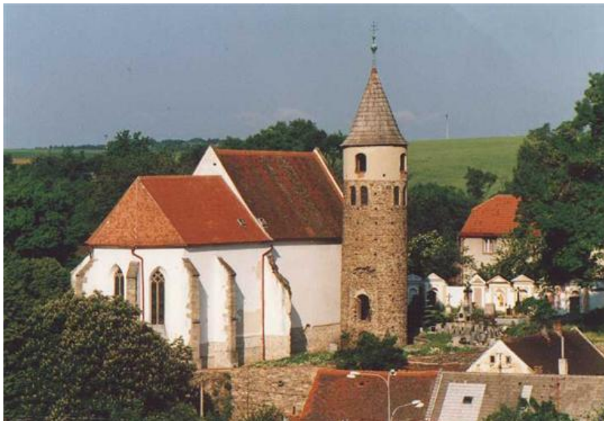
Jemnice- kostel sv. Jakuba