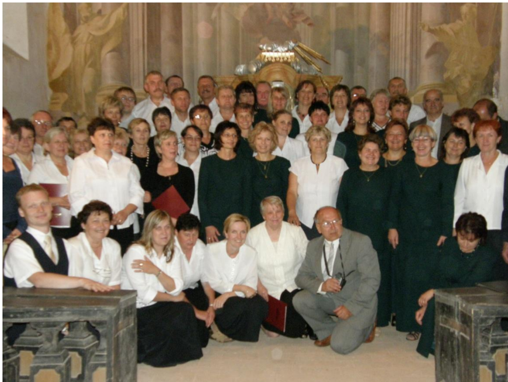
Komorní ženský a Chrámový sbor