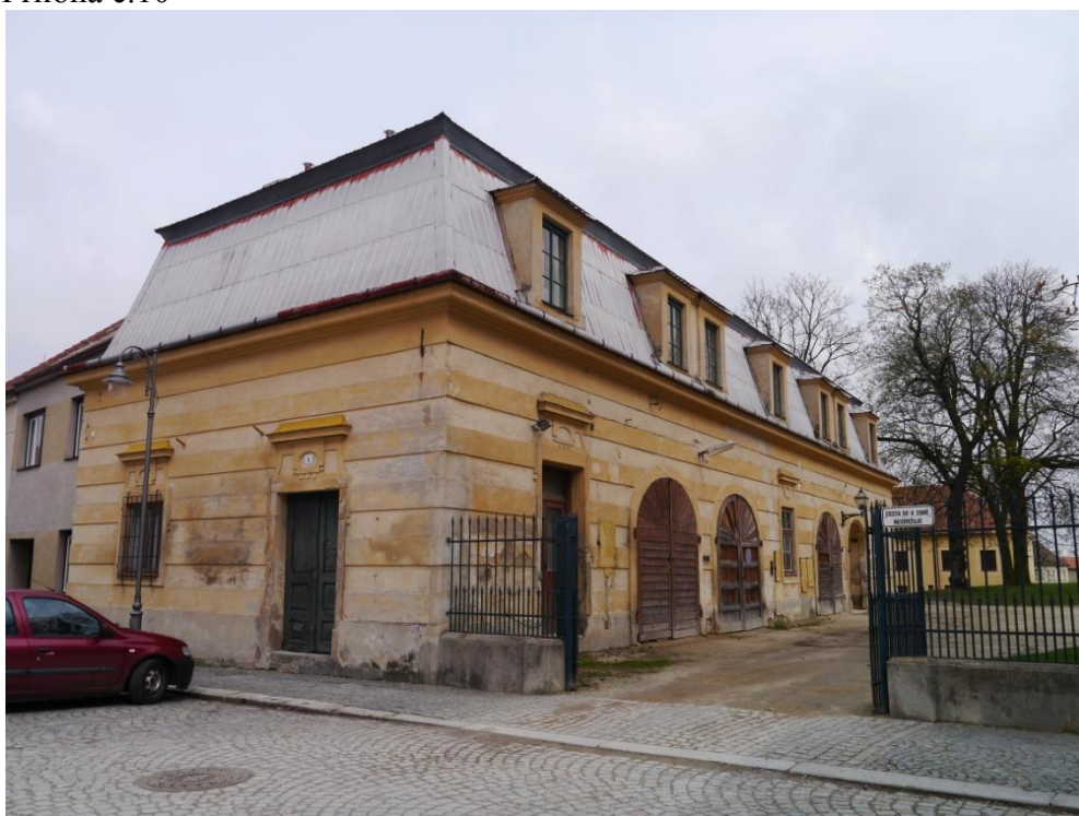
ZUŠ Jemnice- zámecká budova