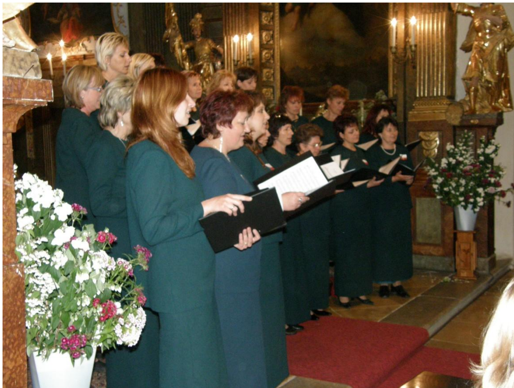
Komorní ženský sbor