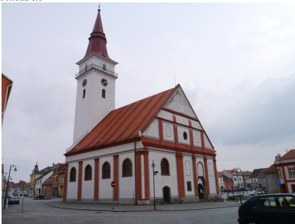
Jemnice- kostel sv. Stanislava