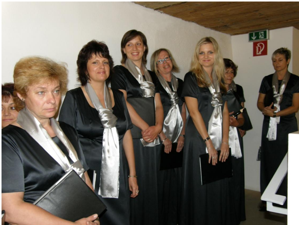
Komorní ženský sbor