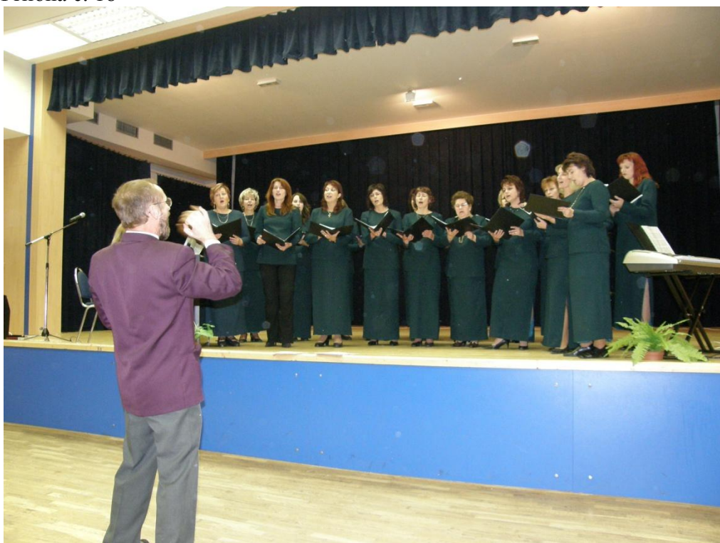
Komorní ženský sbor