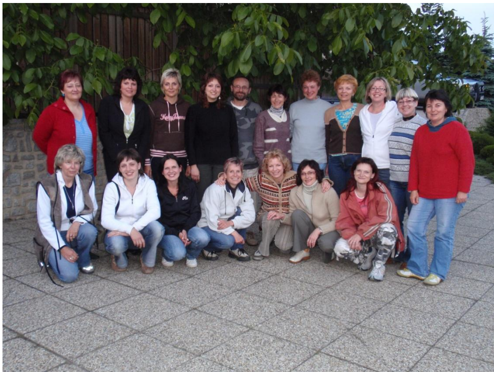
Komorní ženský sbor