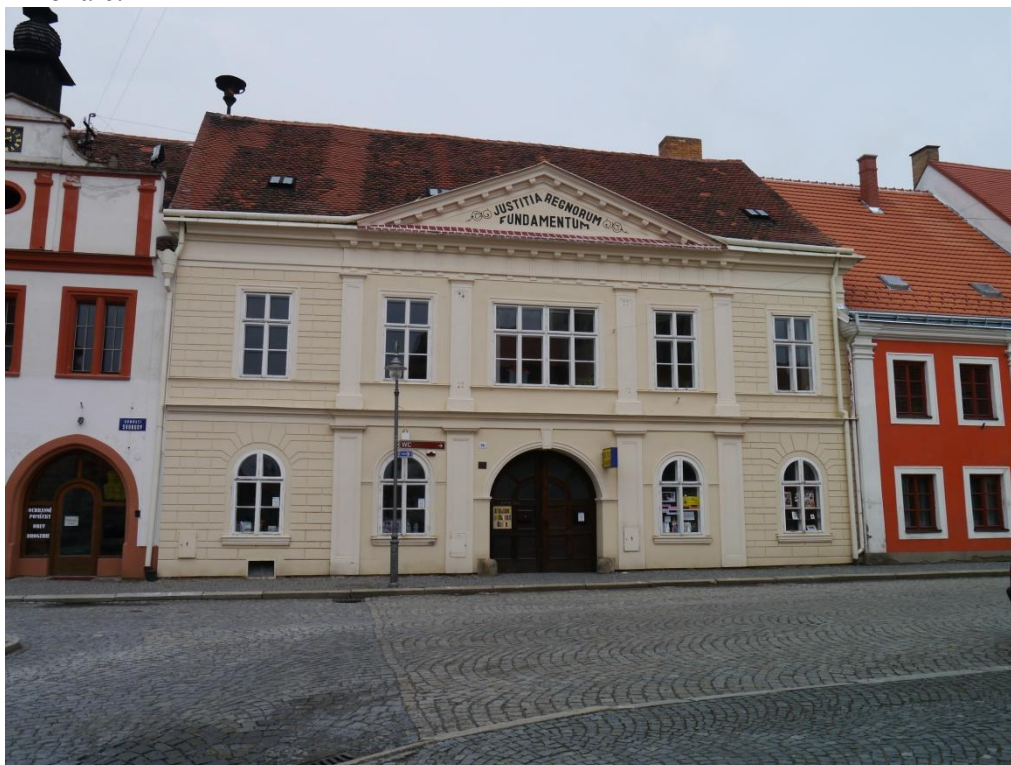
ZUŠ Jemnice- dnešní místo ZUŠ