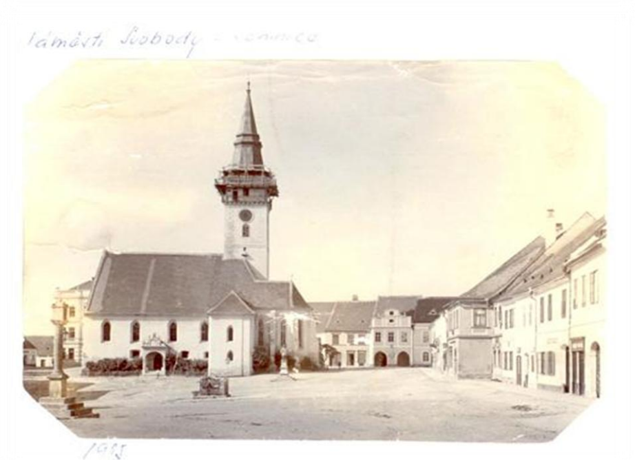
Jemnice- Náměstí Svobody