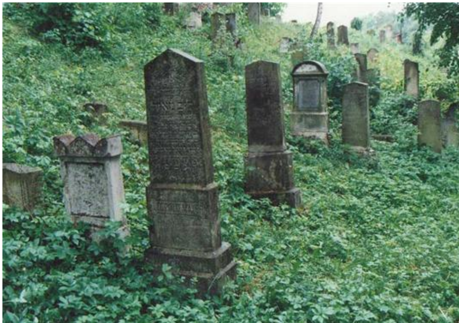
Jemnice- židovský hřbitov