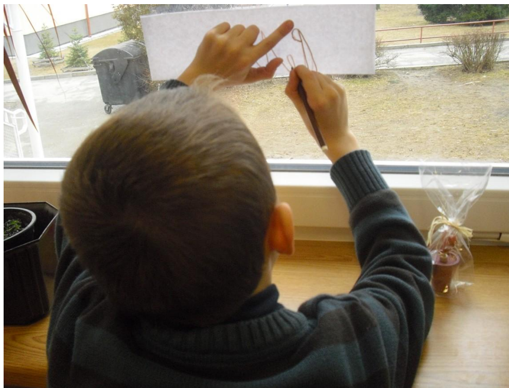
Obr. 4 - děti při výrobě totemu ze jména